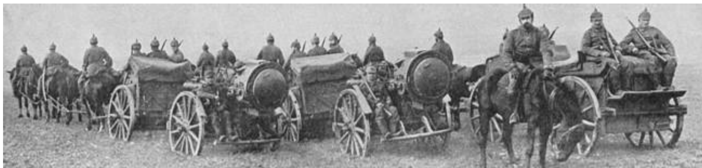
Tysk lyskasterdeling.

Lyskasterenhederne fandtes i en række forskellige udgaver, der her er eksemplificeret ved enhedstyper, oprettet af Kurhessisches Pionier-Bataillon Nr.11 (Kilde 6) - Scheinwerferzüge 3 ), Schwere Festungs-Scheinwerfer-Züge, Leichter Festungs-Scheinwerfer-Züge, Hand-Scheinwerfer-Trupps og Reserve-Scheinwerfer-Züge.