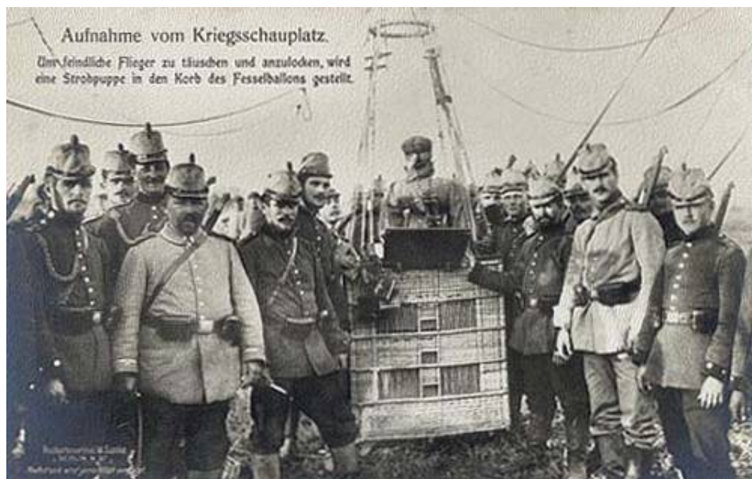
Tyske ballontropper, ca. 1914.