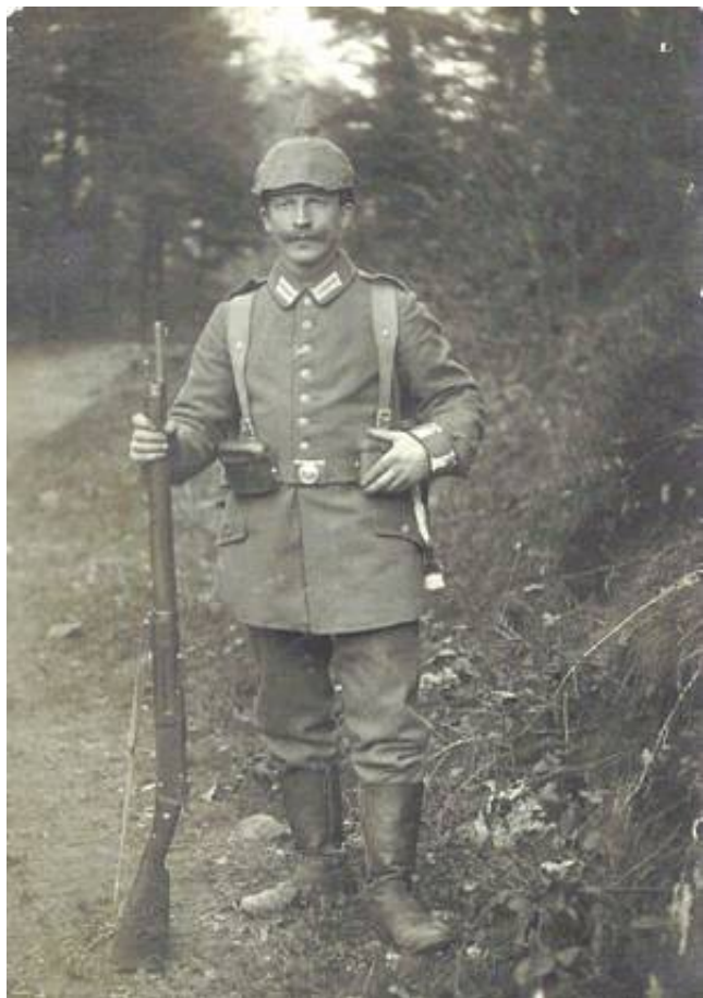
Gefreiter, Eisenbahn-Bau-Kompanie Nr. 8, 1914.

I tilknytning til disse enheder oprettedes ved mobiliseringen en række yderligere række afdelinger og underafdelinger, herunder de Festungs-Eisenbahn-Betriebs-Abteilungen og Festungs-Eisenbahn-Bau-Kompanien , der indgik i Armee-Abteilung Beseler .