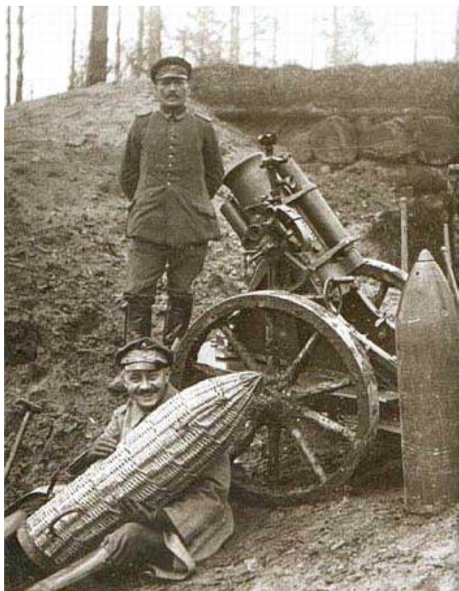
25 cm minekaster (alter Art).

Våbensystemet var udviklet af og til pionerenheder, hvilket man kan læse nærmere om i artiklen Die deutschen Minenwerfer und Granatenwerfer im Ersten Weltkrieg (Battlefield 1918), hvorfra også det nok noget senere billede stammer.