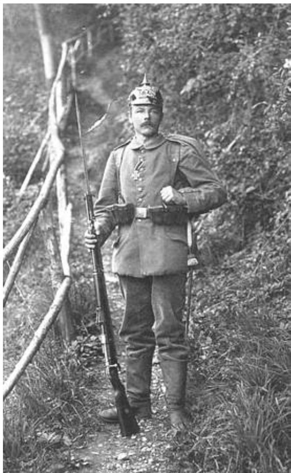
Soldat fra en fæstningsmaskingeværafdeling, ca. 1914.

I tilknytning til felthærens maskingeværenheder, se Om tyske maskingevær- og jægerenheder, 1914, fandtes en række fæstningsmaskingeværenheder, af hvilke der i 1913 var oprettet 15 afdelinger (Kilde 10). Tre af disse afdelinger indgik i Armee-Abteilung Beseler, hvor de var afgivet til Belejringsartilleriet, måske som artilleribedækning.