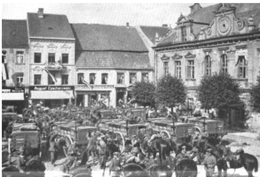
Telegraphen-Abteilung des Oberkommandos der 9. Armee auf dem Marktplatz in Osterode im September 1914.

Begge billeder er fundet på Internettet.