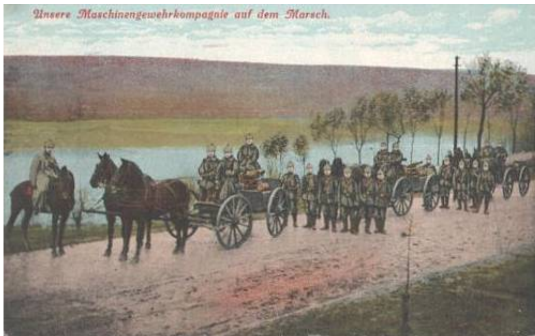
Unsere Maschinengewehr-Kompagnie auf dem Marsch. Fra Alte Ansichtskarten.

Bortset fra antallet af maskingeværer i de respektive fæstningsmaskingeværenheder, foreligger der ikke oplysninger om enhedernes nærmere organisation mv.