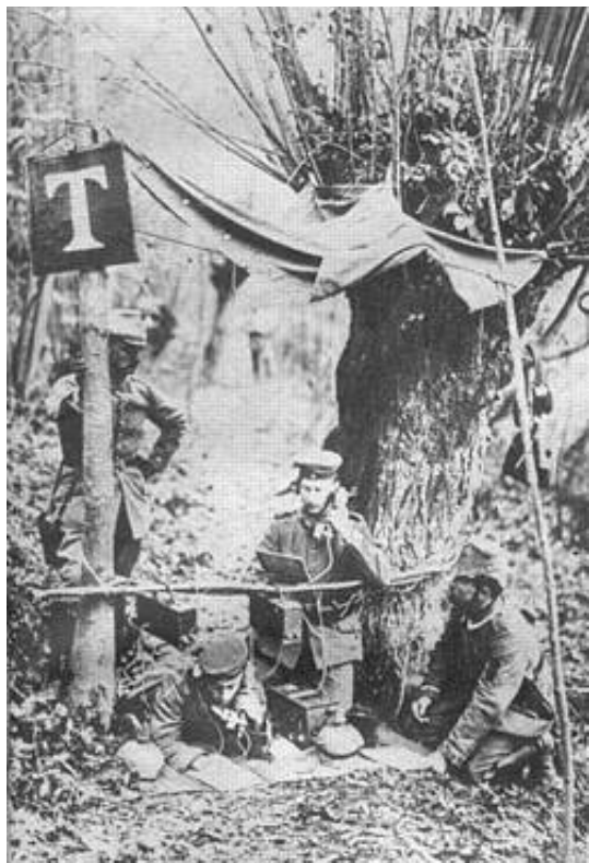
Tysk felttelefon, ca. 1914.