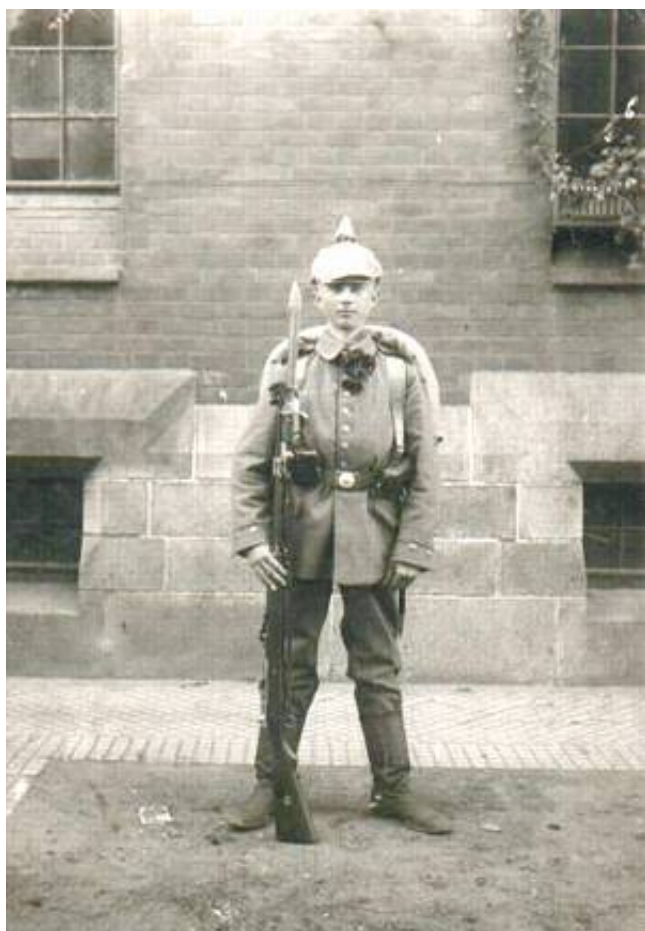
Kurhessischen Pionier-Bataillon Nr. 11. Fra Alte Ansichtskarten.

Westfalen stand wie ein Fels - Die westfälischen Regimenter im Weltkrieg (Kilde 4) giver oplysninger om chefen for 3. Kompagni af 24. Pionerregiment, kaptajn Ehringhaus, der udmærkede sig ved stormen på Fort Wawre-Sankt Catherine og mellemværket ved Dorpvelde. For sin indsats tildeles kaptajnen Jernkorset af 1. klasse, et af de første der uddeles af chefen for Armee-Abteilung Beseler , general von Beseler.