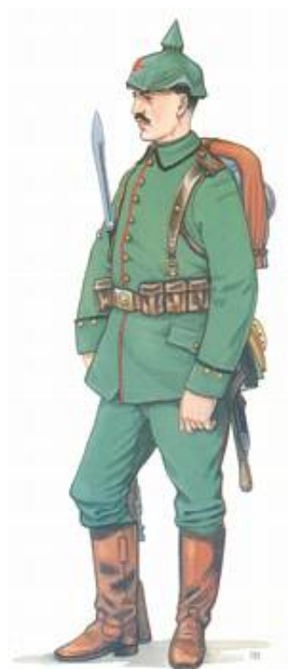
Magdeburgisches Pionier-Bataillon Nr. 4. Tegnet af Bryan Fosten. Fra Kilde 3.

En opgave som indtagelsen af Antwerpen krævede med byens omfattende befæstningsanlæg også en omfattende indsats af ingeniørtropper. Blandt ingeniørtroppernes opgaver hørte anlæggelsen af stillinger til belejringsartilleriet men ikke mindst en aktiv deltagelse sammen med infanteriets angrebssolonner var i højsædet. De belgiske forter var omgivet af våde grave, der skulle krydses, ligesom der i dele af terrænet var udført eller opstået oversvømmelser. Befæstningsanlæggene og de feltbefæstninger, der var anlagt mellem de permanente anlæg, var omgivet af pigtrådsspærringer, der skulle gennembrydes.