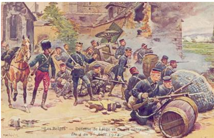
Forsvaret af Liège og omegn - 4. til 25. august 1914.

Fortets hovedarmering kunne ikke sænke sine kanoner så langt ned, at de kunne beskyde minekasternes stilling, og jernbanevognene gav skjul og nogen dækning mod fortets mindre kanoner og geværskud. Stillingerne befandt sig dog så tæt på målet, at de kunne nås af splinter fra minekasternes egne granater!