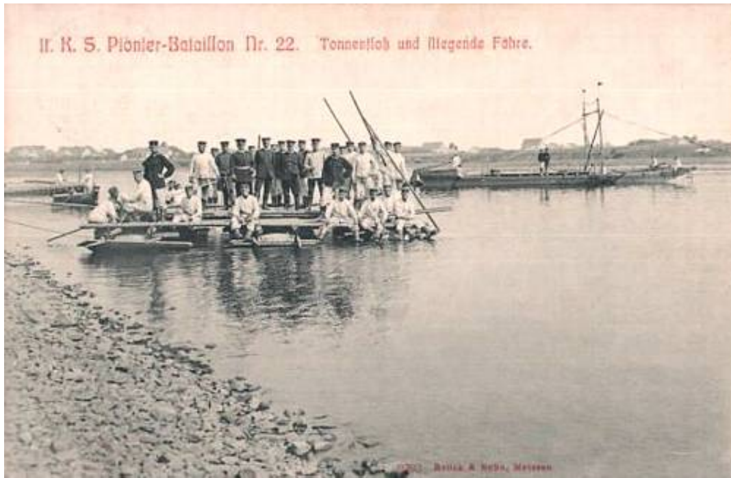
Kgl. Sächs. 2. Pionier-Bataillon Nr. 22 - Tonnenfloß und fliegende Fähre, 1910.

Områdets naturlige og kunstige vandhindringer, gav god brug for feltbrotrænet ved 5. og 6. Reserveinfanteridivision (se Del 1), men også mere improviseret materiel, så som færger og stormspange.