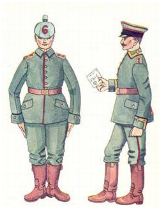
Tysk feltartilleri, 1914-1915. Artillerikonstabel og underofficer. Fra Kilde 5.

Artillerikonstabelen bærer den traditionelle pikkelhue (med kugle). 6-tallet på hjelmovertrækket antyder, at han tilhører Feld-Artillerie-Regiment von Peucker (1. Schlesisches) Nr.6 .