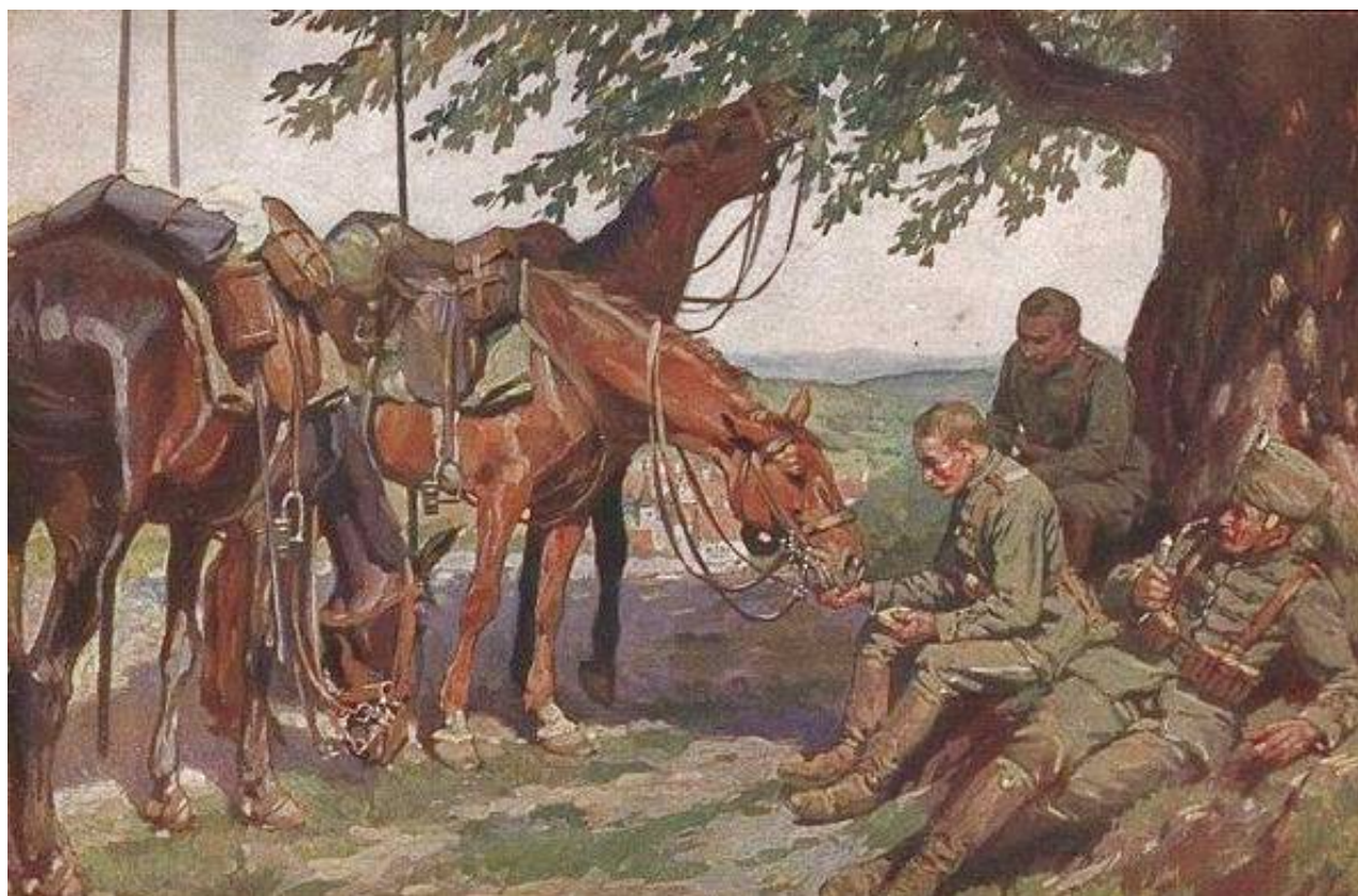
Tyske husarer, 1914.

Samtidigt feltpostkort tegnet af T.R. Rache, udgivet af Det kongelige saksiske Indenrigsministerium som nummer 6 i serien Der europäische Krieg 1914/15 .