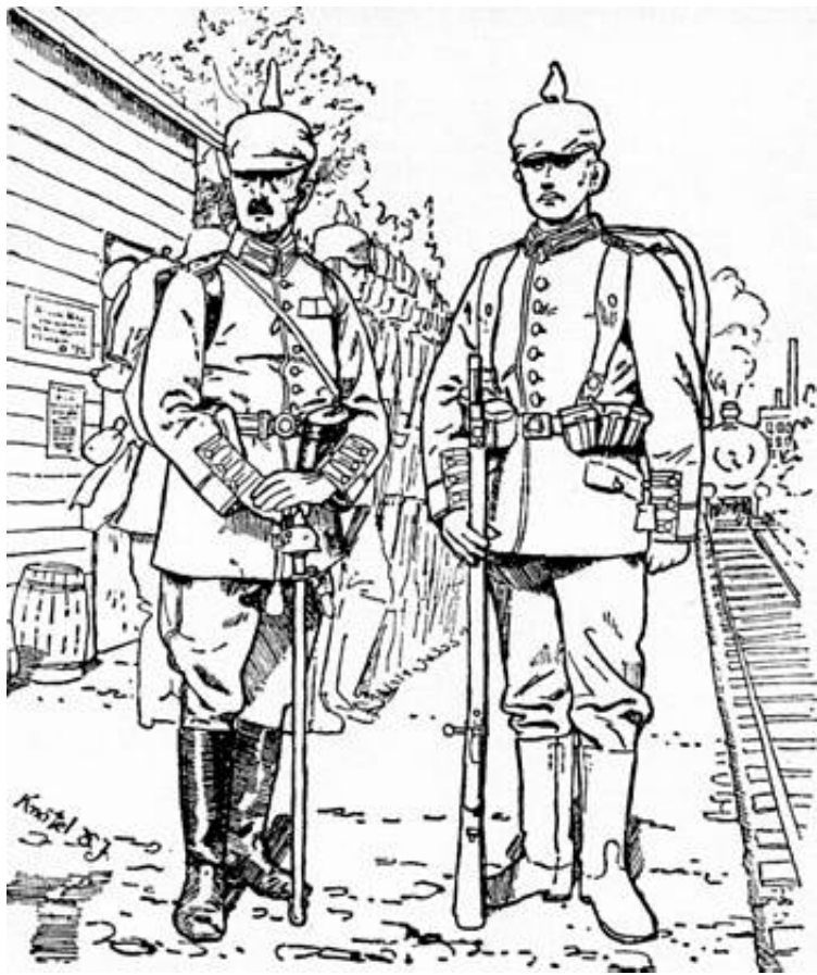
Tysk infanteri, 1914.