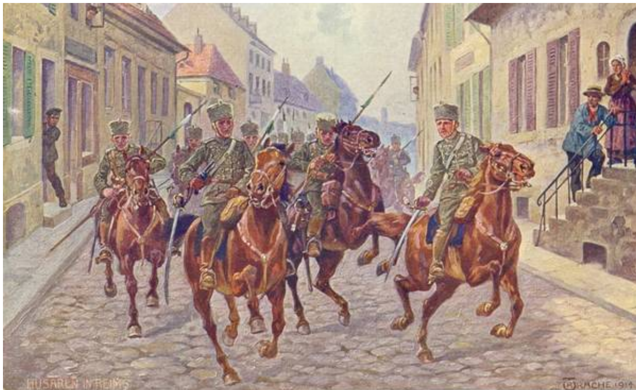
Tyske husarer i Reims, 9. september 1914 4 ).

Samtidigt feltpostkort tegnet af T.R. Rache, udgivet af Det kongelige saksiske Indenrigsministerium som nummer 6 i serien Der europäische Krieg 1914/15 .