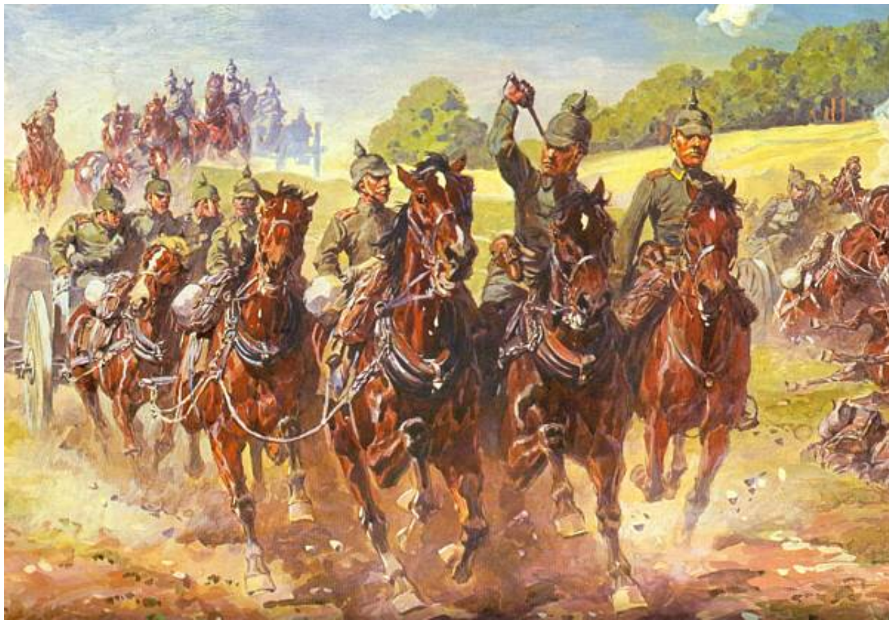
Tysk feltartilleri, 1914. Kunstneren er ikke kendt. Billedet stammer fra en udgave af Deutsches Soldatenkalender.

Enheden foreligger ikke oplyst, men henset til brugen af pikkelhuer (med spids) snarere end pikkelhue med kugle, må der være tale om en bayersk enhed, idet artilleriet herfra ikke anvendte den traditionelle hovedbeklædning for artillerister - pikkelhue med kugle.