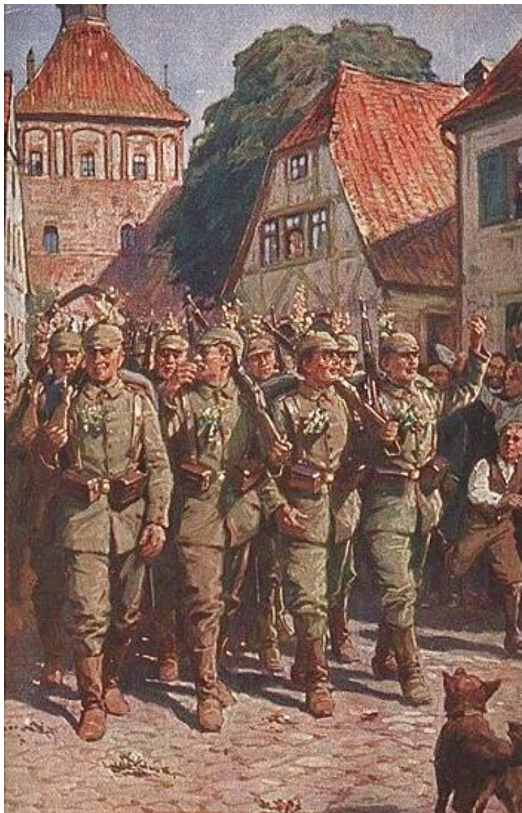
Udmarchen i 1914.

Samtidigt postkort tegnet af A. Roloff, gengivet fra hjemmesiden The Great War in a Different Light.