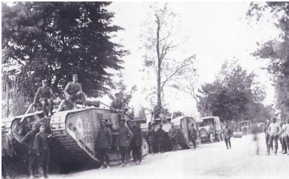
Tyske beutepanzer (erobrede kampvogne) fra 14. detachment tankes op på vej til frontlinien

Angrebet på Fort de la Pompelle var et led i den 3. tyske offensiv på Vestfronten i 1918. Offensiven startede 27. maj og kaldes også det 3. Aisne-slag eller Blücher-York-offensiven.