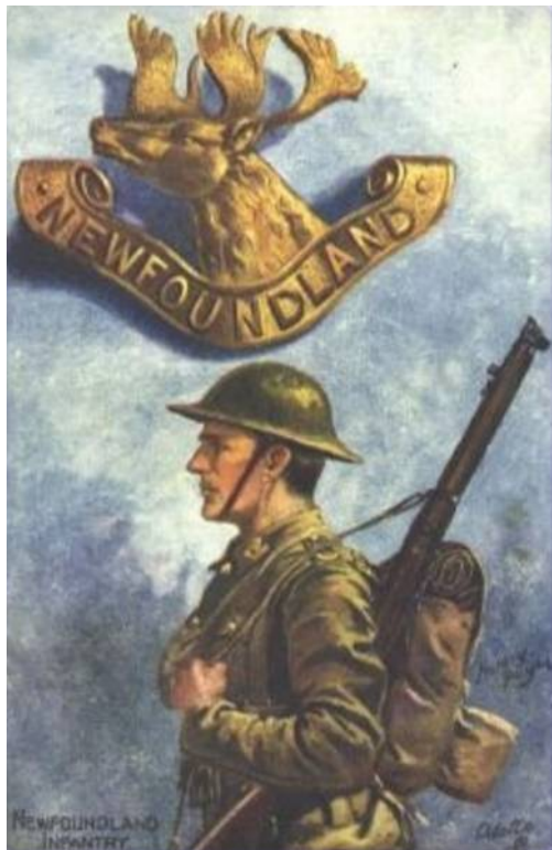
Newfoundland Infantry, ca. 1918. Tegnet af Harry Payne.

Bortset fra de oprindelige blå viklers og regimentsmærket er jeg ikke bekendt med, at regimentet var udrustet på anden måde end øvrige engelske infanterienheder.