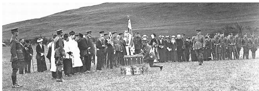
Regimentsfanen overrækkes til 1 st Newfoundland Regiment ved en parade 10. juni 1915. Fra Kilde 2.

Kilde 9, som er guvernørens tale i forbindelse med tilbageleveringen, kan anbefales som et spændende indblik i fanernes historie og fortsat store symbolske betydning som mindet om de mange, der faldt under Første Verdenskrig.