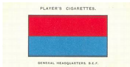
General Headquarters, B.E.F. Kort nr. 65 i Player's cigaretkortserie Army, Corps and Divisional Signs 1914-1918, Series 2.