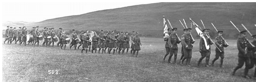
Afmarch efter faneoverrækkelsen 10. juni 1915. Begge regimentets faner ses her. Fra Kilde 2.