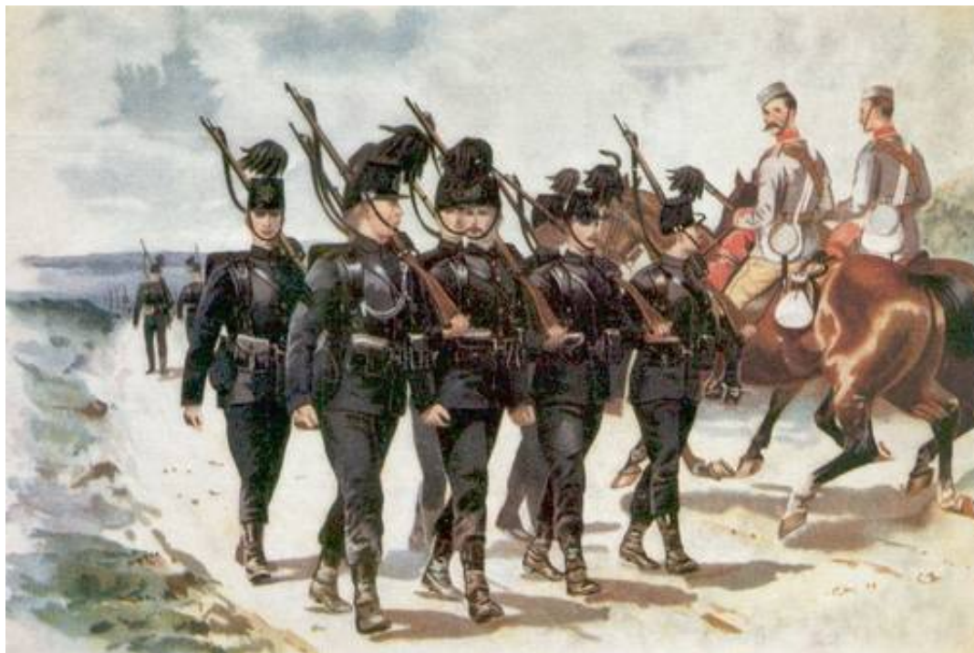
1 st City of London Volunteer Rifle Brigade, ca. 1900. Tegnet af Richard Simkin. Fra Modelworld, oktober 1972.

Da man var afskåret fra at bruge de frivillige korps på grund af deres territoriale tjenestebegrænsning, hvorfor det blev nødvendigt at danne særlige infanteri- og rytterenheder, der kunne sendes til Sydafrika.