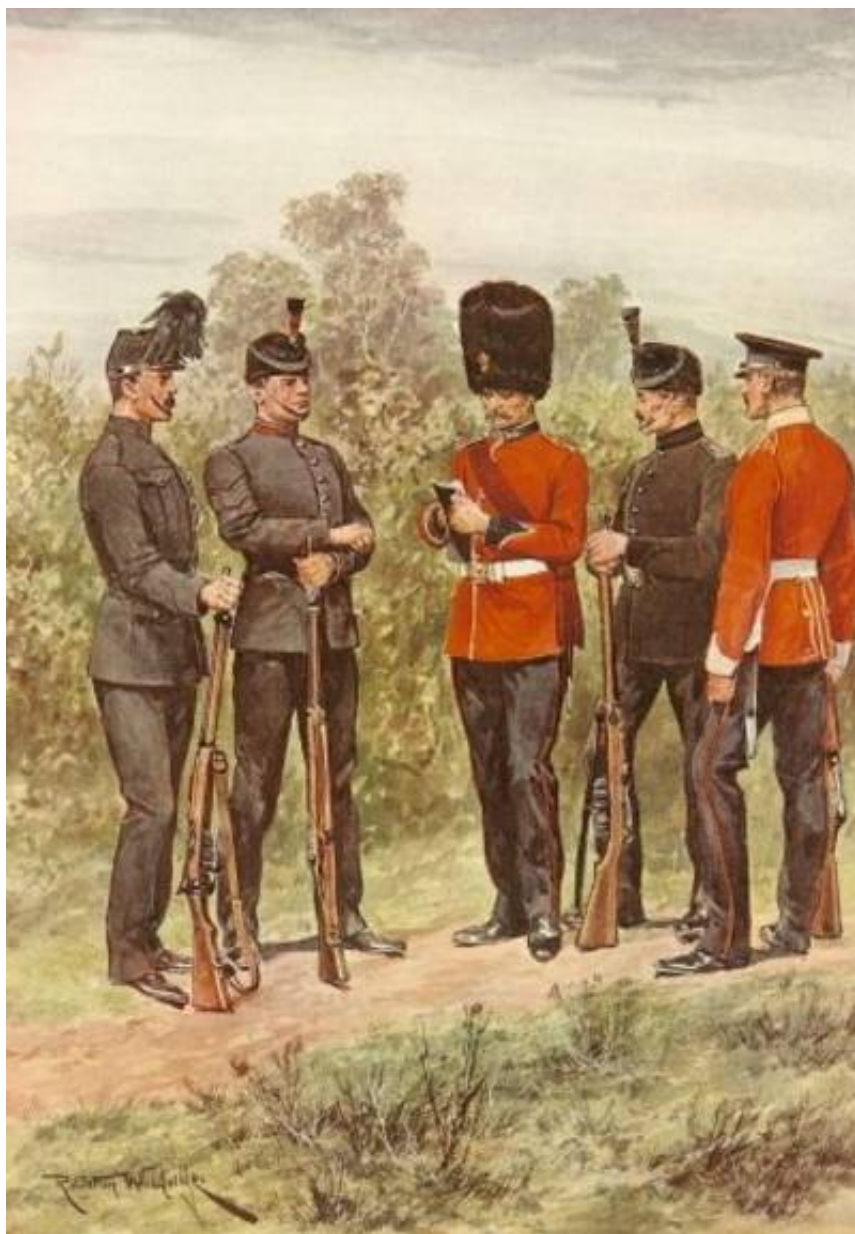
The London Regiment, City of London Battalions, ca. 1911. Efter tegning af Richard Caton Woodville.

The London Regiment blev valgt som betegnelse for de tidligere skyttekorps i London. Det blev en titel snarere end en enhed, idet regimentet hverken havde nogen stab eller personel i sig selv, ej heller noget regimentsmærke. De 28 bataljoner i London var således selvstændige, men en del havde en vis tilknytning til den regulære hærs regimenter.