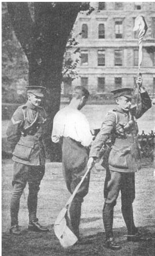
Øvelse med signalflag ved Inns of Court Officers Training Corps i 1914.

Illustrationerne stammer fra Regimental Badges af T.J. Edwards, Gale & Polden Limited, 1951.