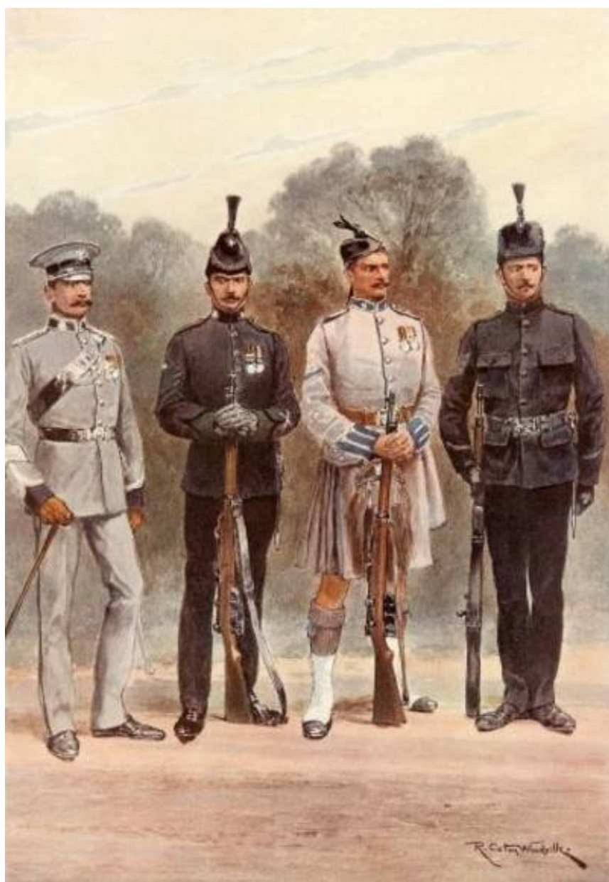
The London Regiment, County of London Battalions, ca. 1911. Efter tegning af Richard Caton Woodville.