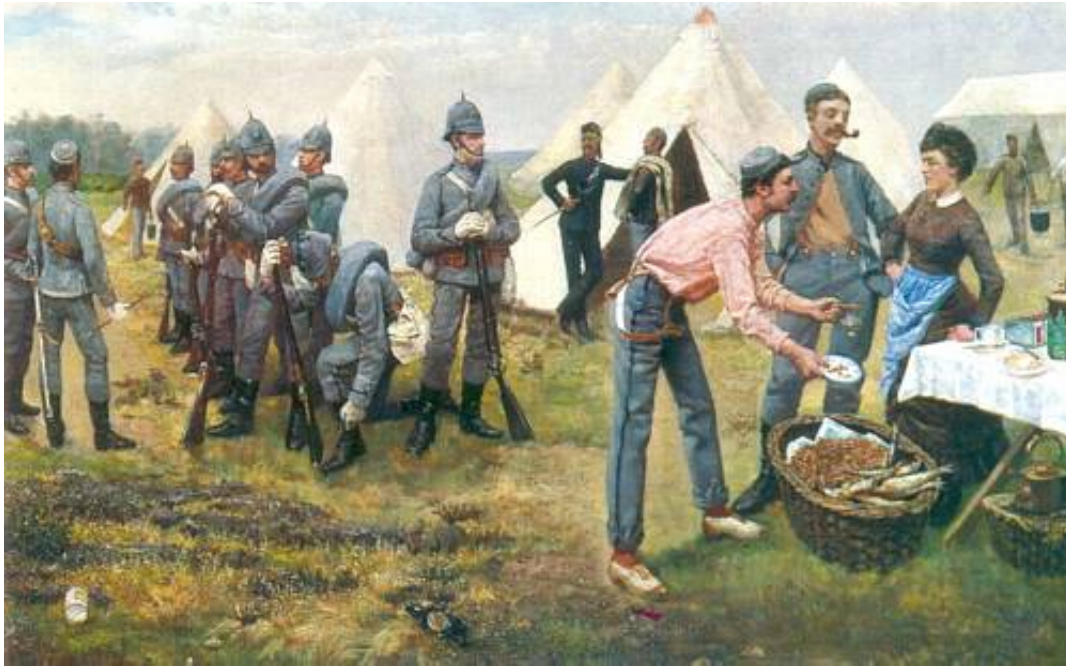
38 th Middlesex (Artists') Volunteer Rifle Corps in Camp, 1884.

The London Regiment, Territorial Force, blev oprettet den 1. april 1908, da Territorial Forces blev formeret som paraplyorganisation for den engelske hærs frivillige reserveenheder.