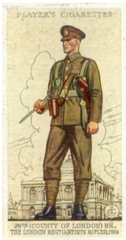
28 th (County of London) Bn. London Regiment (Artists Rifles), 1914.

Kort 30 i Player's cigaretkortserie Uniforms of the Territorial Army, 1939.