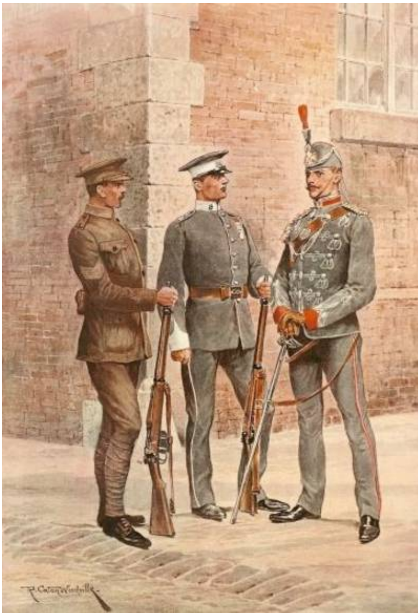
The London Regiment, County of London Battalions, ca. 1911. Efter tegning af Richard Caton Woodville.