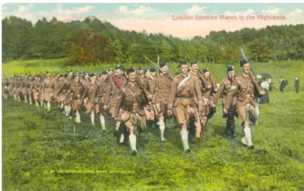
London Scottish - March to the Highlands, ca. 1911.

Da London Scottish var den eneste enhed af sin art i The London Regiment, er deres uniform let at identificere; soldaten i den grå uniform, er sandsynligvis fra Civil Service Rifles.