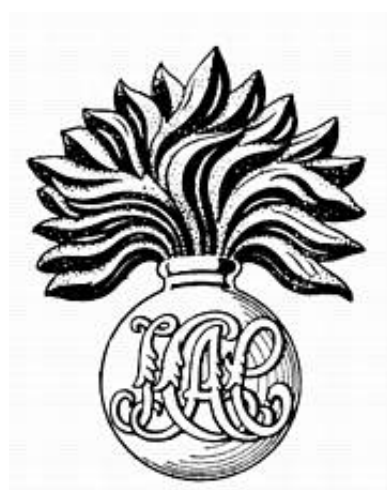
The Honourable Artillery Company, Infantry