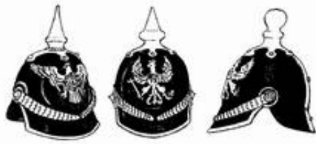
Hjelm m. 1860 Grenadierinfanteri