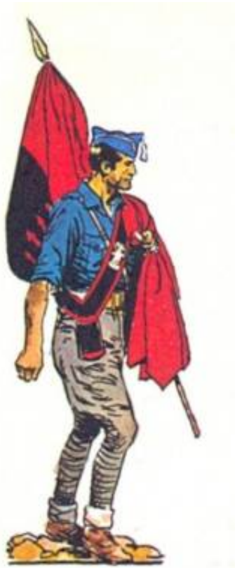
Falangistisk fanebærer. Fra Kilde 14.