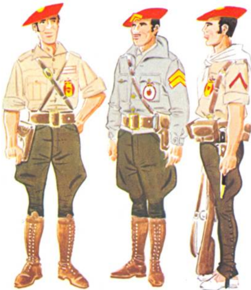
Carlistiske militsenheder fra Andalusien, 1936, tegnet af José Maria Boeno.