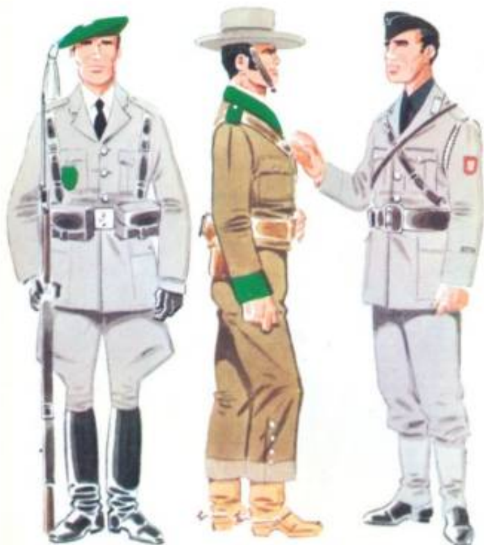
Planche LVI i Kilde 3 Viser bl.a. paradeuniformen fra 1939.