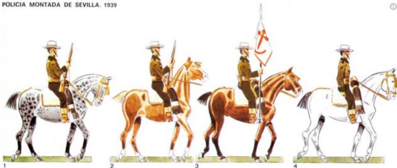
Policía Montada de Sevilla, 1939. Fra Kilde 11, Planche 7.

Planchen, der måler format 31x24 cm, er fremstillet i stil med et traditionelt udklipsark. Figur 4 viser en kaptajn; figur 3, en sergent og estandartbærer; figur 2 og 1 er menige soldater.