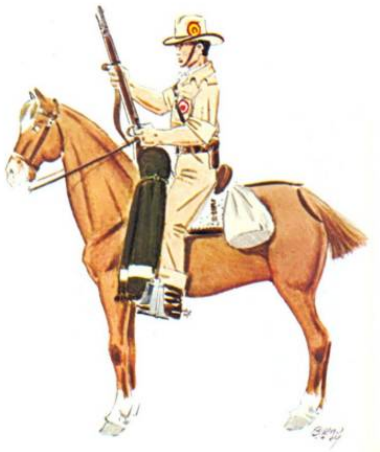
Frivillig soldat fra Policía Montada de Sevilla, 1936, tegnet af José Maria Boeno. Fra Kilde 3 (Planche LV).

Feltuniformen bestod af en sandfarvet overall ( mono ), mens vinteruniformen var af khakifarvet klæde. Både sommer og vinter bar soldaterne en bredskygget hat ( sombrero ).