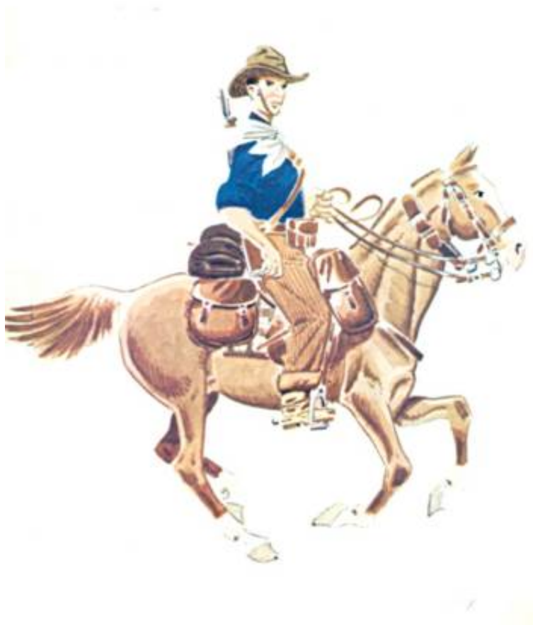
Frivillig soldat fra Caballería de Falange, 1936,