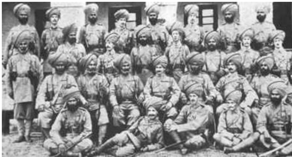
Officers of 14th King George's Own Ferozepore Sikhs, just before Gallipoli.