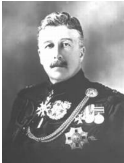
Arthur Foljambe, jarl af Liverpool.

En af de enheder, der kort optræder under kampene i Ægypten, er det krigstidsoprettede regiment, New Zealand Rifle Brigade.