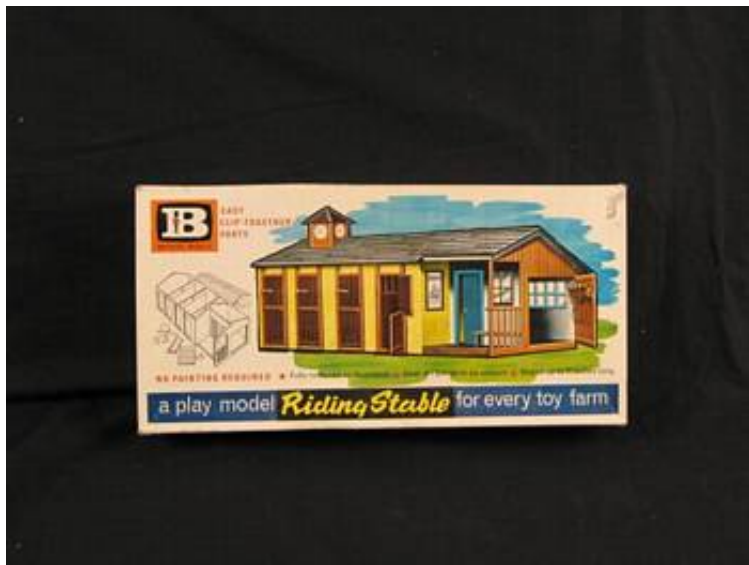
Den anvendte Britains Riding Stable.