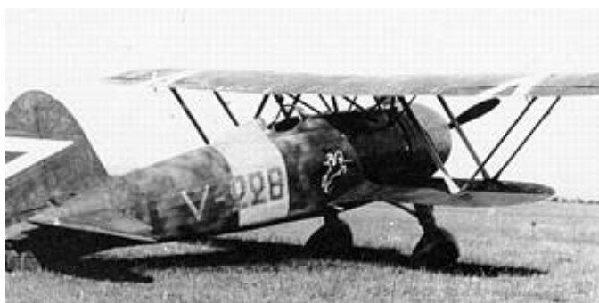
Et jagerfly af typen Cr 42 - fra 4. Jagereskadrille.