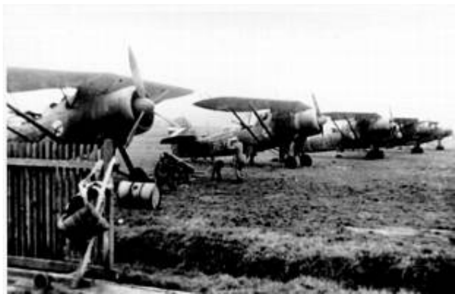
Rekognosceringsfly af typen He 46.