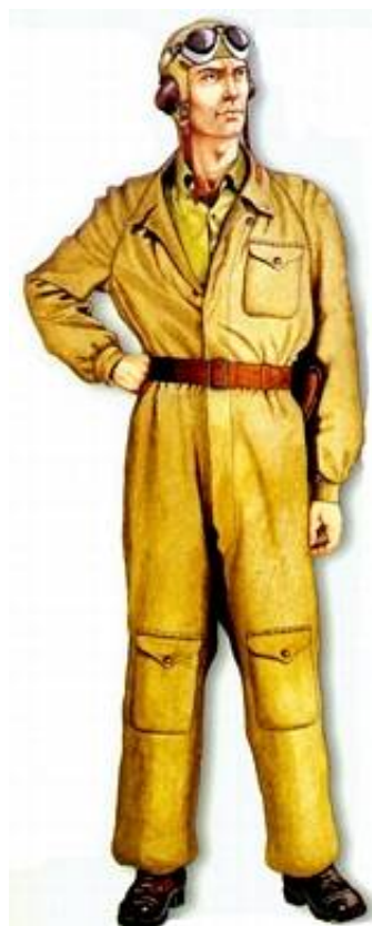
Pilot, 1942-43. Kilde 11