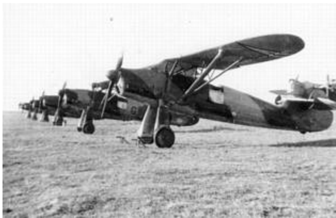
Rekognosceringsfly af typen WM 21.