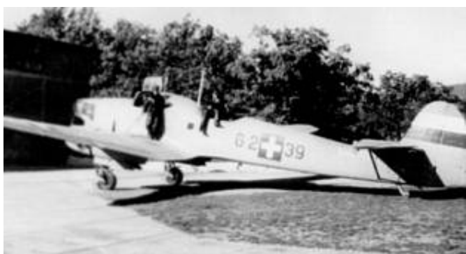
Bombefly/transportfly af typen Fw58. Fotografiet viser det noget senere nationalitetsmærke.

Ovenstående billedmateriale stammer fra Kilde 7, som er leveringsdygtig i fotografier og enkelte tegninger af samtlige flytyper, der gjorde tjeneste i det ungarske flyvevåben.