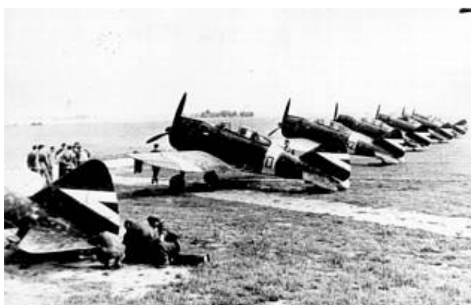
Jagerfly af typen Re 2000.