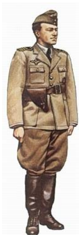
Kaptajn, 1944. Kilde 5