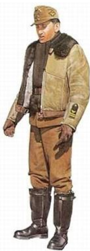
Løjtnant, 1943. Kilde 6