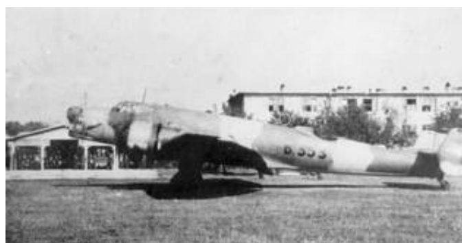
Bombefly af typen Ju 86.