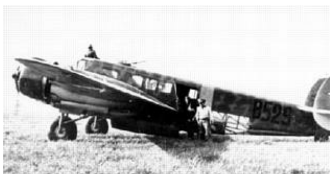
Bombefly af typen Ca 135.