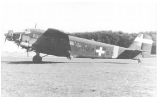
Transportfly af typen Ju 52. Fotografiet viser det noget senere nationalitetsmærke.