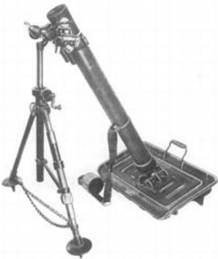
8 cm mortar m/29.