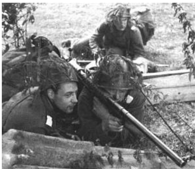
20 mm panserværnsgevær m/42.