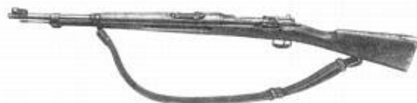
6,5 mm gevær m/38.

Gevær m/38 var i princippet gevær m/96 med forbedrede sigtemidler; begge udgaver blev udleveret sideløbende.