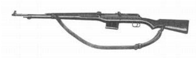
6,5 mm automatgevær m/42.