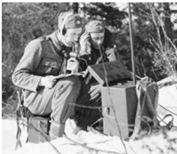
Radiomænd, med 10 Watts bärbar radiostation m/39-43 4 ).

Foruden radiomateriel rådede forbindelsesdelingen også over felttelefonmateriel (telefoner, omstillingsborde, linjebygningsmateriel mv.)