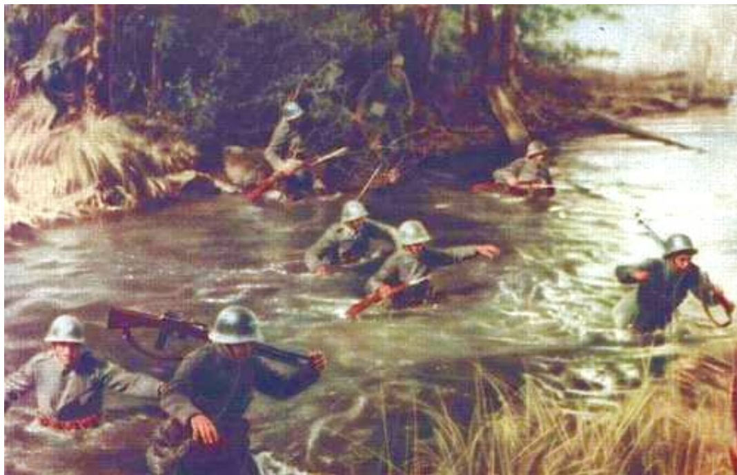
Svenske soldater krydser et vandløb, ca. 1944.

Soldat nr. 2 fra venstre bærer et let maskingevær m/37, mens soldaten yderst til højre antages at bære delingens panserværnsgevær m/42.