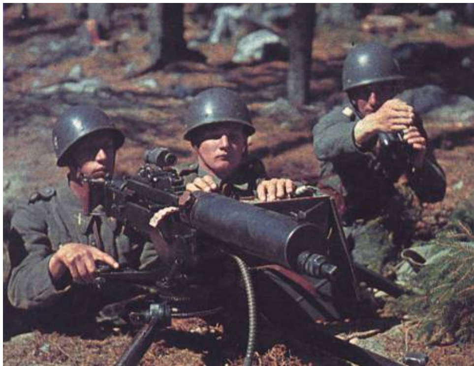
Middeltungt maskingevær m/36, 1943.

Regimentets maskingeværkompani ( kulsprutekompani ) består af: