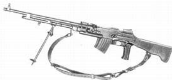
6,5 mm let maskingevær m/37.

Gevær m/38 var i princippet gevær m/96 med forbedrede sigtemidler; begge udgaver blev udleveret sideløbende.