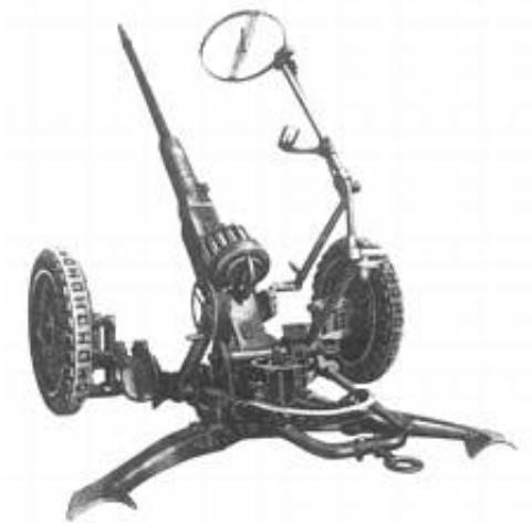
20 mm maskinkanon m/40.