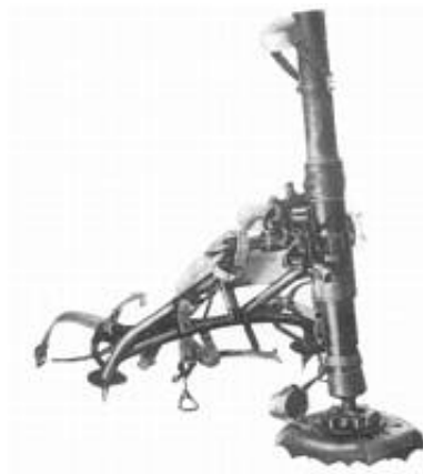
47 mm mortar m/40.