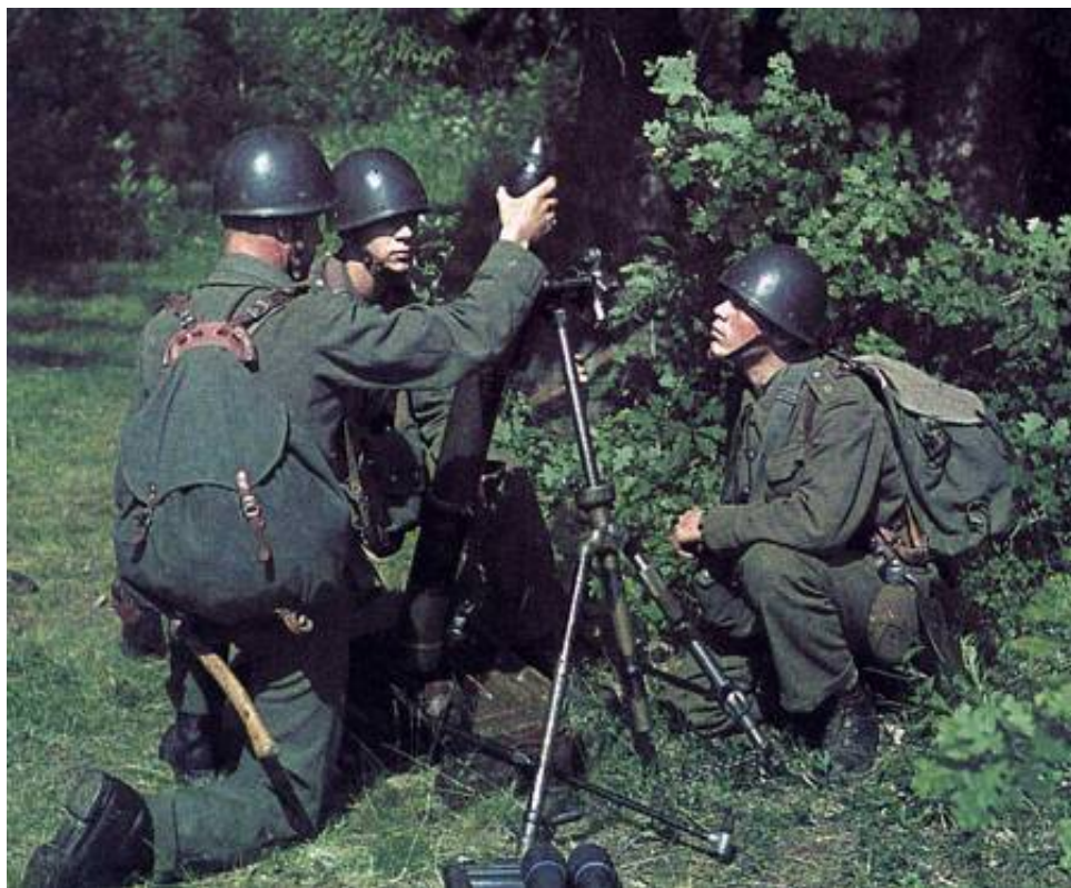
Middeltung mortar m/29, sommeren 1943.