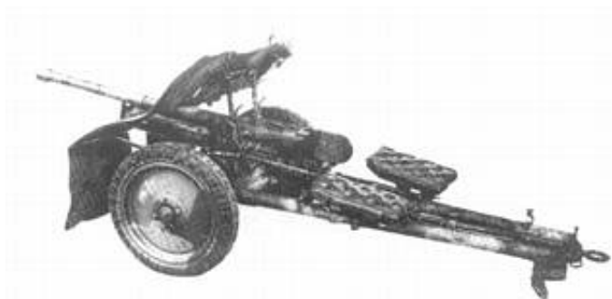
37 mm panserværnskanon m/38.