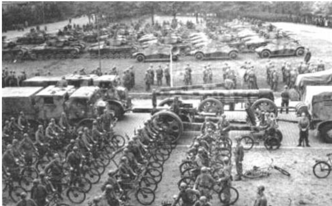
Svensk parade, ca. 1943.

Baggrunden for denne beskrivelse af den svenske hær under Anden Verdenskrig er ønsket om at undersøge, hvorledes de svenske enheder, der kunne have deltaget i Operation Rådta Danmark, var udrustet og organiseret.