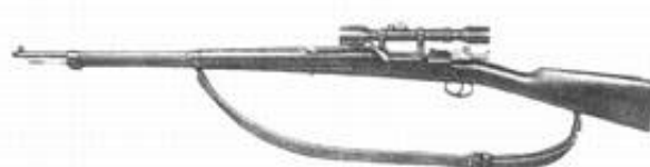
6,5 m finskydningsgevær m/41, med kikkertsigte m/41.