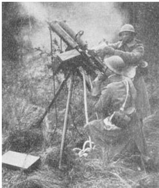
Luftværnsmaskingevær, ca. 1938.