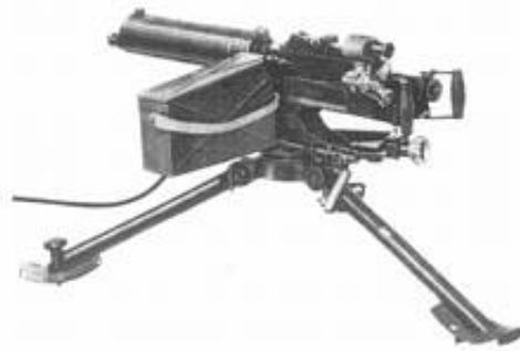
6,5 mm maskingevær m/36.