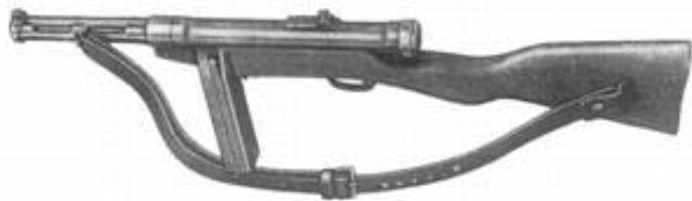
9 mm maskinpistol m/37-39.