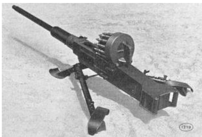
20 mm maskinkanon m/40, i panserværnslavet m/40. Fra Kilde 6.

Kilder nævner ikke delingstroppen specifikt.