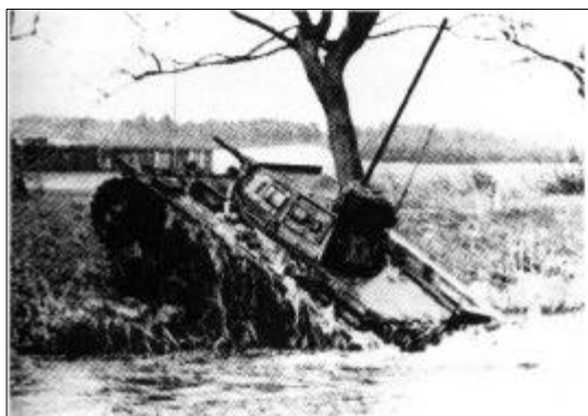
Pz III Tauchpanzer

Kl. 4.15 sprang de forreste styrker i deres gummi- og stormbåde og satte over floden. Infanteristerne og motorcyklisterne medførte lette panserværnskanoner og tunge maskingeværer. Russernes posteringer ved floden skød med automatiske geværer og lette maskingeværer, men blev hurtigt nedkæmpet. Dele af motorcykelbataljonen gravede sig ned. Derefter førte man i hast så store styrker, som det var muligt for bådene at tage, over vandløbet. Pionererne begyndte bygningen af en pontonbro.