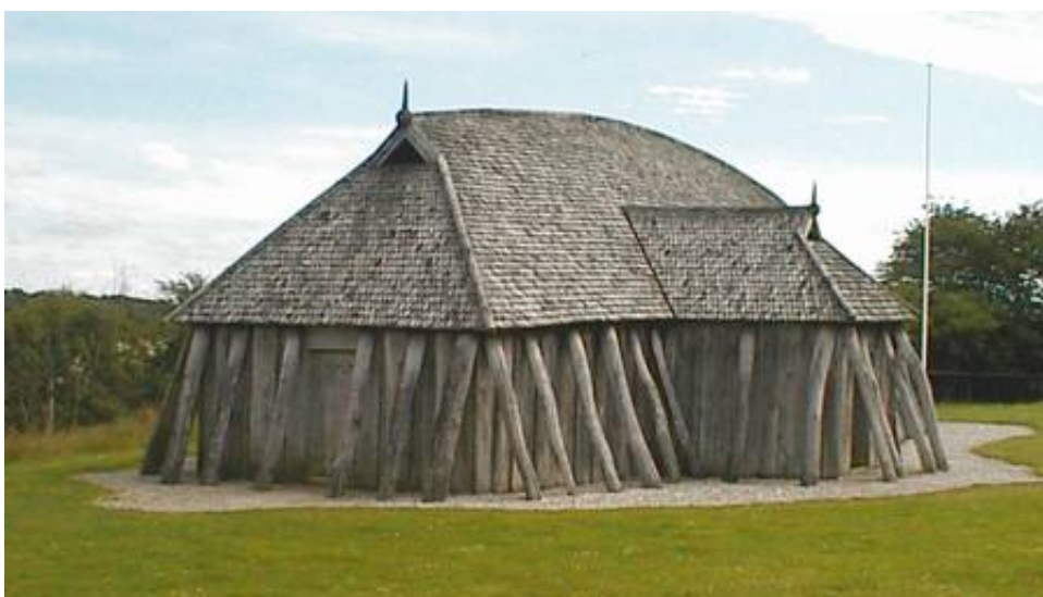
Kopien af langhuset ved Fyrkat

I forbindelse med køb af billetten udleveres en lille folder (een A4-side), hvor der er lidt mere information om stedet.