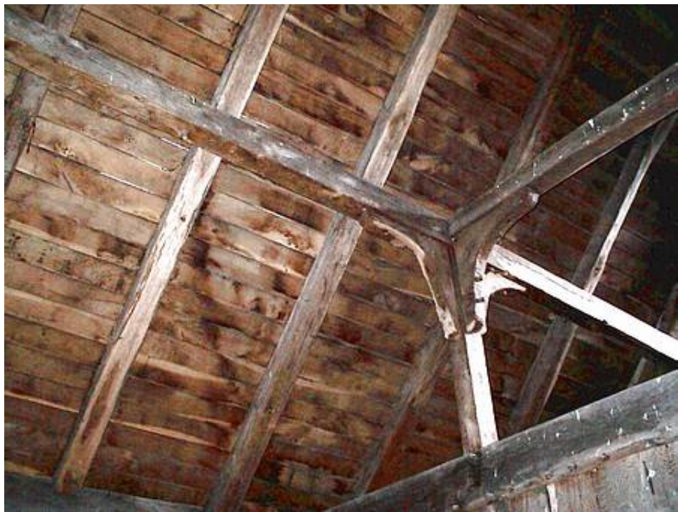
Interiør fra langhuset