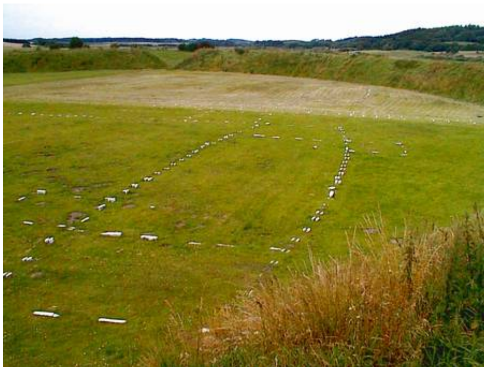
Vue over Fyrkat fra volden