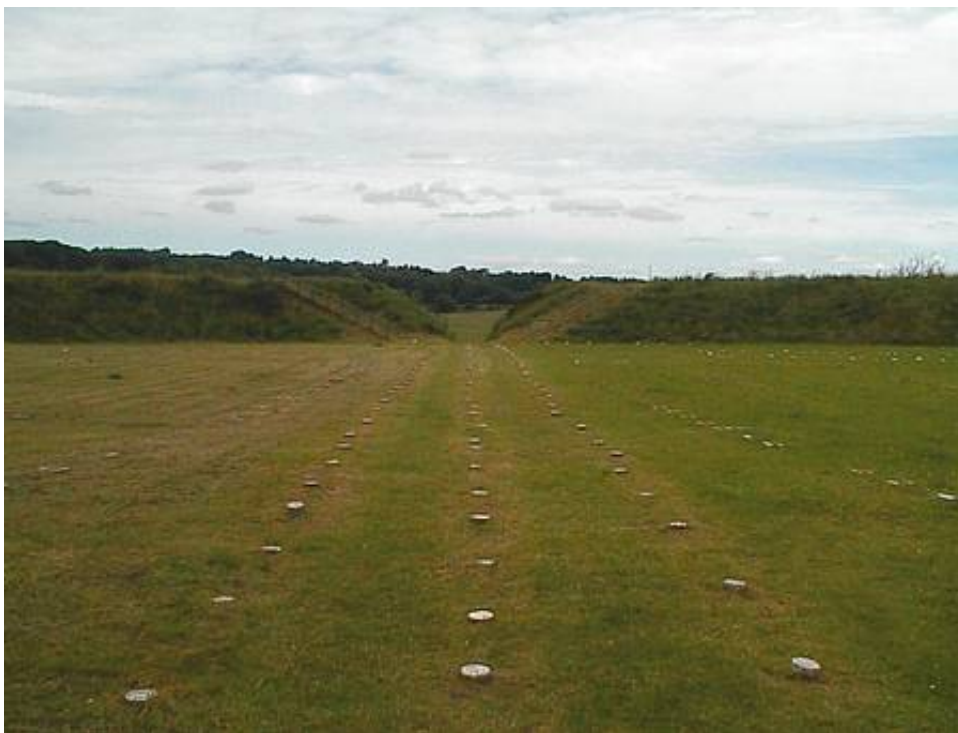
Vue fra centrum af Fyrkat mod den sydlige port