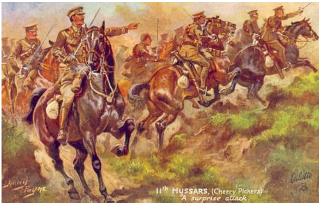
11 th Hussars (Cherry Pickers), A surprise Attack, ca. 1914. Tegnet af Harry Payne.

Hele affæren havde indtil nu da kun varet lidt over en time, men det sidste ord i sagen var endnu ikke sagt, for 11 th Hussars ilede nu til sine heste, sad op, galoperede efter fjenden, indfangede 50 heste og tog en del mandskab.