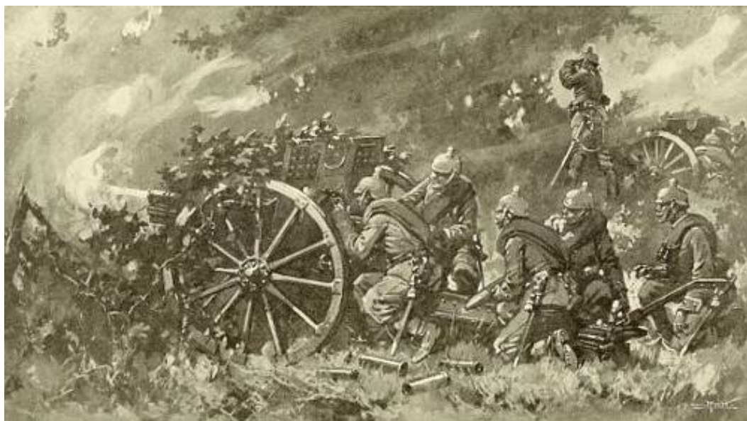
Tysk 7,7 cm feltkanon, ca. 1914.

Imidlertid var fordelene, såvel hvad stillingen som antallet angik, absolut på tyskernes side, idet disse fra den bakkekam, på hvilken de befandt sig, fuldstændig beherskede det lavere liggende terræn. Selv solen begunstigede tyskerne; da den brød frem omtrent klokken 05:00, var den nemlig i ryggen på fjenden og lige i øjnene på forsvarerne.