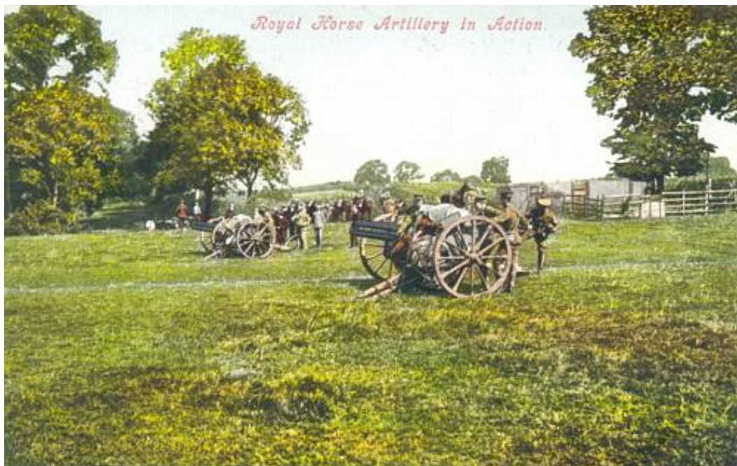
Royal Horse Artillery in Action.

2 nd Dragoon Guards, som af rytterregimenterne var det, der var mest udsat for den fjendtlige ild, bragte først sine heste i dækning, men gik så i gang med en heftig magasin- og maskingeværild, idet alle søgte den dækning, de bedst kunne få; den var imidlertid ikke stor, og de havde desuden solen i øjnene. Ingen af disse ulemper gjorde sig derimod gældende for 11 th Hussars, som fra sin skjulte stilling kunne rette en yderst virksom maskingeværild mod fjendens venstre flanke. Dette regiments virksomhed vil vi dog foreløbig lade uomtalt.