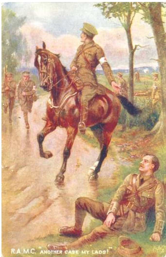
Another case, my lads! Royal Army Medical Corps, ca. 1914. Samtidigt postkort, udgivet af Raphael Tuck & Sons.