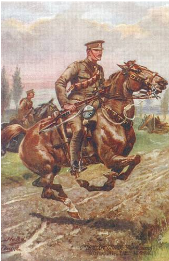
6 th Dragoon Guards, Scouting in the early morning, ca. 1914. Tegnet af Harry Payne.

Regimentet var dog ikke stærkt nok til på egen hånd at foretage mere end en demonstration, og situationen var alt andet end hyggelig, da 4 th Cavalry Brigade ved en himlens tilskikkelse ganske uventet dukkede kom rykkende frem fra Compiègne.