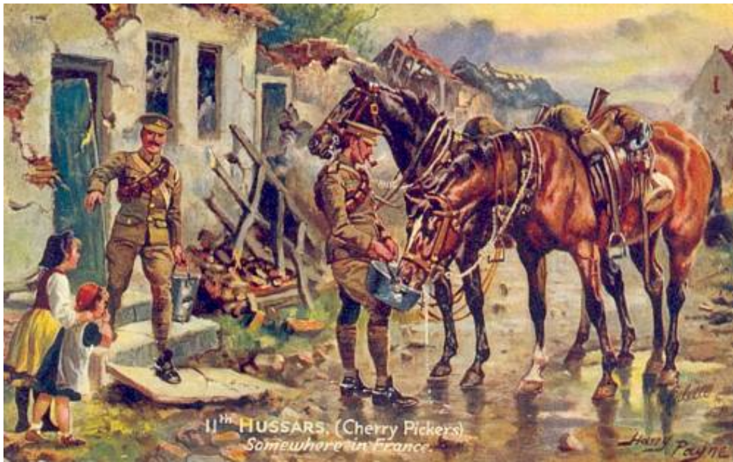
11 th Hussars (Cherry Pickers), Somewhere in France, ca. 1914.