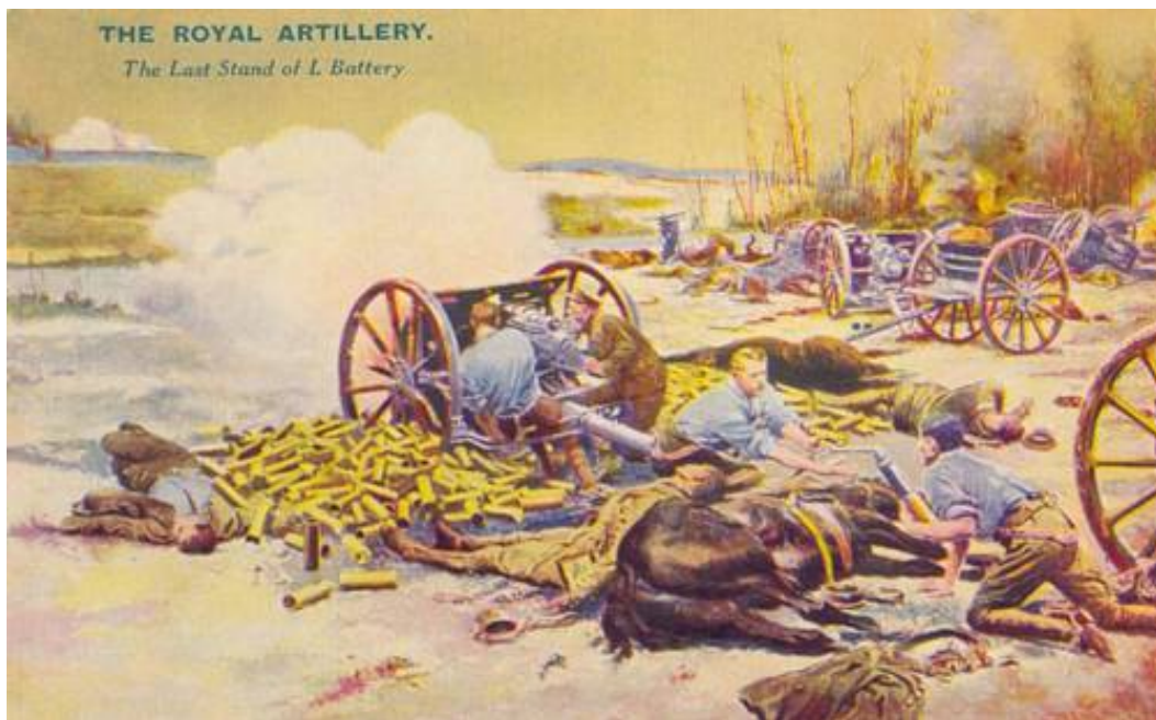
The Last Stand of 'L' Battery.

Fra en serie kort - Battles for the Flag - der blev udgivet i 1950'erne.