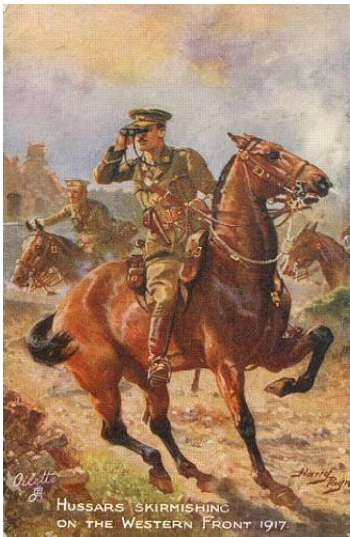
Hussars Skirmishing on the Western Front.