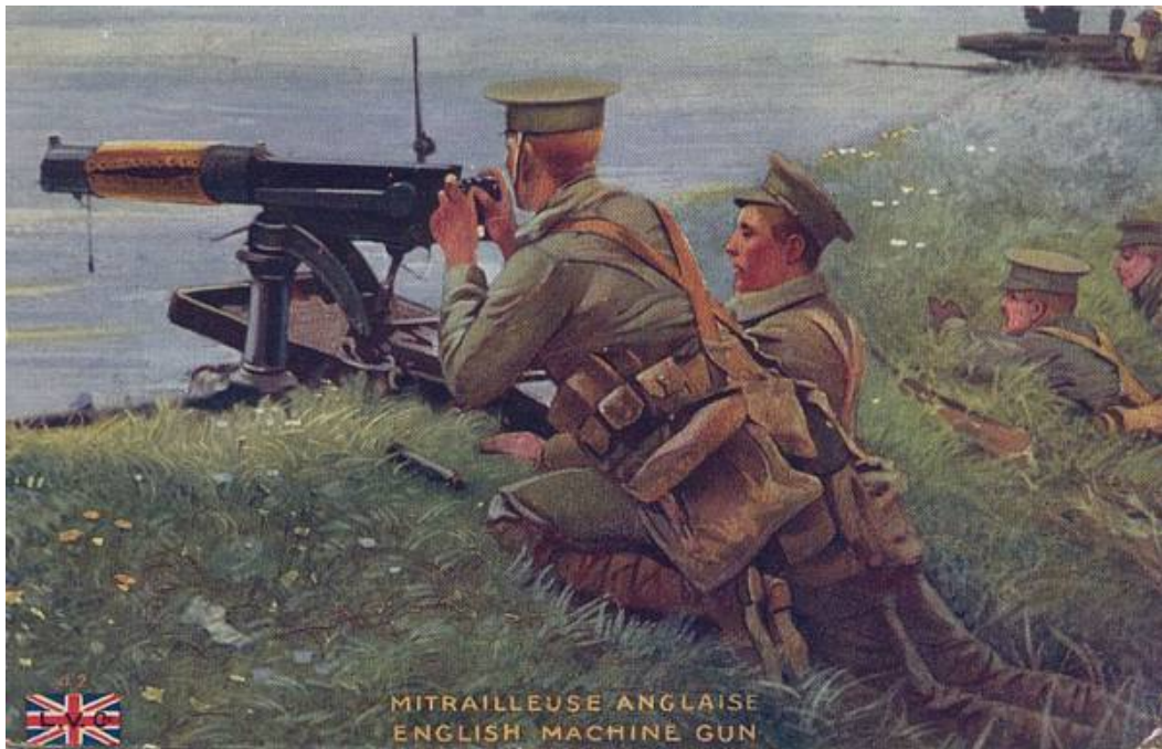
Engelsk Maxim maskingevær, ca. 1914.

2 nd Dragoon Guards viste stort mod og aktivitet under hele affæren. Regimentet mistede 7 officerer, og af L-batteriet kom kun tre mand usårede ud af kampen 3 .