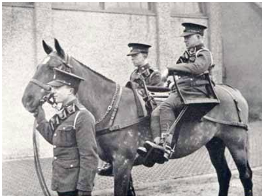
Pakhest udrustet til transport af sårede. Fra hjemmesiden New Rider, Army mules circa 1937.

Cacolets indgik så sent som 1937 i det engelske reglement Manual of Horsemastership, Equitation, and Animal Transport , His Majesty's Stationary Office, London 1937.