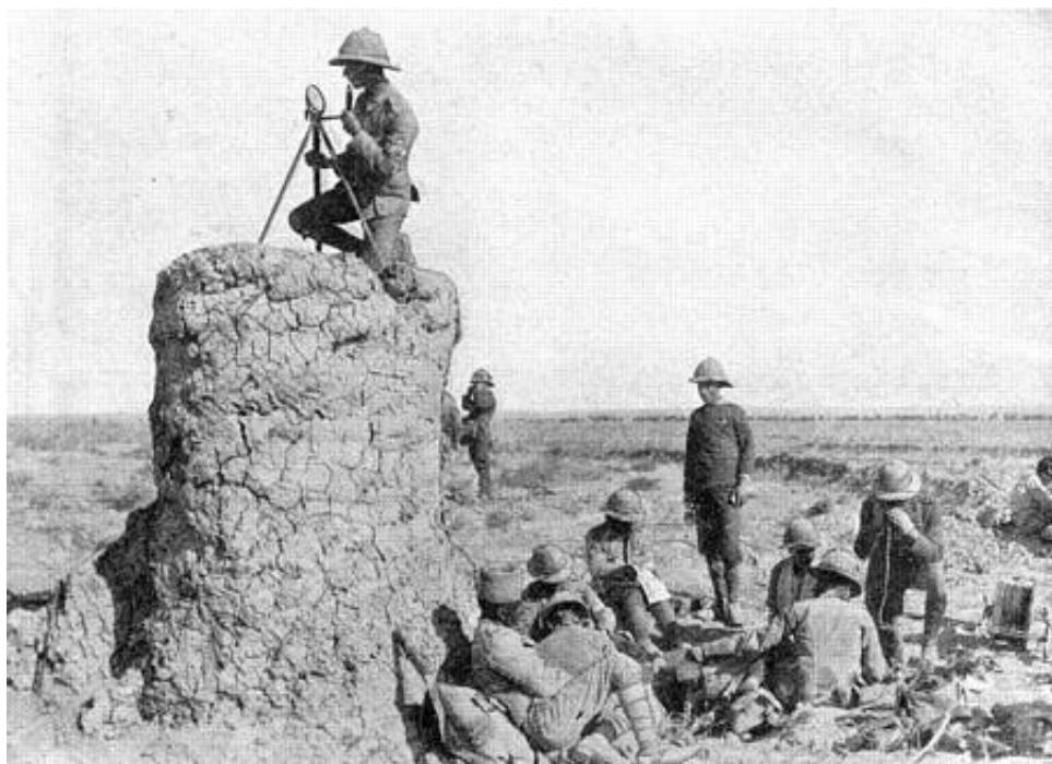
Signalering med heliograf 10 .

Mine p.t. rådige kilder oplyser ikke noget om signaldelingens udrustning og organisation.