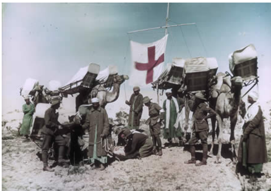
Dele af den australske feltambulance, fotograferet ved Rafa, 12. februar 1918. Fra Australian War Memorial 9 ).

Feltambulancen anvendte udelukkende kameler til transport af sårede, der blev ført enten liggende eller siddende i en slags kurv på hver side af kamelens pukke. Bæreanordningen blev benævnt cacole 8 ).