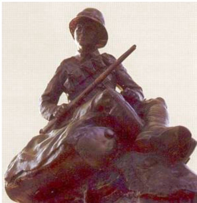
Detalje fra Kamelkorpsets mindesmærke i London. Fra brochuren Twentieth Century War Memorials in Greater London, udgivet af English Heritage.