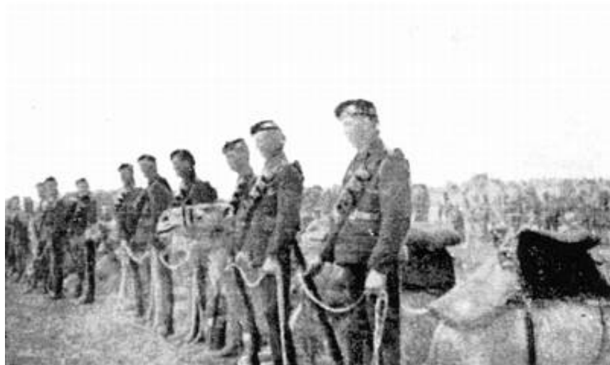
Soldater fra No. 26 Machine Gun Squadron.