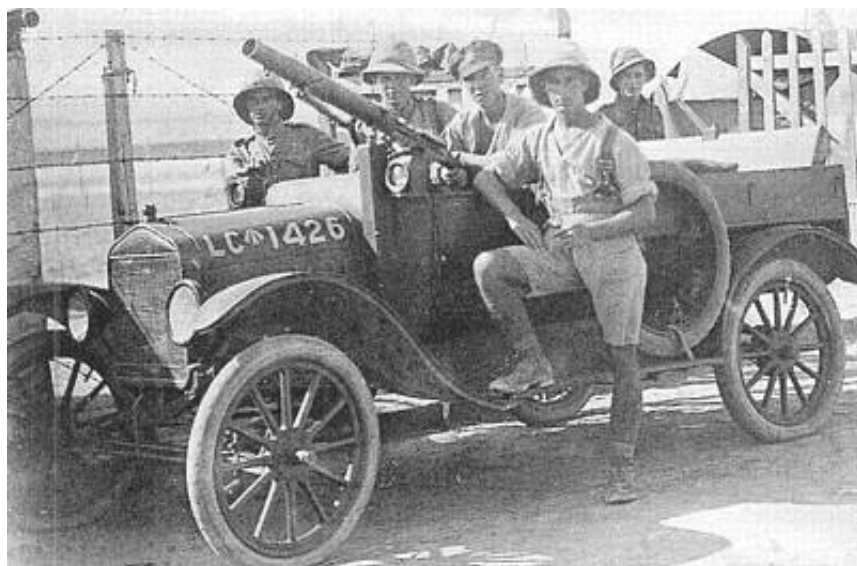
Ford T Light Patrol Car 7 .

Billedet kunne være tydeligere, men man ser dog, at regimentets karakteristiske hovedbeklædning videreføres af maskingeværskytterne.