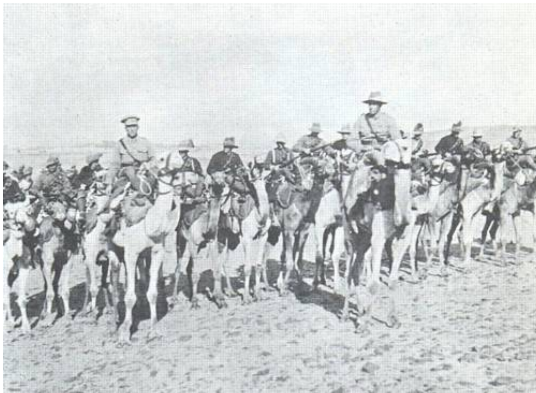
Et af de australske kompagnier fra 4 th Camel Battalion, fotograferet i uddannelseslejren ved Abbassia i Ægypten.

Hver kamelbataljon bestod af 4 kompagnier á 6 officerer samt 169 underofficerer og menige.