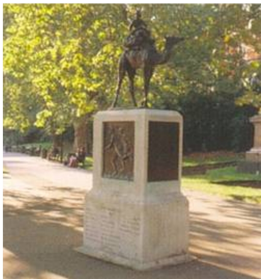
Camel Corps Monument, London. Fotograferet i marts 2005.

Et af Londons mindre, men meget flotte, mindesmærker, som står i Embankment Gardens, umiddelbart nordøst for Embankment Underground Station.