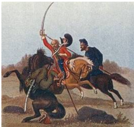
Russiske kosakker i kamp med dansk let dragon

Paa benene ere de ligesaa fantastisk klædte med fremmede munderings-, lærreds-, skind-, ulan- og hvilket som helst slags bukser, man ellers kan forestille sig. Paa fødderne have enkelte støvler, men de fleste sko. Man finder saa lidt tegn paa uniformitet ei alene hos hele samlingen, men og hos den enkelte person, at man ofte ser en kosak med en støvle paa et og sko paa det andet ben eller med strømpe paa det ene ben og det andet bart eller omviklet med laser eller indknappet i en erobret støvlet.