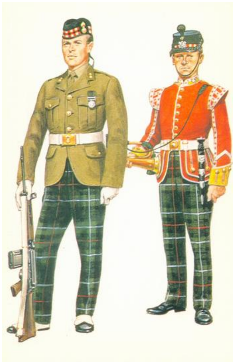
Royal Highland Fusiliers, menig, No. 2 Dress, Ceremonial, 1978 og Highland Light Infantry, hornblæser, Review Order, 1895.