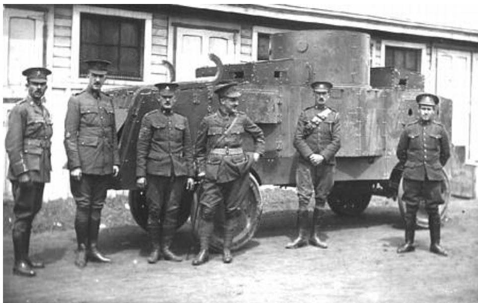
Jeffrey Armoured Car, Niagara Camp 1915, Eaton Motor Machine Gun Battery. Fra Jeffrey Armoured Car (Colin Stevens).

I 1917 ankom 16 stk. Jeffrey Quad panservogne fra England til Indien.