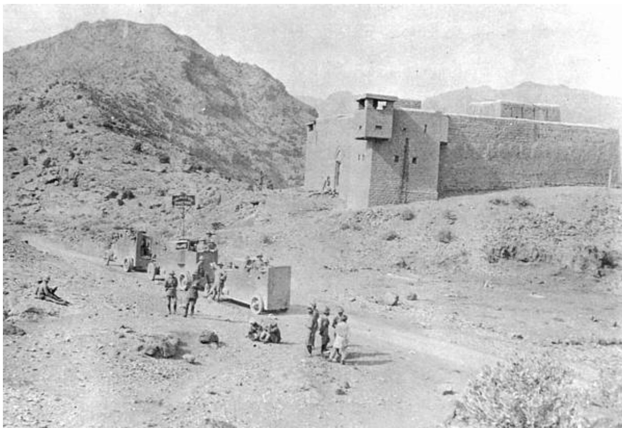
Panservogne ved Kohat Passet, maj 1915.

Operationerne mod mohmanderne var de første i Indien, der involverede en aktiv anvendelse af panservogne.