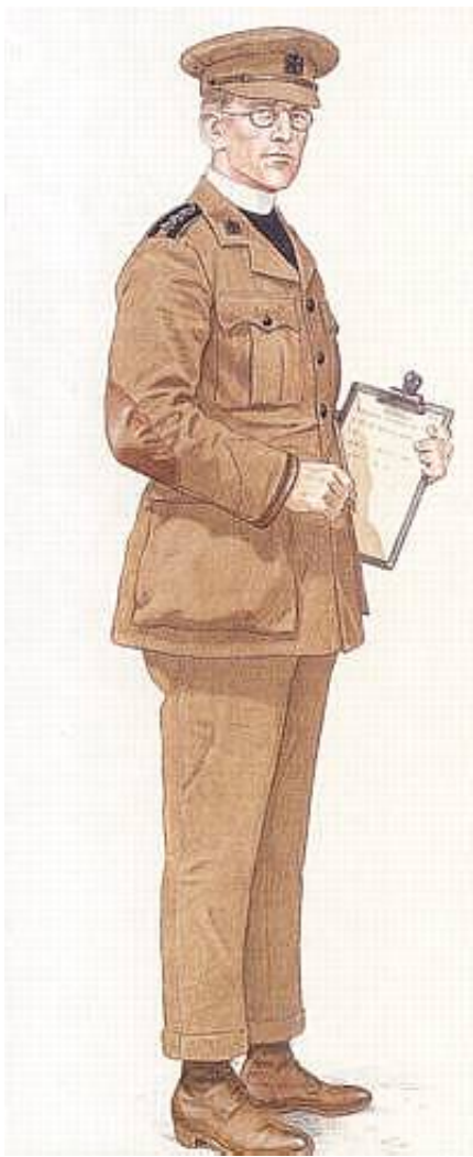
Engelsk feltpræst (Chaplain to the Forces Class IV), ca. 1916.

Tegnet af Mike Chappel og gengivet fra The British Army in World War I (1) - The Western Front 1914-16.