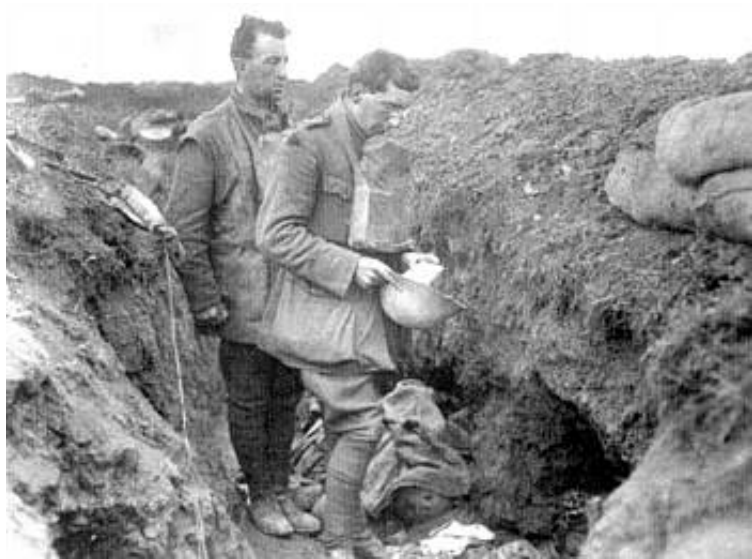
Nødbegravelse, 1916.