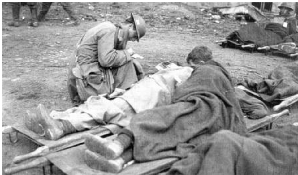
Feltpræst hjælper sårede med at skrive en hilsen

I denne forbindelse bør det nævnes, at tre feltpræster gennem tiden har modtaget Victoriakorset - alle under Første Verdenskrig. Læs om de tre Victoriakors her: The Chaplain VCs of the Great War .