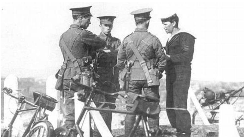
117 th (Cyclist) Battalion, The Welsh Regiment, England, september 1914 9 ).

1908-organisationen med 8 (små) kompagnier var ikke nødvendigvis speciel for cyklister, idet engelske infanteribataljoner i tiden op til Første Verdenskrig generelt anvendte en tilsvarende organisation. Nogle af den regulære hærs bataljoner skiftede først til den senere velkendte organisation med 4 (store) kompagnier, så sent som i forbindelse med mobiliseringen 8 ), mens flere af infanteribataljonerne i Territorial Army blev mobiliseret med 8 kompagnier. Mandskabsstyrken ændredes ikke væsentligt, idet de otte kompagnier blot blev lagt sammen to og to; dette omtales ofte som the double-company system .