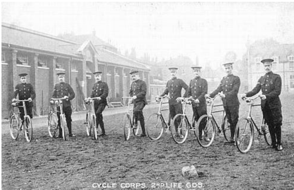
Cyklister fra 2 nd Life Guards, ca. 1905. Fra et samtidigt postkort.

Mange betragtede cyklen som et nymodens, civilt transportmiddel, hvis anvendelse til militære formål var begrænset.