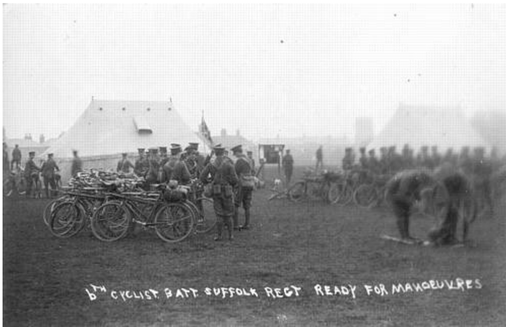
6 th (Cyclist) Battalion, The Suffolk Regiment, 1912. Fra et samtidigt postkort.

Også i den regulære hær indgik cyklister i mindre målestok.