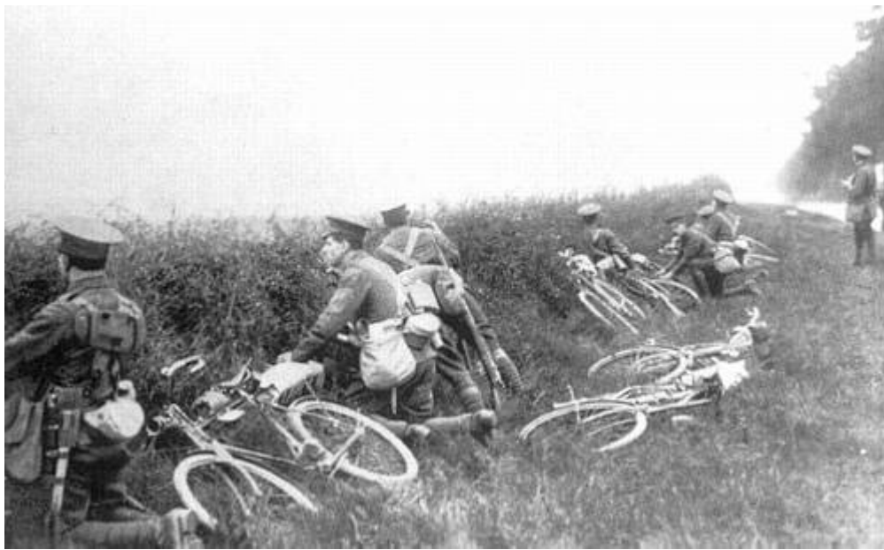
Engelske cyklister, 1914 6 .

Kilde 3 omtaler cyklistkompagnerne i rosende vendinger og deres noget improviserede opstilling til trods, må de have haft samme høje professionelle standard som de øvrige enheder i Ekspeditionskorpsset.