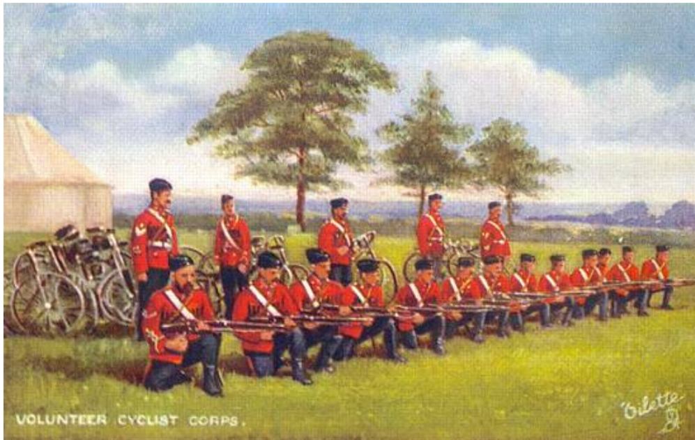
Frivillig cyklistsektion, ca. 1900.

Denne artikel er en sammenskrivning af oplysninger fra mange forskellige kilder og er nærmest at sammenligne med et puslespil, hvor kanten og nogle af brikkerne inden for er lagt. Min fremstilling gør således ikke krav på at være en udtømmende beskrivelse af emnet; det skulle glæde mig, om eventuelle læsere kan bidrage med yderligere informationer.