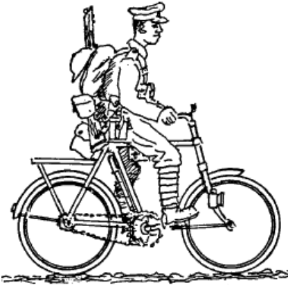
Engelsk cyklist - Figur fra firmaet Scalelink (SMB13).

Sergent fra 2/1 st Dorset Yeomanry, England 1916 13 ).