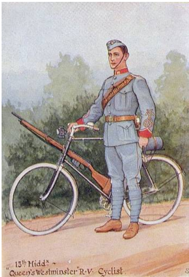
Frivillig cyklist, 13 th Middlesex Battalion, Queen's Westminster Rifle Volunteers, ca. 1900. Samtidigt postkort, gengivet fra Kilde 1.

I 1888 oprettedes ligeledes den første - og frem til 1908 eneste - cyklistbataljon - 26 th Middlesex Volunteer Rifle Corps (efter 1908: 25 th County of London Battalion (Cyclists), The London Regiment).