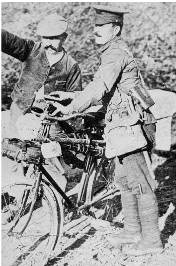
Engelsk cyklist, 1914 7 .