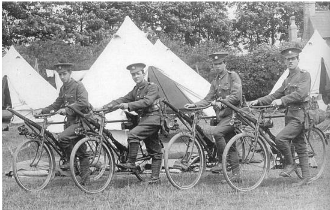
Cykelordonnanser fra Army Service Corps, ca. 1914 5 ).

Sektionen rådede over 9 cykler. Herudover var 36 korporaler, underkorporaler og menige, uddannet i flagsignalering (semafor); disse soldater var fordelt i bataljonens underafdelinger.