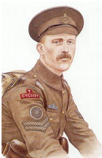
Korporal fra Army Cyclist Corps , ca. 1915. Tegnet af Mike Chappel. 12 )

Infanteridivisionerne rådede frem til forsommeren 1916 over en ryttereskadron og et cyklistkompagni. I de nyopstillede divisioner kom ryttereskadronerne primært fra de frivillige rytterregimenter ( Yeomanry ), mens cyklistkompagnerne - antageligvis analogt med cyklistkompagnerne - bestod af personel, som var tilkommanderet fra divisionens infanteribataljoner.