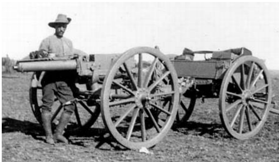
37 mm (Pom-Pom) maskinkanon, fra Boerkrigen. Fra The Canadian Anglo-Boer War Museum.

Maskinkanonen blev taget i brug under Boerkrigen, først af boere (fremstillet af Nordenfelt fabrikkerne); siden kopieret af Vickers) og anvendt englændere.