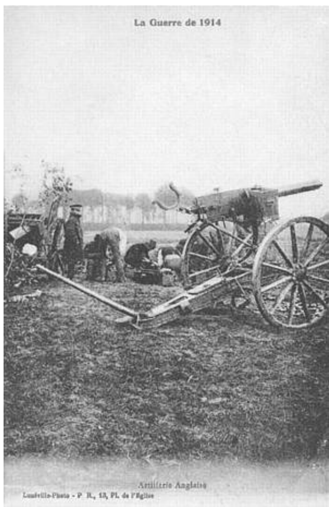
Engelsk 37 mm maskinkanon (1-pdr Vickers-Maxim Pom-Pom), i luftværnsaffutage, ca. 1914.

En ny bog fra Osprey - The British Expeditionary Force 1914-15 af Bruce Gudmundsson (Kilde 1) giver et par detaljer om organisationen af de luftværnssektioner, der opstilles af Royal Garrison Artillery pr. 21. august 1914, med opgave at yde infanteridivisionerne i felten sikring mod den tiltagende trussel fra luften. Det er ikke et emne, der mig bekendt, er skrevet meget om, men ved at sammenstykke brudstykker fra forskellige kilder fremtræder følgende omrids historien.