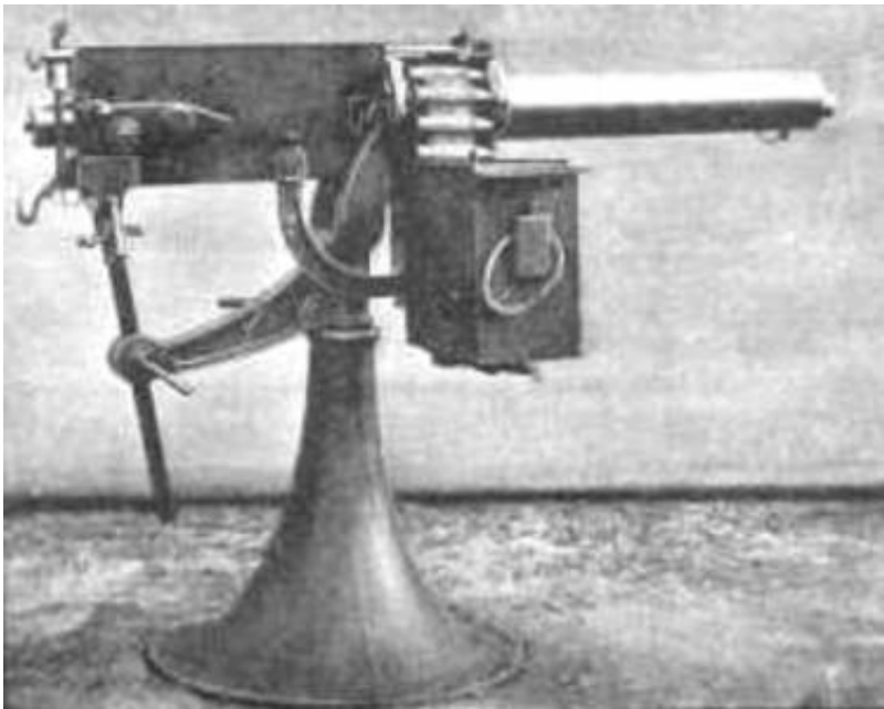
37 mm (Pom-Pom) maskinkanon, i stationær affutage. Fra Battlefield Anomalies, Second Boer War, Artillery.

I luftværnsudgaven havde pjecen en rækkevidde på ca. 4 km.