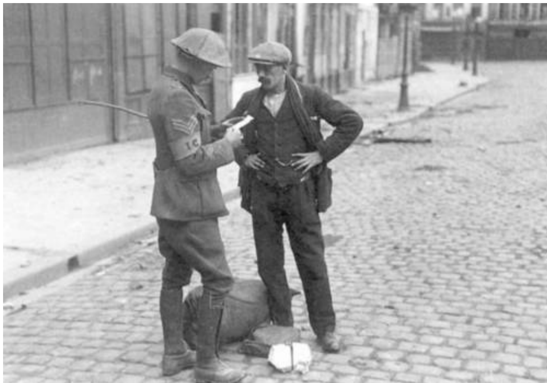
En sergent fra Intelligence Corps udspørger en civil i Bethune, maj 1918. Fra Kilde 1.

Underofficerer, i tjeneste, bar et armbind med påskriften IC ( Intelligence Corps ).