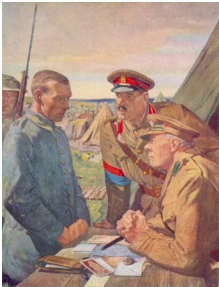
Afhøring, ca. 1916.

Postkort fra Imperial War Museum, London, efter maleri af Francis Dodd.