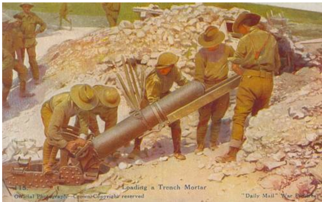
Loading a Trench Mortar, ca. 1916.

Et tungt skyttegravsmorterbatteri bestod af 3 officerer samt 66 underofficerer og menige.