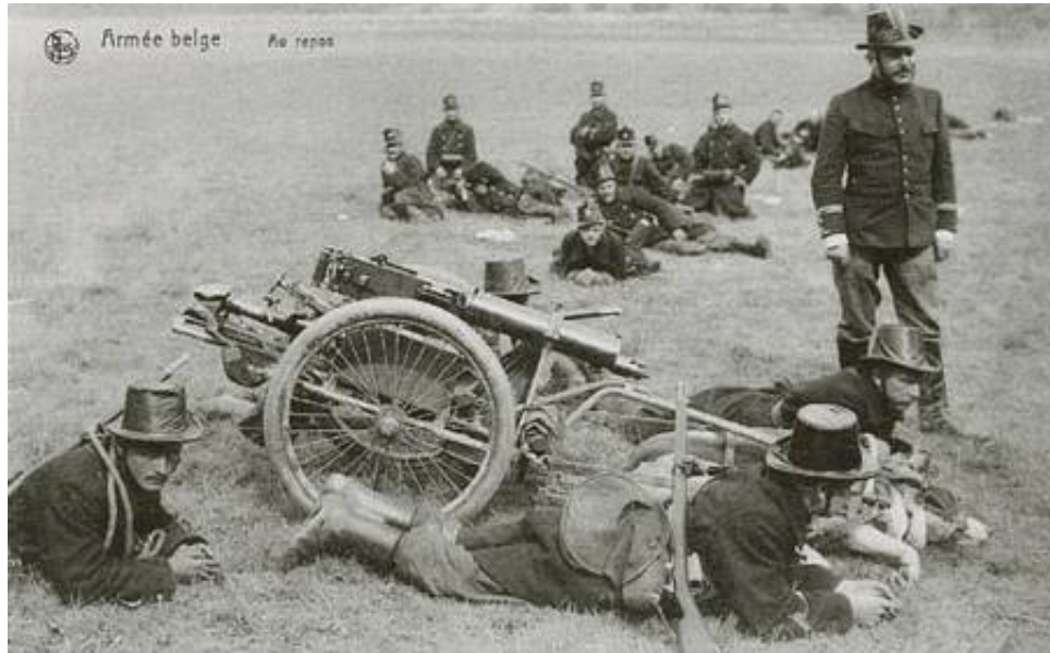
Maskingeværgruppe fra et af Karabinérregimenterne, ca. 1914.

Til hvert maskingevær hørte desuden to patronkærre, hver trukket af to hunde.