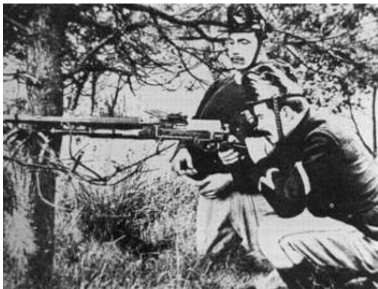
Belgisk Hotchkiss maskingevær.