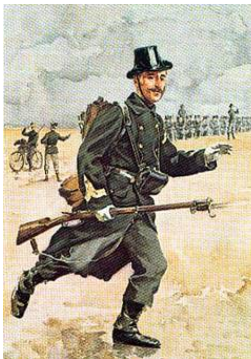
Korporal fra Karabinérregimentet, ca. 1914. Fra Kilde 3.

I Kilde 5 findes en glimrende tegning af bataljonens lette maskingeværer. I modsætning til det efterfølgende postkort, viser Kilde 8 dog soldaterne med gult bånd om huen, hvilket måske kan henføres til en generel ændring af opslagsfarver mv. i 1913.