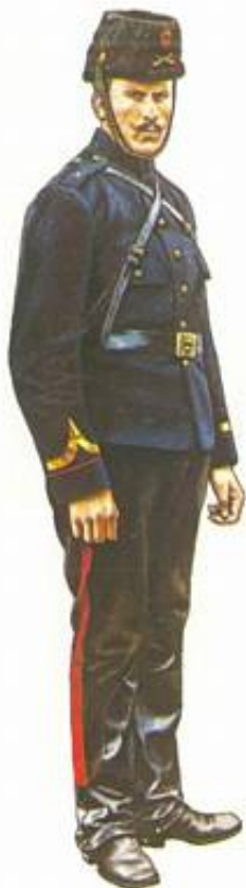
Underkorporal fra 5. Artilleriregiment, 1914. Fra Kilde 5.

De kørende regiment/afdelinger bar samme nummer som den division/brigade, de indgik i. I relation til 4. Infanteribrigade er der således tale om 4. Artilleriafdeling, der bestod af 7. - 9. Batteri.