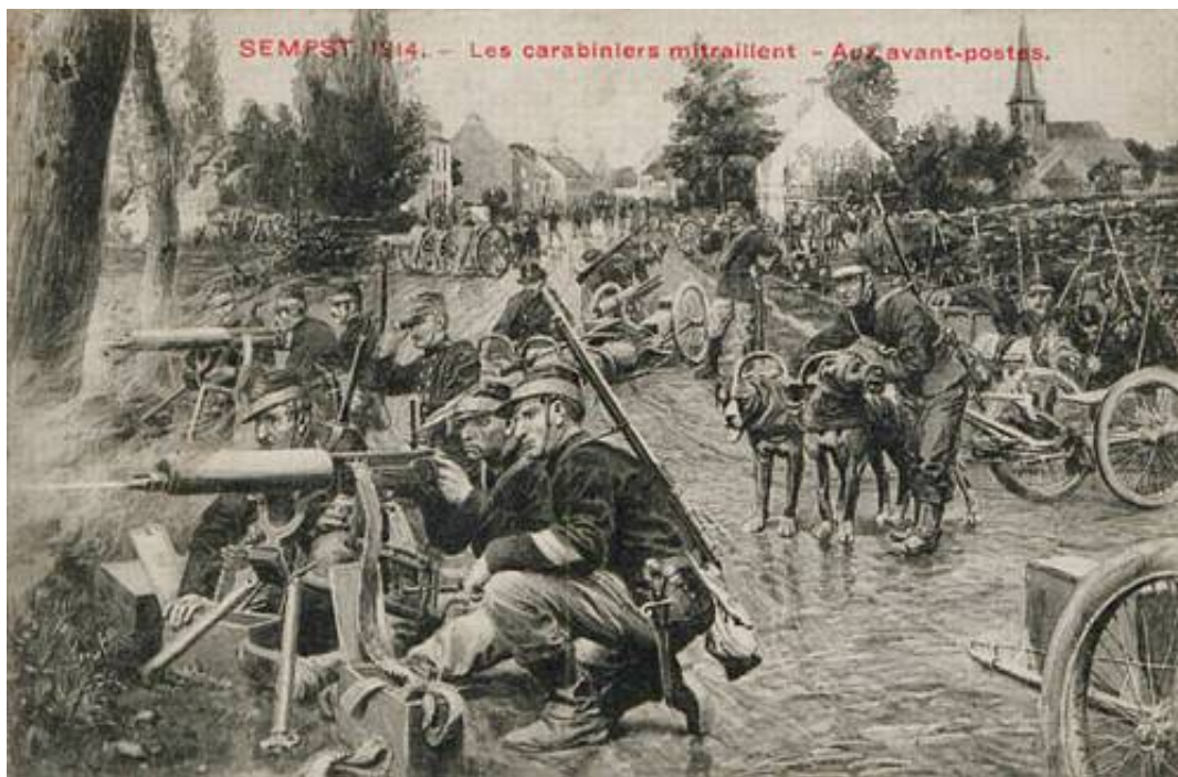
Maskingeværer fra et af Karabinérregimenterne, ved Sempst (ca. 20 km nord for Bruxelles), 1914. Fra et nogenlunde samtidigt postkort fundet på Internettet.