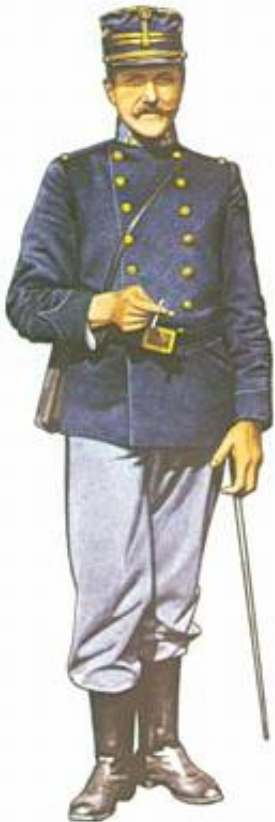
Belgisk infanteriofficer, 1914.