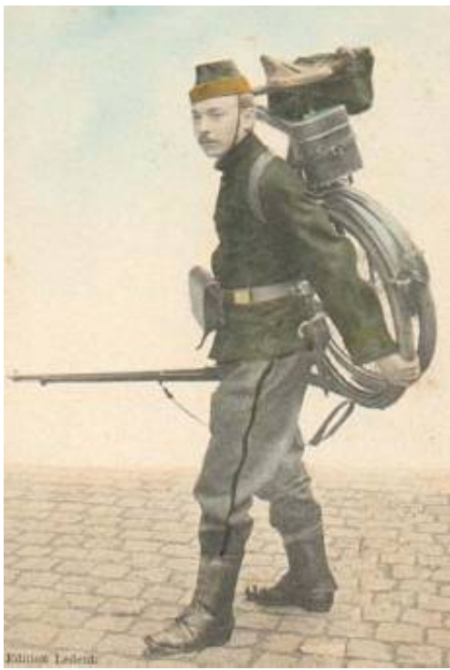
Menig fra Karabinérregimentets Cyklistbataljon, ca. 1914. Fra Historique du 2ème Bataillon de Carabiniers Cyclistes.

Cyklistbataljonens uniformsfrakke var mørkegrøn; uniformsbukserne gråblå. Hovedbeklædningen for underofficerer og menige var enten kepi eller felthue; officererne bar kepi. Karabinérregimenterne i øvrigt bar sorte uniformskapper og sorte hatte, med overtræk af voksdug.