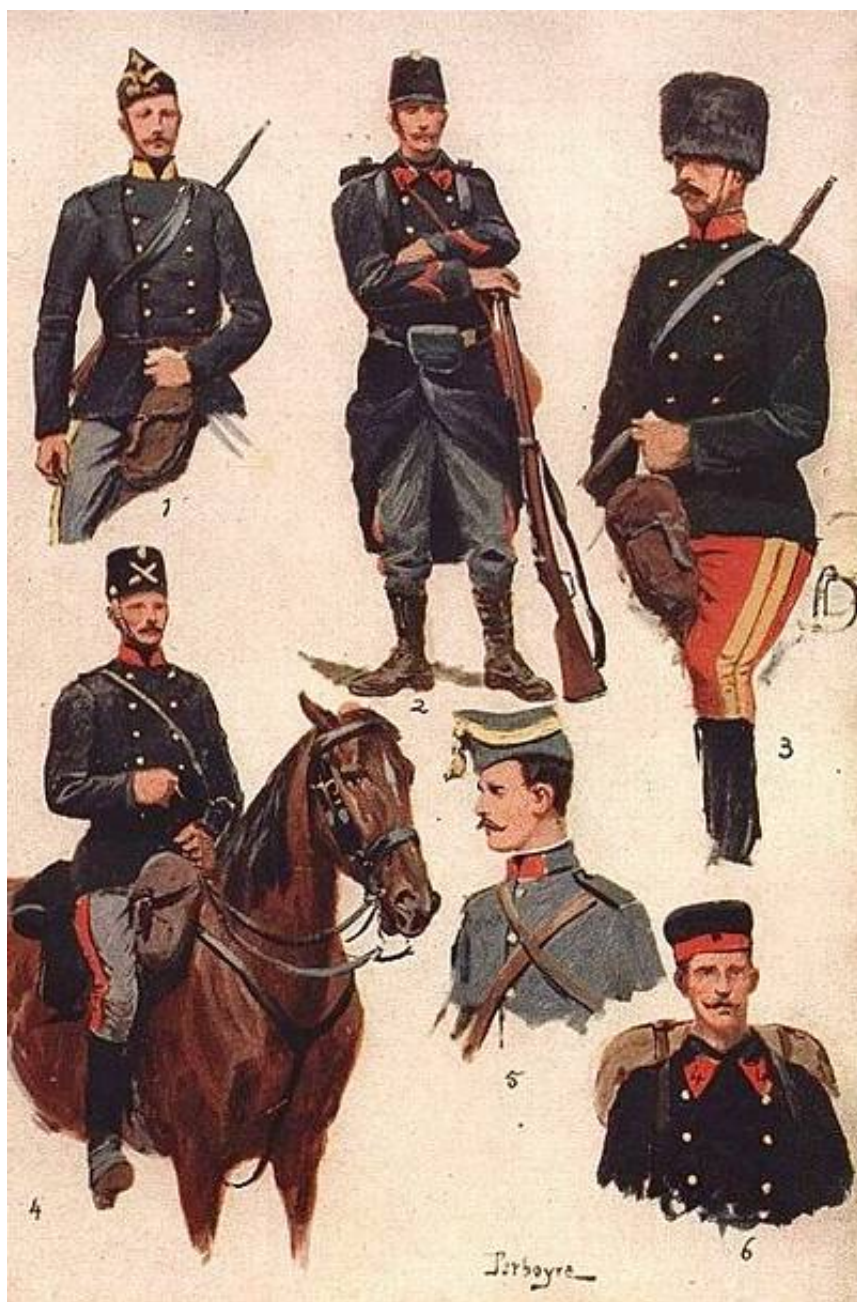
Belgiske uniformer, ca. 1914. Gengivet fra en planche bragt i Panorama de la Guerre , der var et samtidigt fransk tidsskrift. Fra The Great War in a different Light .

Den belgiske hær var i august 1914 organiseret i seks infanteridivisioner og en kavaleridivision samt fæstningerne Antwerpen, Liège og Namur.