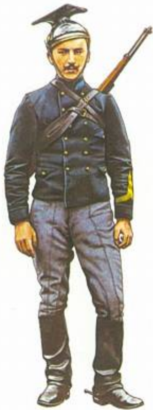
Menig fra 4. Lansenerregiment, august 1914.