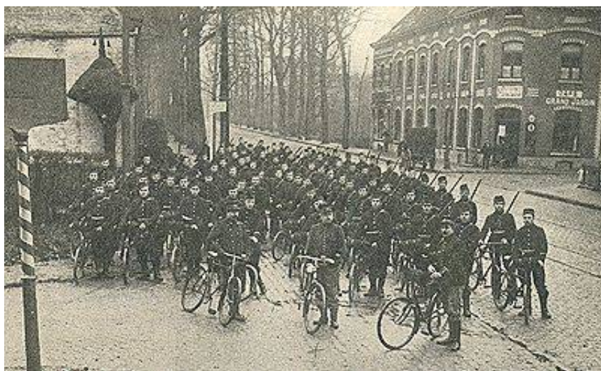
Karabinérregimentets Cyklistbataljon, ca. 1914. Fra Historique du 1 er Bataillon de Carabiniers Cyclistes.

Kilden til fotografiet nævner, at brevdUER blev brugt til at holde forbindelse med hærens hovedkvarter i Antwerpen.