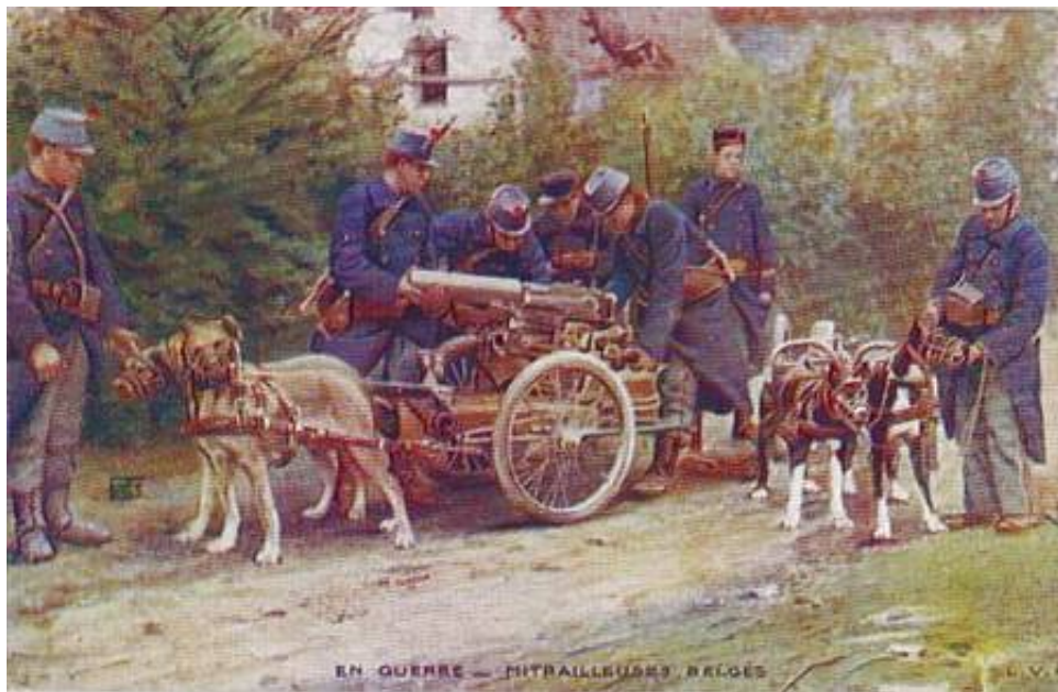
Belgisk maskingeværgruppe, ca. 1914.

Fra et samtidigt postkort fundet til salg på Internettet.