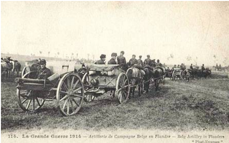
Belgisk 75 mm feltkanon, ca. 1914.

Uniformen i kombination med en særlig hårdnakket indsats i krigens første måneder gjorde, at de tyske soldater gav dem tilnavnet "De sorte Djævl", et tilnavn man stadig fører med stolthed.