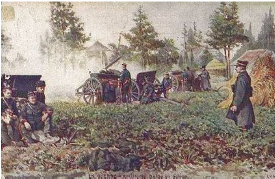
Belgisk feltartilleri, 1914.

Det ridende og kørende artilleri bærer samme uniform, inklusive den lave pelshue; regimentstilhør fremgår af et tal på skulderklappen. Mine kilder oplyser ikke, hvorledes den ridende artilleriafdeling var afmærket. Ved fronten brugte artilleristerne, analogt med kavaleriet, ofte felthuer, og for officerernes vedkommende kepier, i stedet for pelshuer.