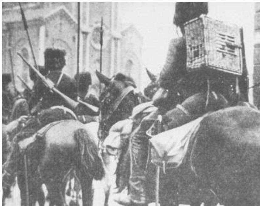
En Guide med brevduetransportkasse 2 ).

Som en del af 1914-ordningen var 5. Lansenerregiment og 4. Jægerregiment til Hest var bestemt oprettet ved mobilisering. Den 12. august 1914 talte 5. Lansenerregiment 30 officerer samt 502 underofficerer og menige.