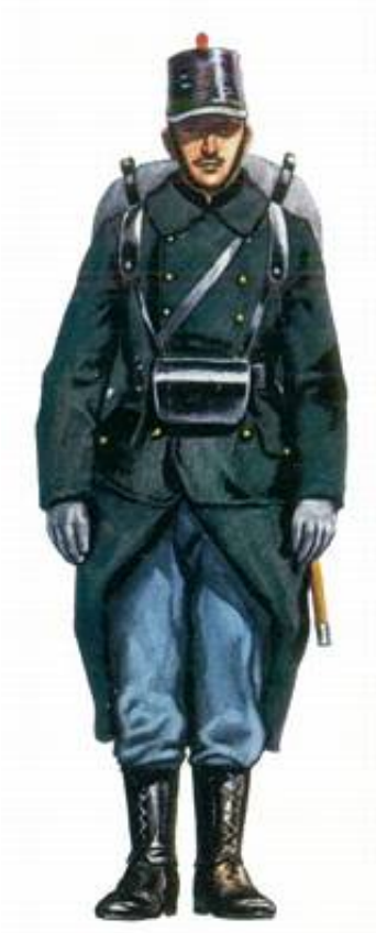
Belgisk infanterist, 1914. Fra Kilde 7.

I fredstid bestod det belgiske infanteri af: