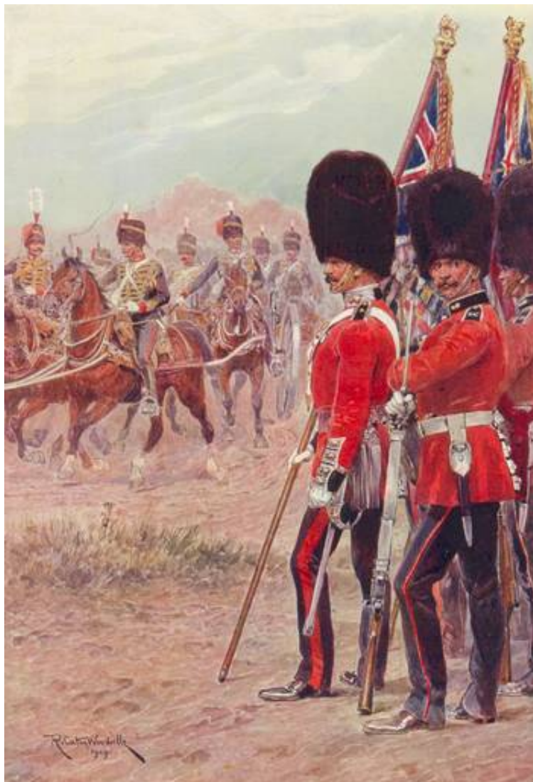
The Honourable Artillery Company, ca. 1911. Efter tegning af Richard Caton Woodville. Fra Kilde 1.

Fra 1860 var Honourable Artillery Company en del af Volunteer Force, der i 1908 blev til Territorial Force.