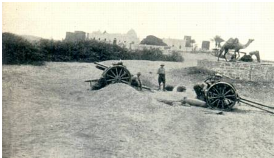
B Battery, Honourable Artillery Company, in action at Sheik Othman, Aden, 1915.