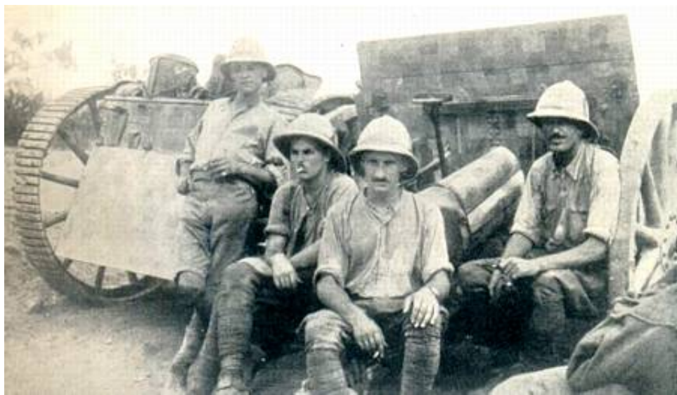
A Sub-section, B Battery, Honourable Artillery Company, at Sheik Othman, 1915.

En glimrende beskrivelse af kampene i Aden under Første Verdenskrig findes i artiklen The British Campaign in Aden, 1914-1918 af Mark Connelly ( Journal of the Centre for World War I Studies , Volume 2, No. 1, March 2005).