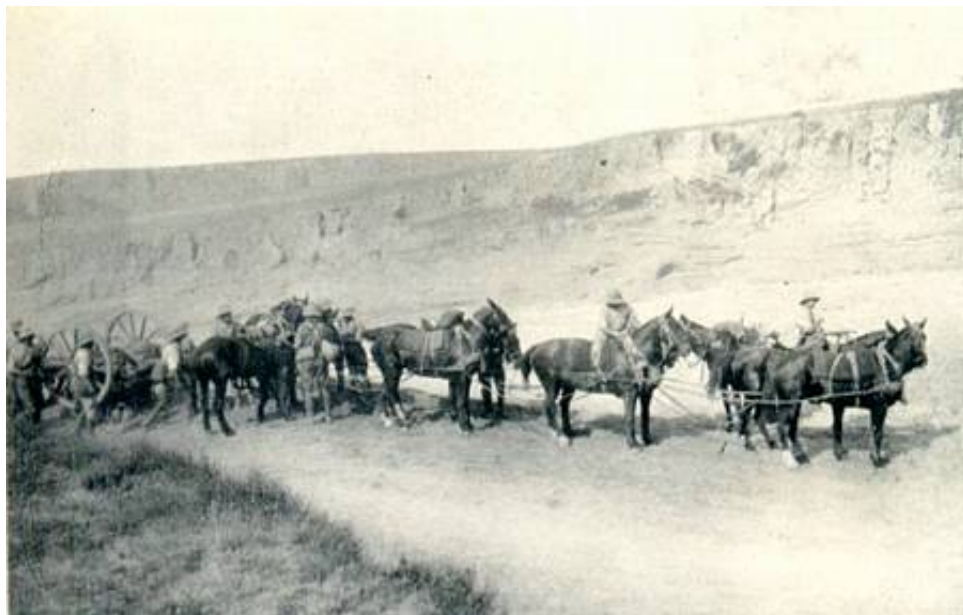
A Battery crossing the Wadi Ghuzze, 1917 (ved Gaza). Fra Kilde 2.