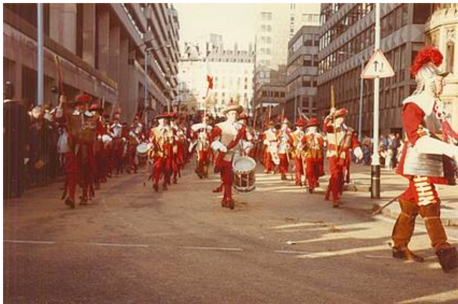
Musketerer fra Honourable Artillery Company.

Det var ganske imponerende at se disse pikenerer og musketerer i virkeligheden, og var det ikke for de moderne omgivelser kunne man tro, at man befandt sig i 1600-tallet.