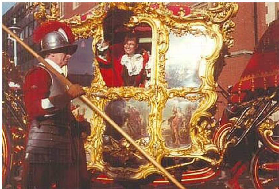
Pikener fra Honourable Artillery Company eskorterer kareten med Londons overborgmester.

9. RHA Batteries (The Long, Long Trail).