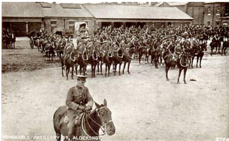
Honourable Artillery Company, Aldershot, ca. 1910.

Batterierne blev mobiliseret i Londons centrum, ved Armoury House, og indtog deres plads i krigstidsorganisationen som en del af London Mounted Brigade henholdsvis South Eastern Mounted Brigade.