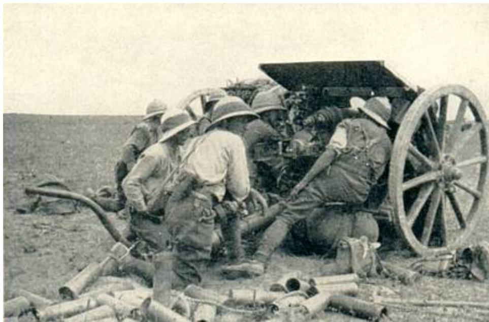
B Sub-section, B Battery, Honourable Artillery Company, in action at Gaza, 1917.