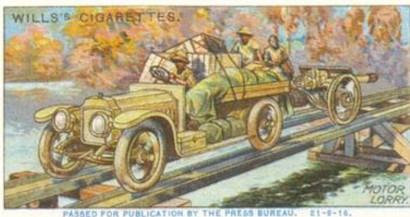
Motor Lorry, East Africa.

Under det senere felttog i Østafrika blev batteriet udrustet med to 12-pdr marinekanoner. Batteriet gjorde tjeneste under navnet No. 1 Light Battery, senere No. 6 Battery. Under landoperationerne blev batteriet udrustet med motorkøretøjer af typen Hupmobile og siden med lastvogne af type Reo .