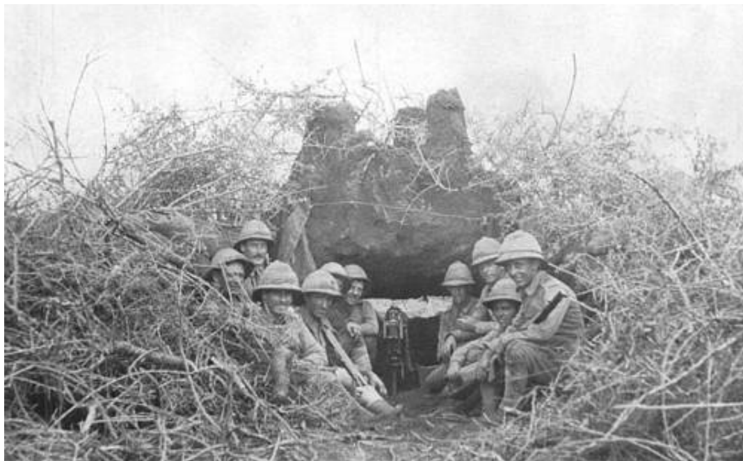
Soldater fra 2 nd Bn. Loyal North Lancashire Regiment, der har indrettet en maskingeværstilling i en - forhåbentlig fraflyttet - myretue, Østafrika, 1914.