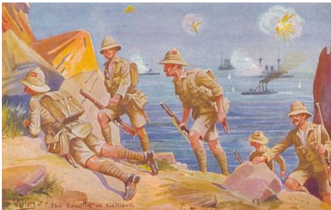
The Landing at Gallipoli, 1915.

Fra et nogenlunde samtidigt postkort 5 .