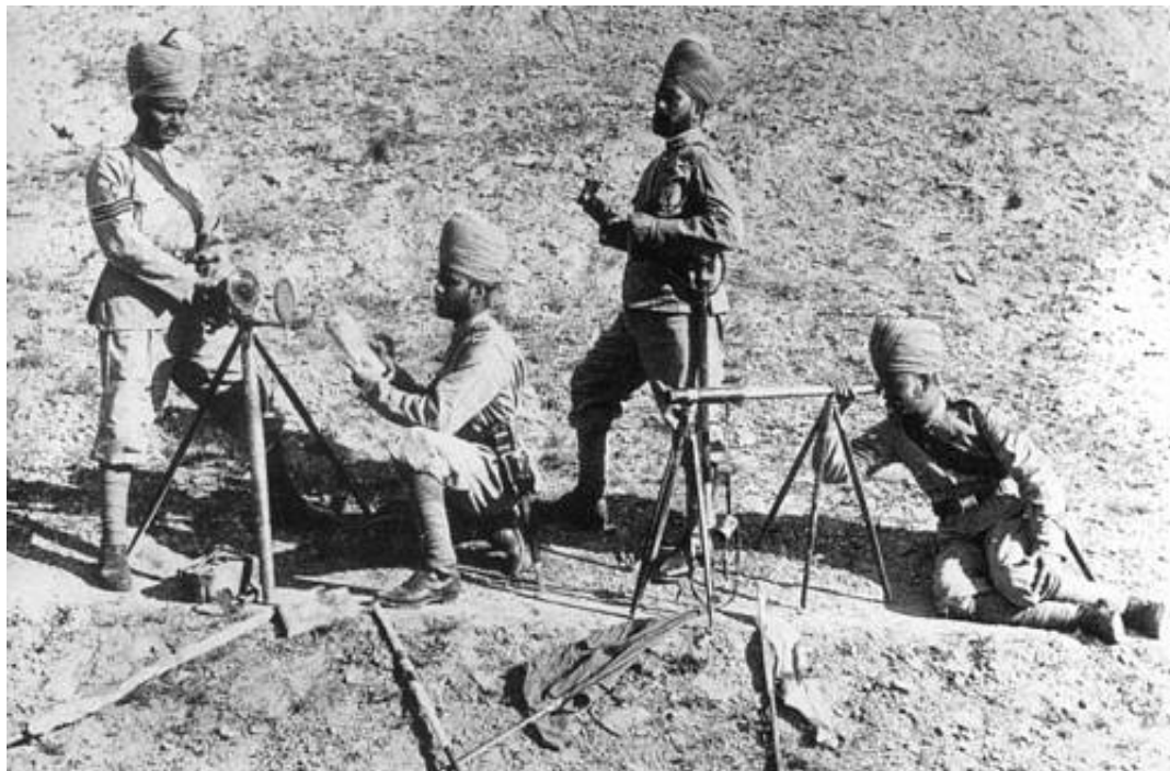
Optisk signalering med heliograf ved 1 st Grenadier Regiment of Bombay Infantry, 1897. Fra Kilde 5.

27 th (Bangalore) Brigades kommandostation