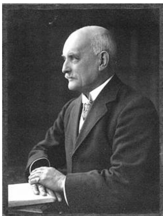
Generalmajor Arthur Aitken.

Chefen for Ekspeditionskorps B, generalmajor Arthur Edward Aitken 2) , blev i 1882 overført til den indiske hær fra Worcestershire Regiment.