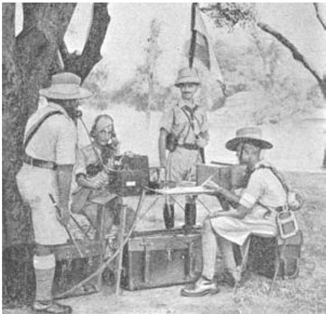
Indisk signalkontor, fra 1930'erne.

Signaldelingen i 27 th (Bangalore) Brigade og Imperial Service Brigade blev stillet af 31 st Signal Company, Royal Engineers, der forblev i Østafrika til 3. april 1915, hvor de blev sendt til Mesopotamien.