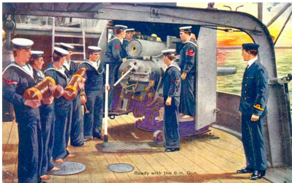
Kanoneksercits ved en 6-tommers kanon, ca. 1905.

Batterichefen anmoder på et tidspunkt om at måtte sende en officer i land, men dette afslås som værende unødvendigt.