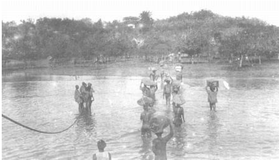
Soldater fra 98 th Infantry bringer forsyninger i land ved C Beach. Fra Kilde 4.

D+2 trækker invasionsstyrken sig tilbage - en operation, der tilsyneladende forløber effektivt og i god ro og orden - til deres transportfartøjer, som herefter sejler tilbage til Mombasa.