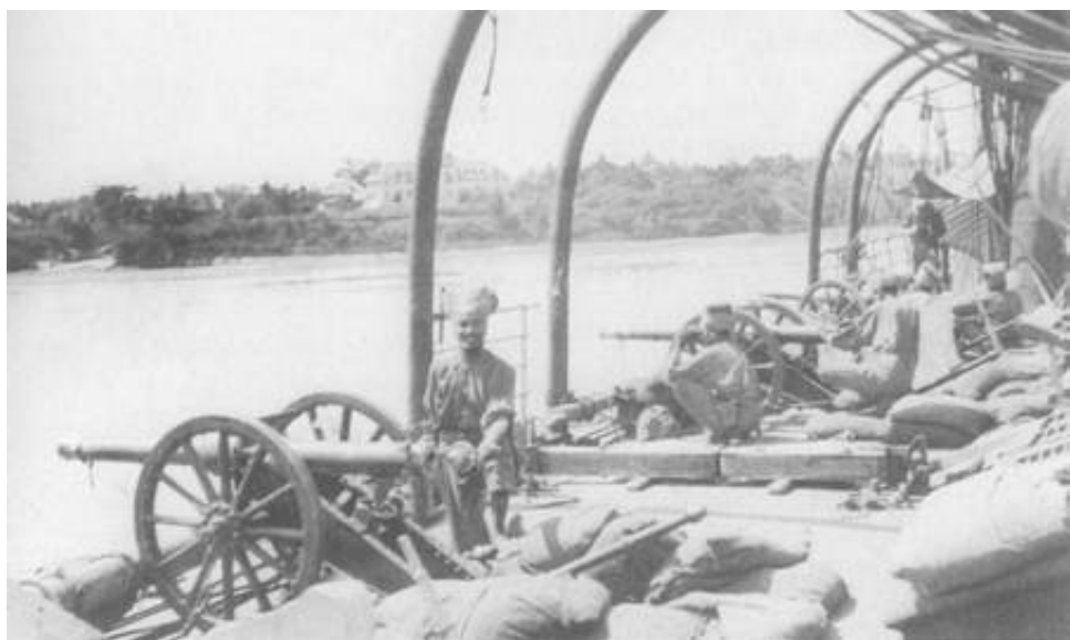
28 th Mountain Battery ombord på S/S BHARATA.

Kilde 3 nævner, at batteriet skød godt 150 skud fra stillinger på dækket af S/S Bharata. Fremskudte observatører hørte ikke til dagens orden, og de fleste af skuddene blev rettet efter lyden af skydning. Batterichefen lod sig hejse op i toppen af en mast, men havde ikke store muligheder for effektiv observation.