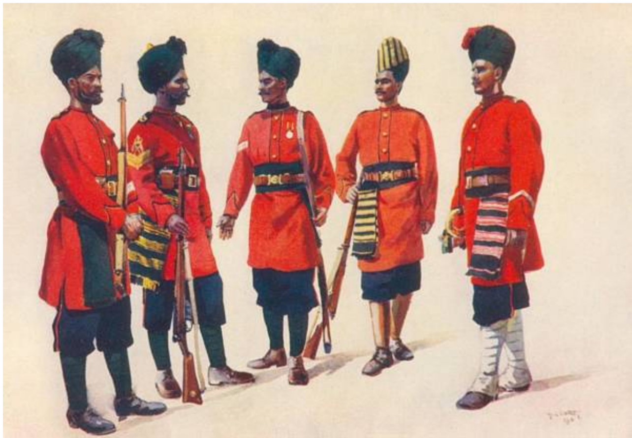
Infantry of the former "Hyderabad Contingent".