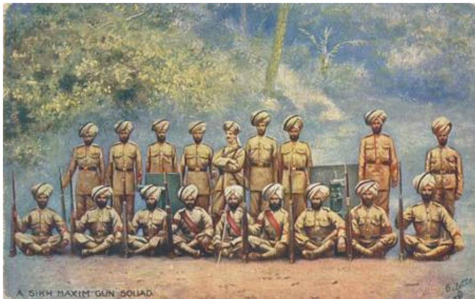
A Sikh Maxim gun squad.

Umiddelbart efter mobiliseringen fik personellet udleveret de korte geværer, hvis sigtemidler og øvrige funktionering var anderledes end de geværer, man kendte i forvejen. Der blev ikke tid til at indskyde geværene eller gøre meget ud af at øve soldaterne i betjening af de nye våben.