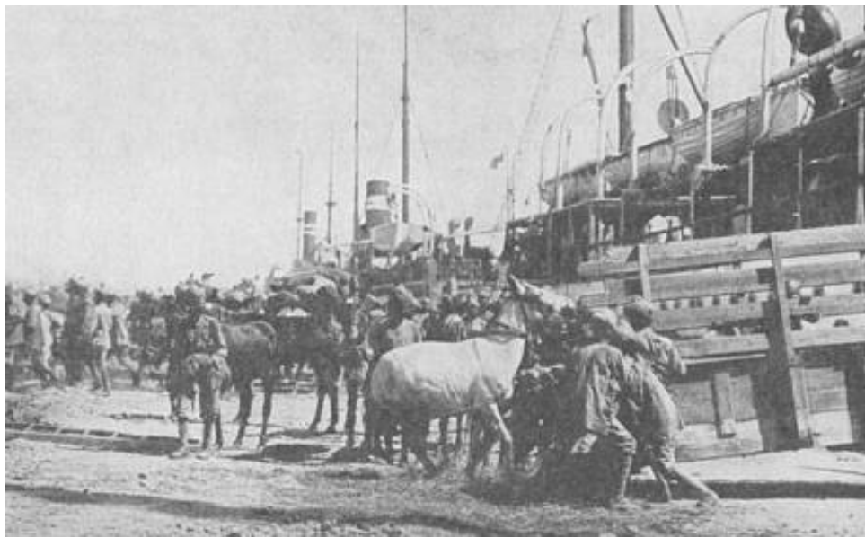
Indian troops embarking horses at Bombay.