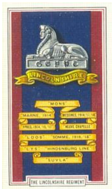
The Lincolnshire Regiment. Cigaretkort nr. 45 fra serien Army Badges , udgivet i 1939 af tobaksfirmaet Gallaher Ltd.

Denne forstærkning ville have været et godt supplement til kompagniet, men på dette tidspunkt af krigen, var de middeltunge maskingeværer 3 ) udskilt fra infanteribataljonerne og samlet i The Machine Gun Corps.