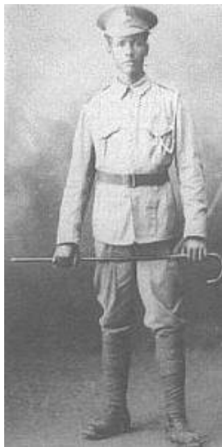
Bermuda Militia Artillery, menig, ca. 1900.