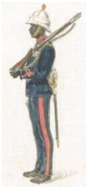
Bermuda Militia Artillery, korporal, ca. 1900.