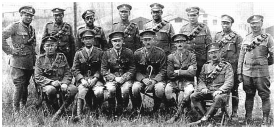
Officerer og underofficerer fra The Bermuda Contingent, Royal Garrison Artillery, fotograferet i England før indsættelsen på Vestfronten.