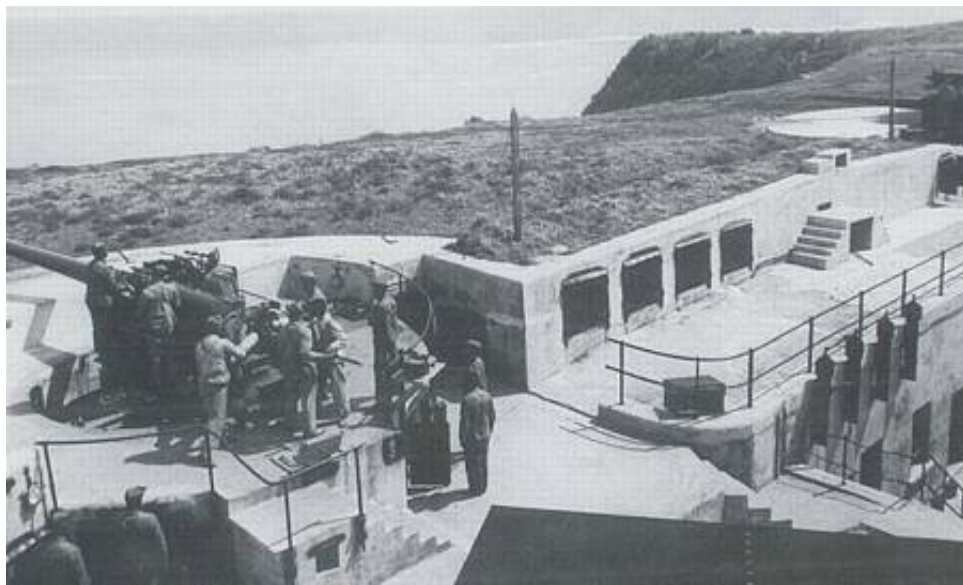
Saint David's Head Battery, Bermuda, ca. 1950.