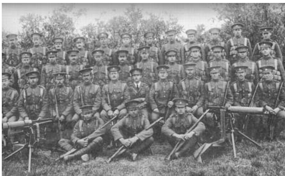
Det andet kontingent af Bermuda Volunteer Rifle Corps, fotograferet på Bermuda, før afrejsen til England, 1916.

Der forelå dog en aftale mellem myndighederne på Bermuda og Det engelske Krigsministerium om, at kompagniet fra Bermuda Volunteer Rifle Corps skulle fungere i eget navn, og det blev derfor bestemt, at kompagniet skulle underlægges 1. Bataljon, som et ekstra kompagni, hvilket fik effekt fra juni 1915.