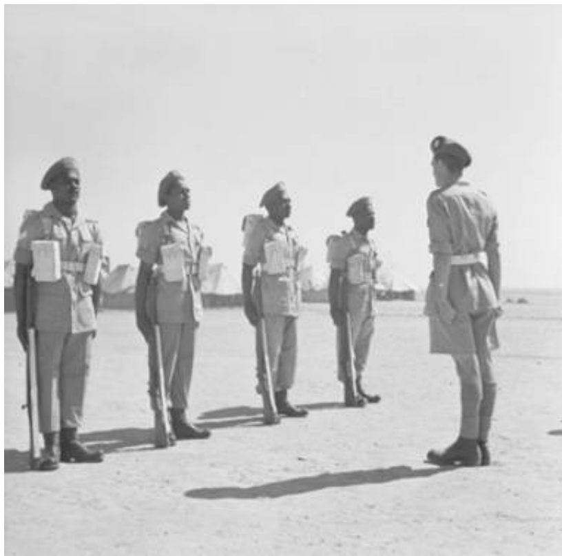
Inspektion af vagtstyrke fra 1 st Battalion, The Caribbean Regiment, Ægypten, ca. 1945.

Som yderligere årsager til denne situation anføres også, at bataljonens uddannelsesniveau ikke var tilstrækkeligt, ligesom man frygtede for følgevirkninger i de vestindiske samfund i tilfælde af store tab.