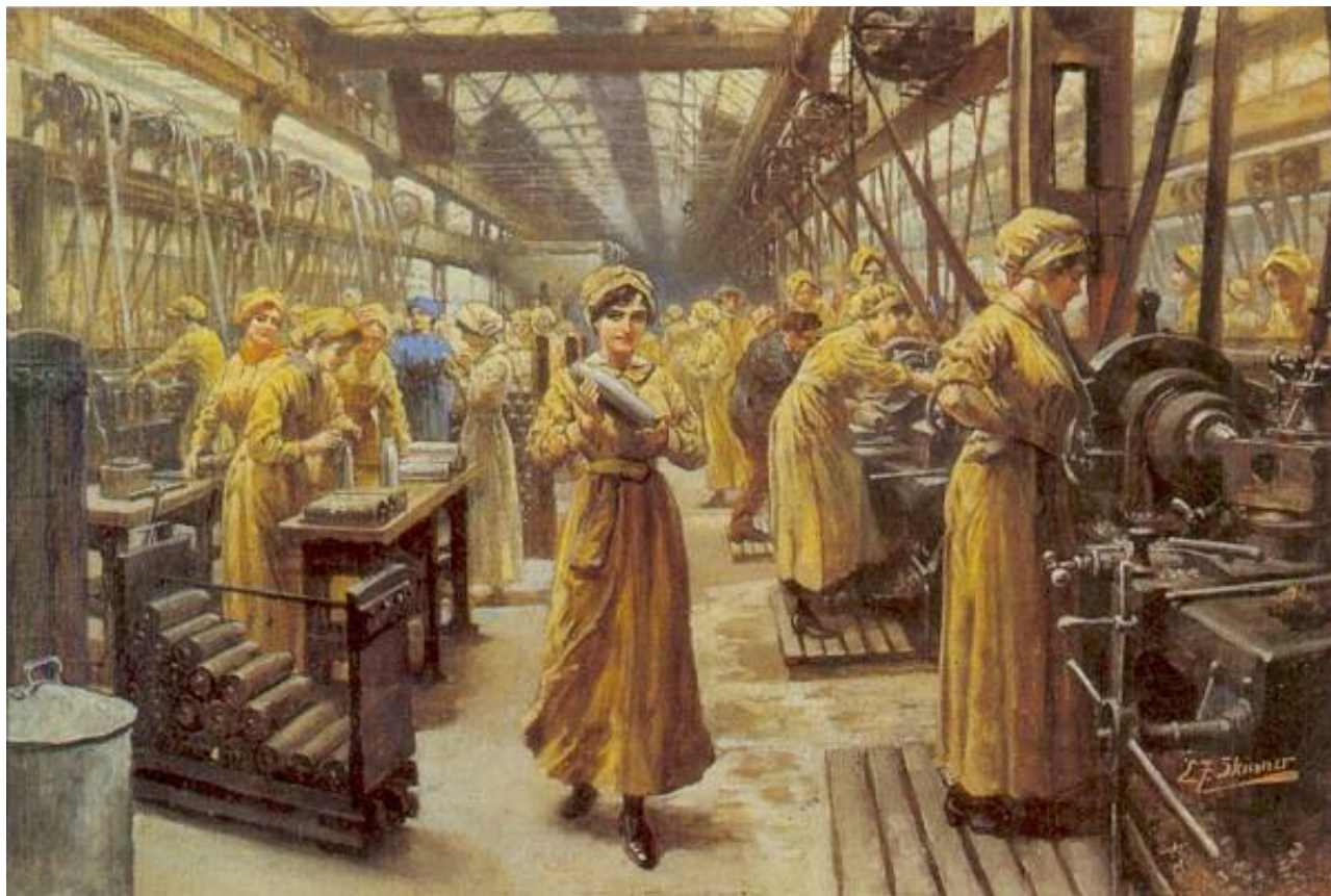
For King and Country, malet af E. F. Skinner.

Gengivelsen stammer fra et postkort, købt på Imperial War Museum, London.