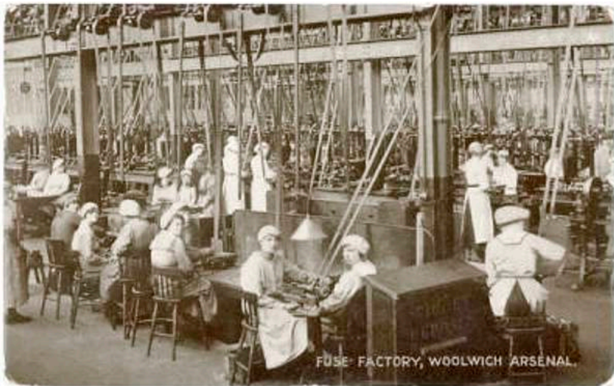
Fremstilling af brandrør på Ammunitionsarsenalet i Woolwich, under Første Verdenskrig. Fra et samtidigt postkort, fundet på hjemmesiden Port Cities - Londons omtale af Woolwich Arsenal.