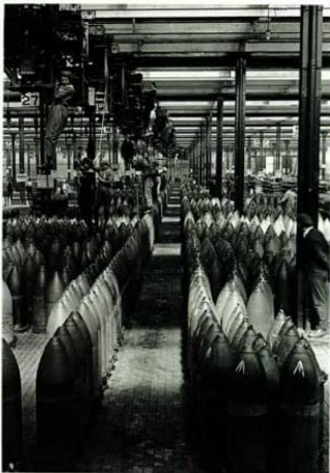
Kvindelige ammunitionsarbejdere, 1917. (Selv om de næsten ikke er til at få øje på...)