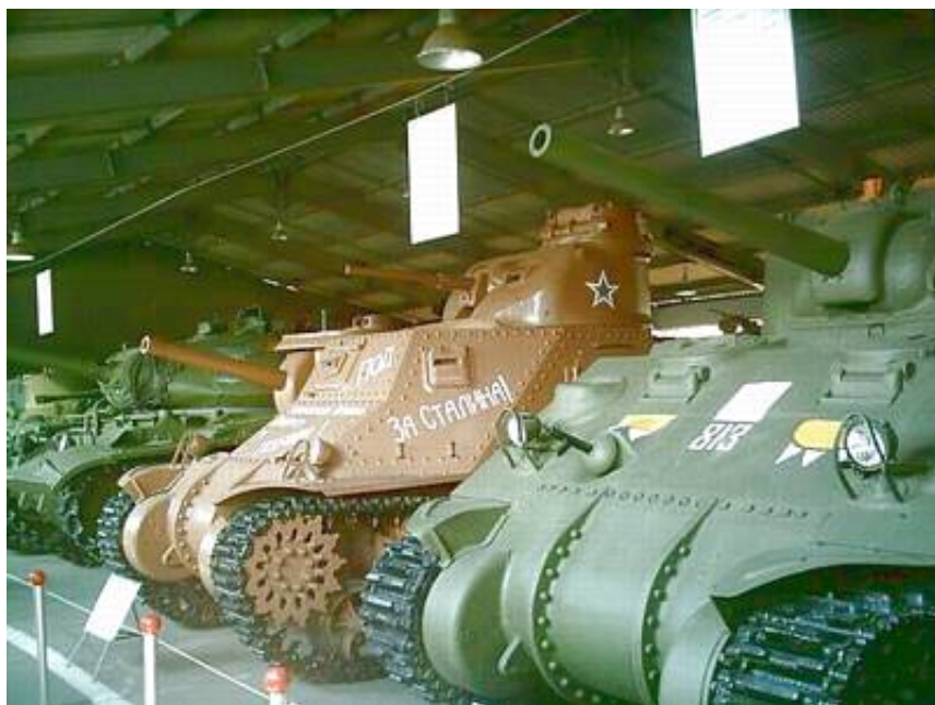
Grant og Sherman kampvogne