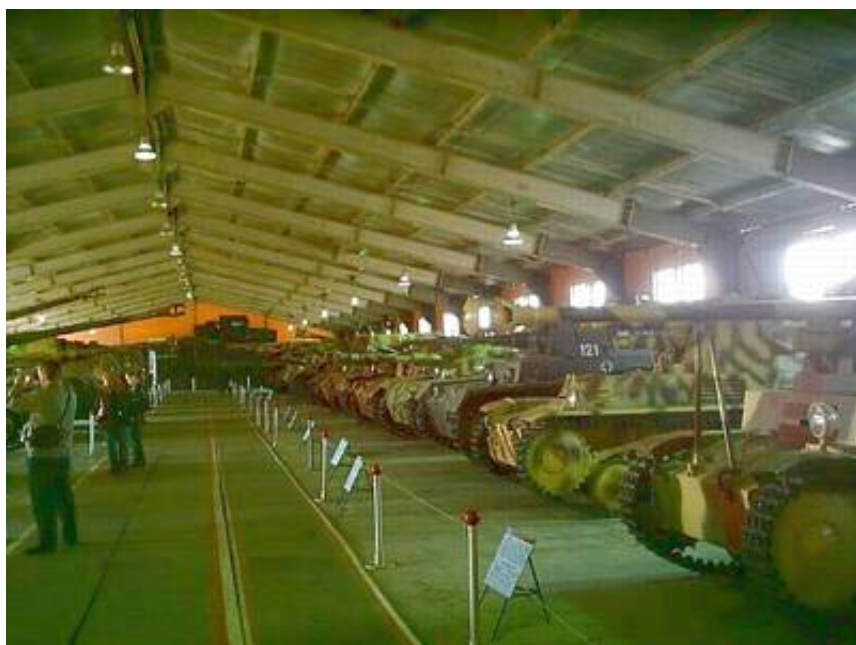
Hallen med tyske køretøjer

Noget der for alvor imponerer er den tyske afdeling. Der er alle fra de kendte store kampvogne, som Tiger I og Tiger II, Jagdpanther, Marder, Sturmtyger til de små Pz. I og Pz III fyldt ind i en hal.