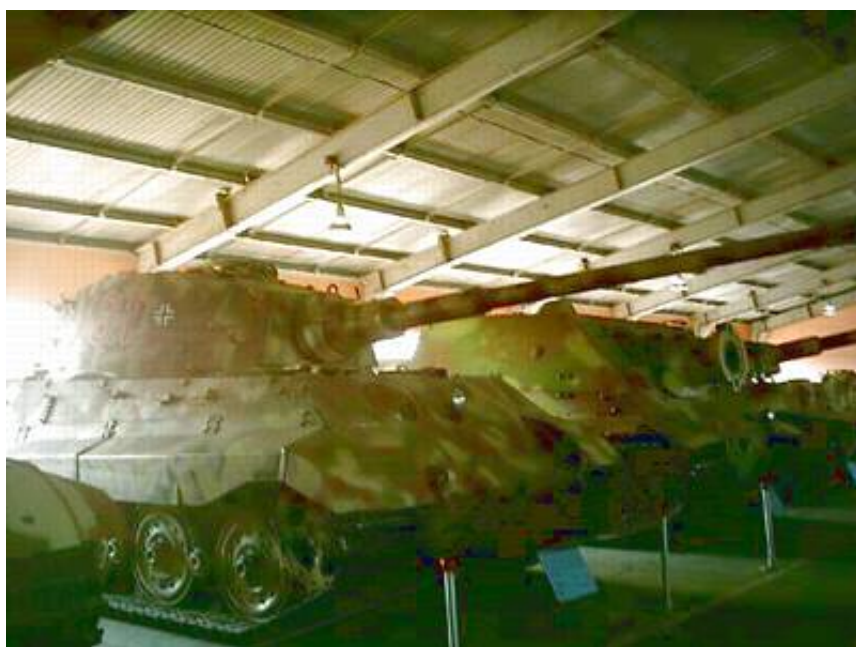
Tiger II og Sturmpanzer IV Tiger (Sturmtiger)

Museets samling indeholder, efter mit kendskab, også den eneste tilbageværende tunge kampvogn af typen MAUS, der blev indsat i forsvaret af Berlin i 1945.