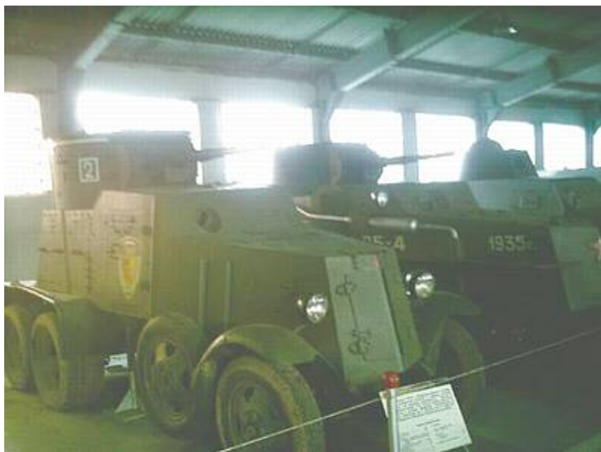
BA 2 panservogn m.fl.

Derudover er der også udstillet T26, BT 5, BT 7, T37, SU 76, SU 85, SU 100, ISU 122, ISU 152 og IS 1 for bare at nævne nogle stykker. Jeg er næsten sikker på, at den russiske del af samlingen er fuldkommen komplet hvad angår kampvogne fra Anden Verdenskrig.