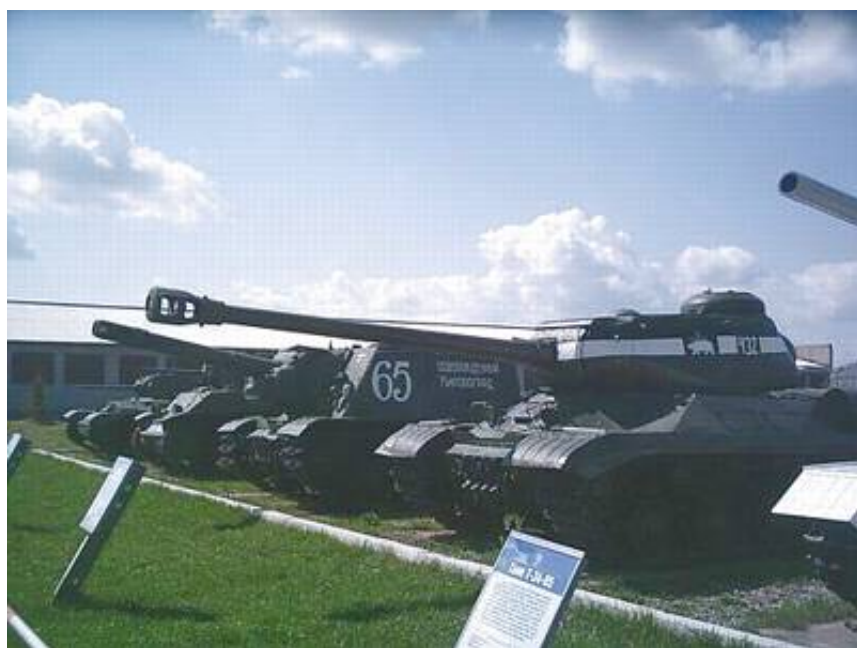
Billede fra indgangen til museet

Det er ikke lige til for en udlænding at komme til Kubinka kampvognsmuseum. Officielt skal man sende en anmodning nogle uger før med kopi af ens pas for at få mulighed for at komme ind. Derudover skal man også være i følgeskab af en guide. Heldigvis var jeg derude med nogle russiske venner og de købte billetten for mig og så var der ingen, der opdagede, at jeg ikke var russer. Grunden til besværlighederne er formodentlig, at Den Russiske Hær har et øvelsesområde og center for udvikling af kampvogne i forbindelse med museet.