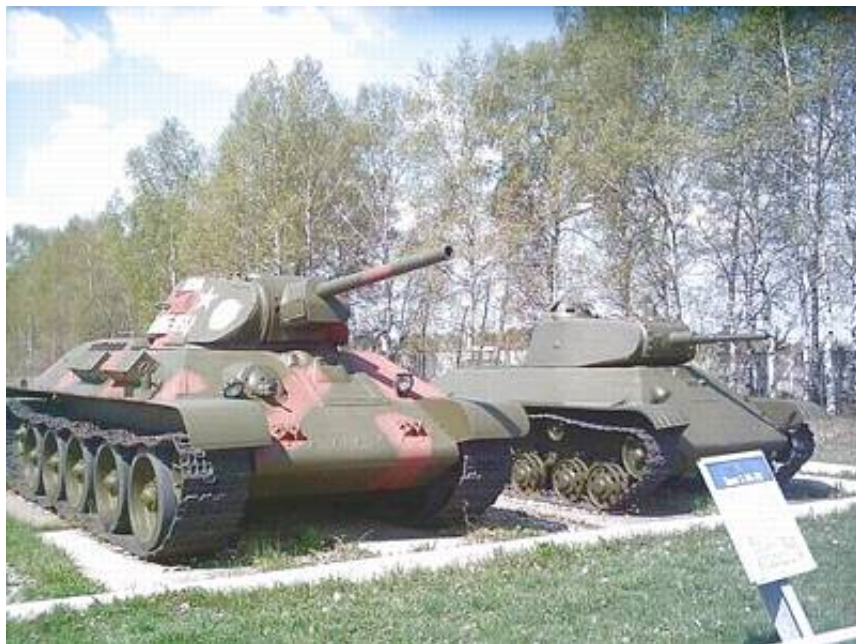
Den berømte T34/76 kampvogn

kampvogne i Den Røde Hær til moderne T80 kampvogne og BMP 3 infanterikampkøretøjer.