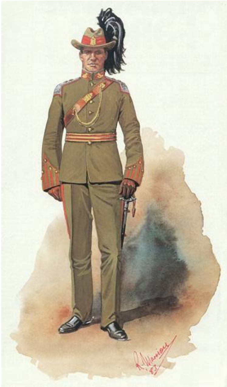
King Edward's Horse (The King's Overseas Dominions Regiment), officer i gallauniform, 1912.