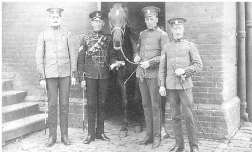
King Edward's Horse (The King's Overseas Dominions Regiment), i udgangsuniform samt en sergent fra 20 th Hussars, ca. 1908. Fra Kilde 4.

Til udgangsuniform bar officer og mandskab en khakifarvet kasket, med rødt huebånd og mørkebrun læderskygge.