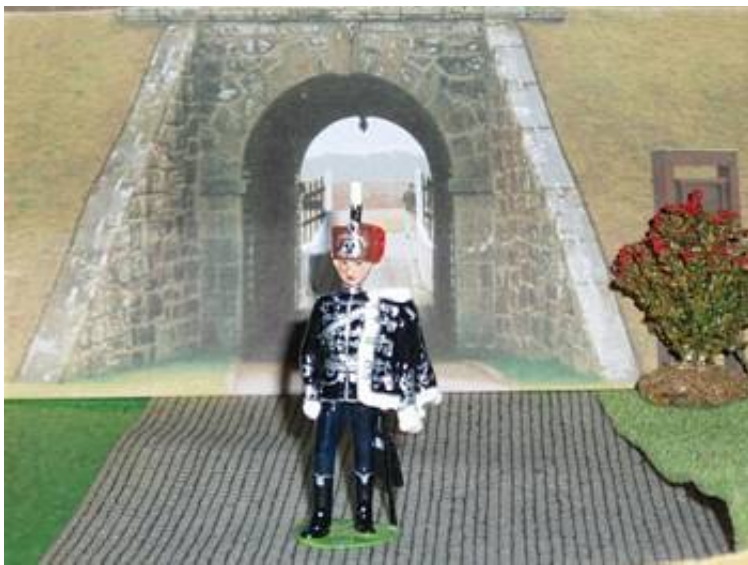
Officer fra 1. Leib Husar Regiment, Tyskland ca. år 1900. (Dødningshoved husar)