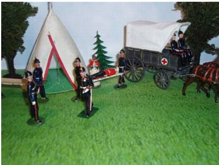
Lægen modtager sårede i feltlazarettet.