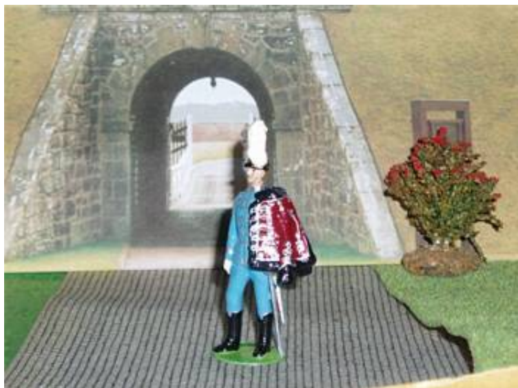
Officer fra Gardehusar regimentet.