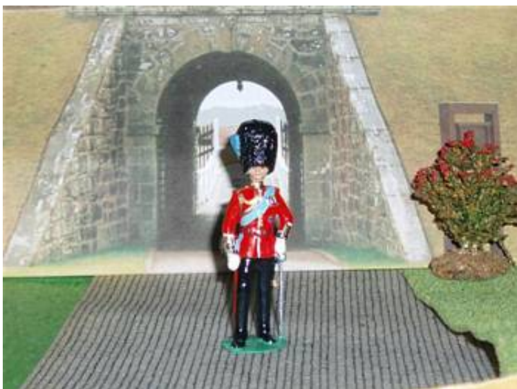
Medlem af det engelske kongehus i