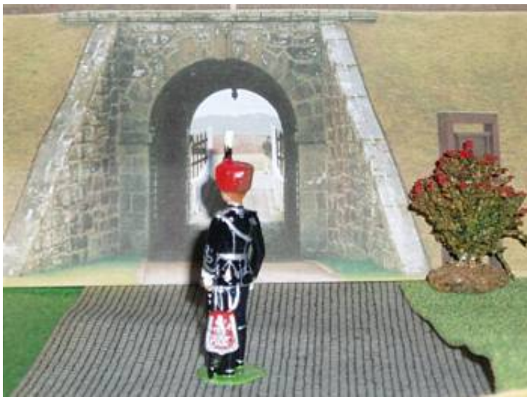
1. Leib Husar officer uden pels.