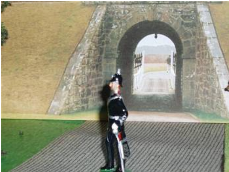
At det er en Territorial officer kan ses på, at al besætning på uniformen og hjelmen er i sølv.