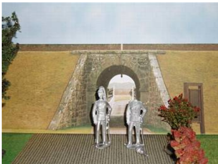
Planlagt er: To franske stabsofficerer, en dragon og en infanterist.

Jeg håber med denne artikel at have bidraget til at vise, at en figur kan have et utal af muligheder og funktioner, kun fantasien sætter grænsen.