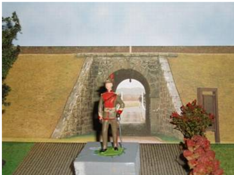
I arbejde er denne figur: En officer fra Worcestershire Yeomanry i Dismounted Review Order ca. 1905.