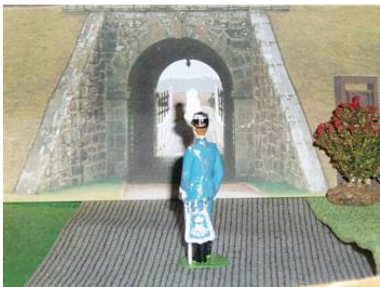
Gardehusarofficer uden pels.