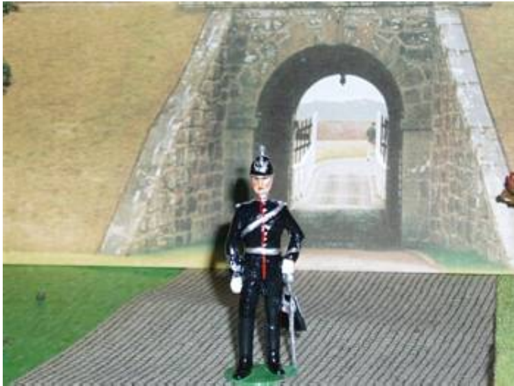
Officer fra Royal Artillery (V) år 1907. V står for Volunteer = frivillig.

sin Battery Sargent Major (BSM) og hornblæser.