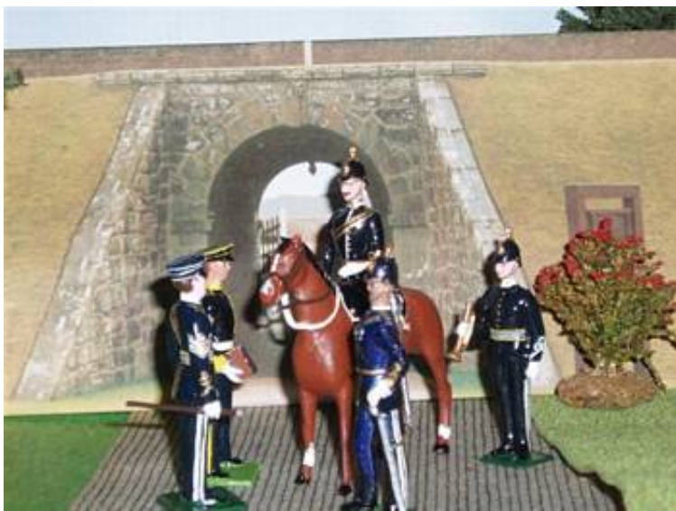
Her sammen med sin chef, en sergent, en hornblæser og en sergent fra Army Pay Corps.