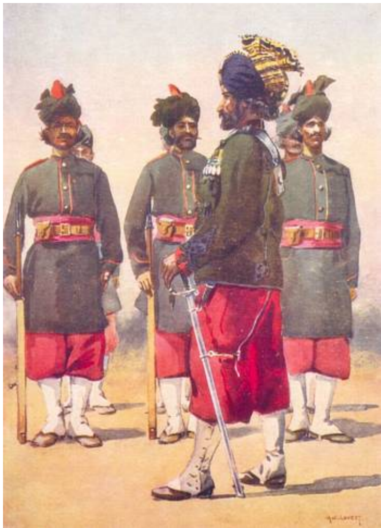
127 th Queen Mary's Own Baluch Light Infantry. Tegnet af A.C. Lowett, 1910.

Tre bataljoner fra det senere 10 th Baluch Regiment gjorde tjeneste i Østafrika: