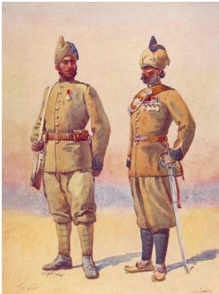
Punjab Frontier Force . Tegnet af A.C. Lowett, 1910. Postkort fra National Army Museum, London.

I 1914 bestod bataljonen af følgende personelgrupper: