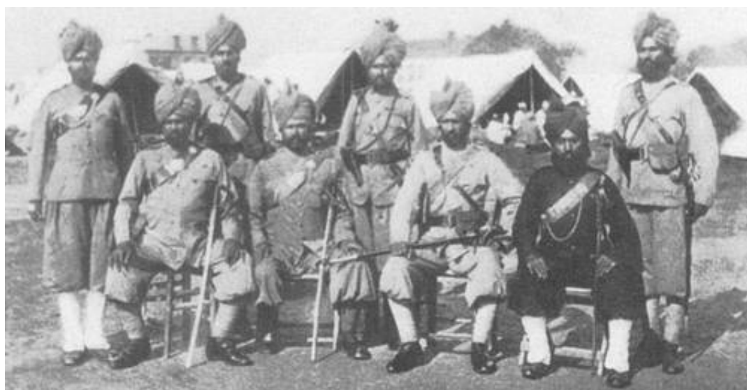
Officerer fra 30 th Baluch Infantry, ca. 1901.

Under mobiliseringen i Rangoon blev to af bataljonens kompagnier opløst på grund af lydighedsnægtelse. Bataljonen var oprindeligt udset til at skulle kæmpe mod tyrkerne i Mesopotamien, hvilket fremkaldte åbent oprør blandt bataljonens soldater fra Mahsud stammen. To kompagnier blev opløst, og erstattet af soldater fra 46 th Punjabis.