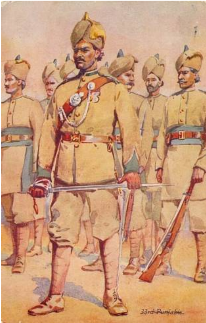
33 rd Punjabis. Tegnet af A.C. Lowett, 1910. Fra et postkort i serien "Our Indian Armies", A. & C. Black, London, fra ca. 1920.

Se også Den indiske hær 1910-1940 - Om infanteriet, Del 2.