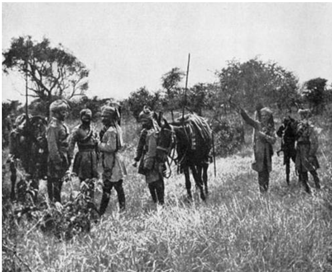
Indisk kavaleri i Østafrika 3 ).

General Wapshare udbad sig i januar 1915 forstærkninger fra Indien, og en eskadron fra 17 th Cavalry sammen med 130 th Baluchis (Jacob's Rifles) (omtales senere) blev sendt til Østafrika. Enhederne var fremme i Mombasa i februar 1915, hvor eskadronen blev sendt til området om Longido, mens bataljonen blev sendt til Voi.