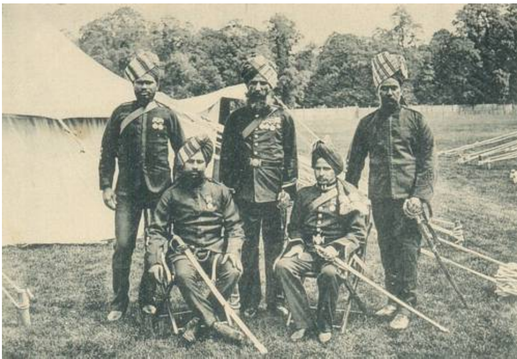
Indian Native Doctors, stationed at Hampton Court Palace, June 1902.

Som eksempel anføres 129 th Punjabis, der i marts 1917 - skønt forstærket med friske soldater fra Indien - kun talte 400 mand, hvoraf 36 % var syge. I maj talte bataljonen 50 aktive, hvorefter den blev igen forstærket. Styrken voksede til 500 mand, men var i november 1917 (hvor bataljonen var vendt tilbage til Indien) nede på 250 aktive soldater. Af de 250 mand, der således var døde, sårede eller syge, kan kun 100 henføres til tab som følge af kamp.