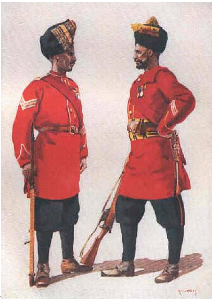
> 5 th Light Infantry and 6 th Jat Light Infantry.

Oprøret blev nedkæmpet i løbet af nogle dage og 126 soldater, der blev identificeret som hovedmændene bag oprøret kom for en krigsret. 37 blev dømt til døden og 41 deporteret for livstid, mens de resterende blev idømt fængselsstraffe af forskellig længde. Årsagen til oprøret var angiveligt rygter om, at bataljonen skulle sendes til Mellemøsten og indsættes mod tyrkiske (= muslimske) soldater.