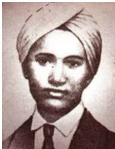
Sardar Kartar Singh "Sarabha".

Dele af visse militære enheder sympatiserede med sagen, ligesom et antal af bevægelsens medlemmer havde meldt sig til hæren for derved at kunne tilegne sig våben, men generelt forholdt enhederne sig i ro.