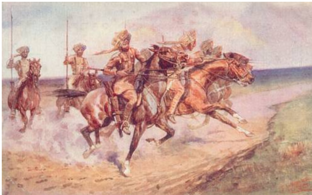
Charge of the Bengal Lancers, ca. 1915.