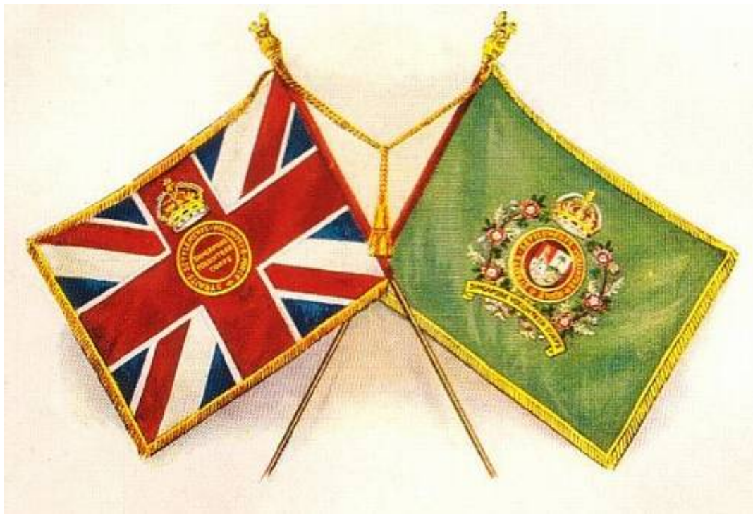
Faner fra Singapore Volunteer Corps. Fra Kilde 7.

De militære enheder i Singapore er et spændende emne i sig selv, men en nærmere behandling ligger uden for rammerne af denne artikel.