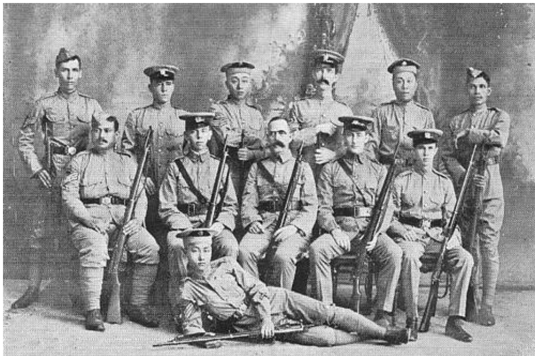
Medlemmer af Singapore Volunteer Corps, 1908.

Fra Kilde 7, hvor også soldaternes navne findes i den oprindelige billedtekst.