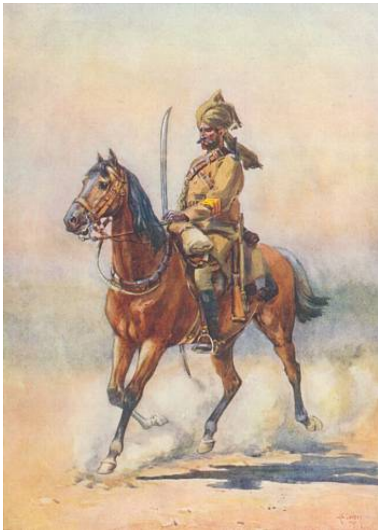
25 th Cavalry. Tegnet af A.C. Lovett, 1910.

Kilde 3 beskriver soldaten som en pathan , tilhørende Bangash stammen.