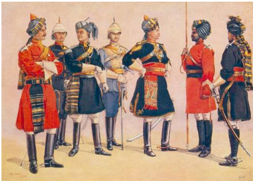
Indian Cavalry. Tegnet af A.C. Lovett, 1910. Postkort fra National Army Museum, London.

Regimentet burde, jf. Kilde 4, havde haft nummer 13, da det gennem den nyere del af sit liv, var meget uheldigt. Hver gang der var udsigt til aktiv tjeneste, kom der uheld og sygdomme i vejen. Det er da også et af de eneste kavaleriregimenter i den indiske hær, der ikke kan smykke sig med en lang række fanebånd til minde om fordums storhed.