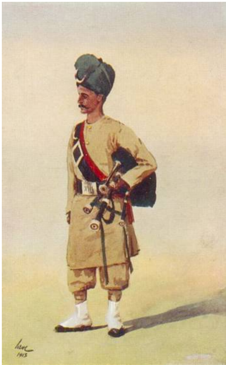
17 th Infantry (The Loyal Regiment), 1913. Fra et nogenlunde samtidigt postkort, udgivet af Gale & Polden; kunstnerens signatur kan ikke tydes.

En af de enheder, der blev udsendt som forstærkninger fra Indien, var 17 th Infantry, med tilnavnet The Loyal Regiment, der stammer fra tiden efter Det indiske Oprør.