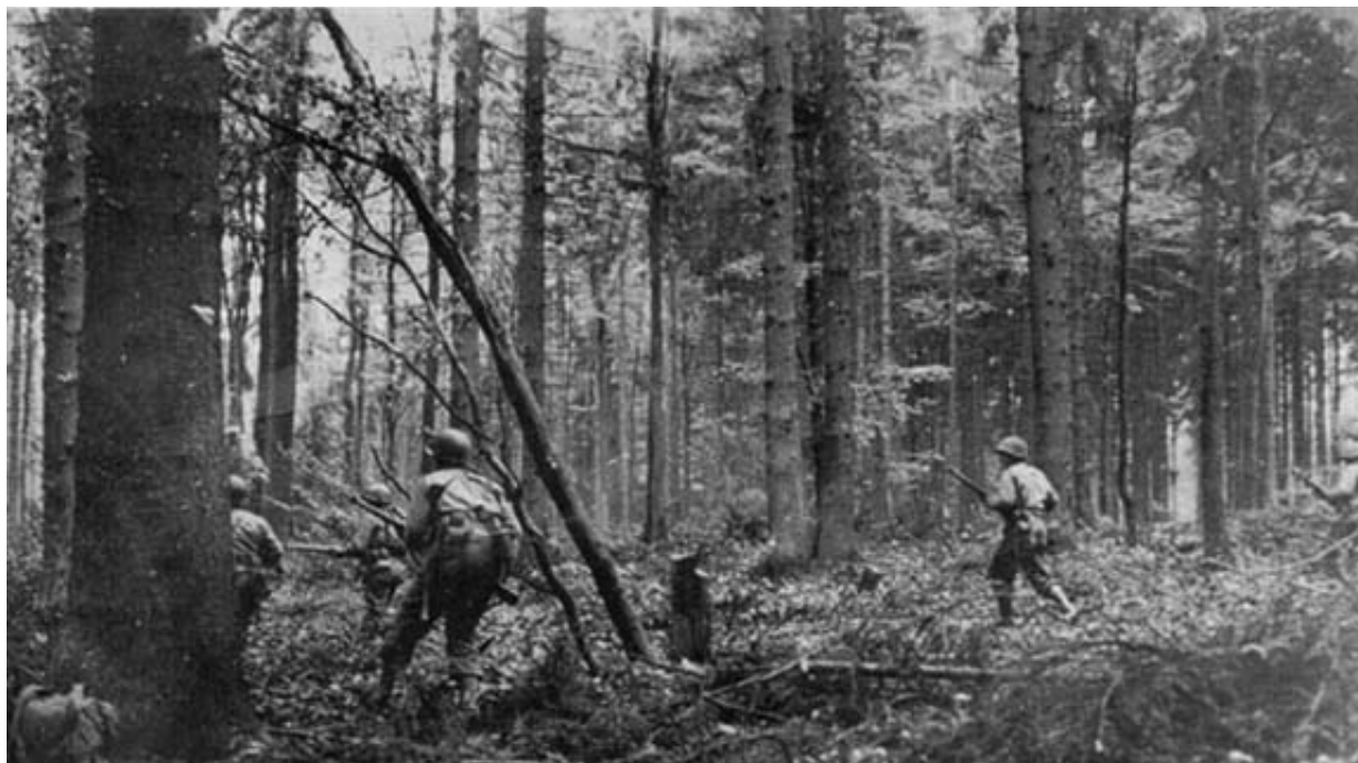
Amerikansk infanteri under fremrykning, 2. november 1944

Overlevende giver et billede af soldater, der ikke anede, hvor de var, men vedblev at tumle gennem den ødelagte skov.