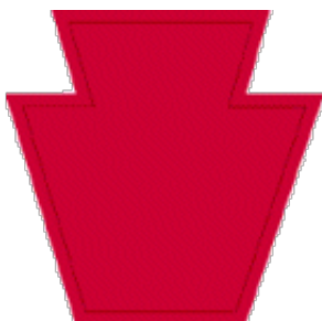
28. Infanteridivisions mærke

Hürtgenwald ligger ca. 12 km sydøst for Aachen i et bjergrigt terræn. Skoven var ca. 20 km lang og ca. 8 km bred. Sigtbarheden i skoven var maksimalt 150 m, normalt dog kun 8 - 10 m.