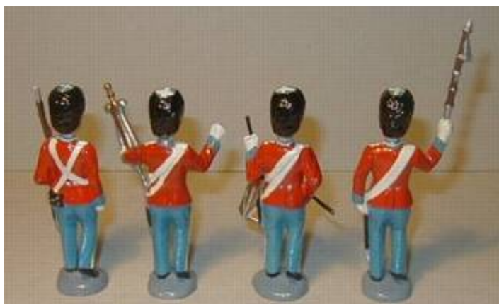
Katalognummer 1501, 1504, 1505 og 1508

Bemærk: De malede figurer ikke er i originalbemaling. Fodstykkerne er i bunden mærket med bogstaverne B.N. Figurerne er støbt i letmetal og er 8,2 cm høje (6,5 cm fra sål til øjne).