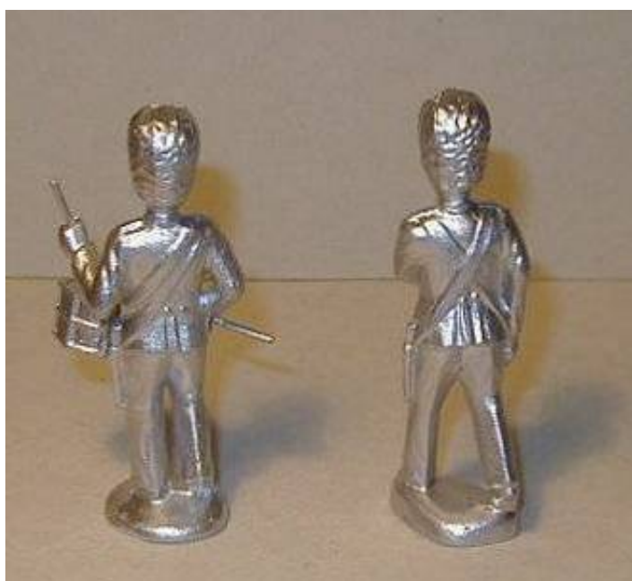
Katalognummer 1507 og 1503.