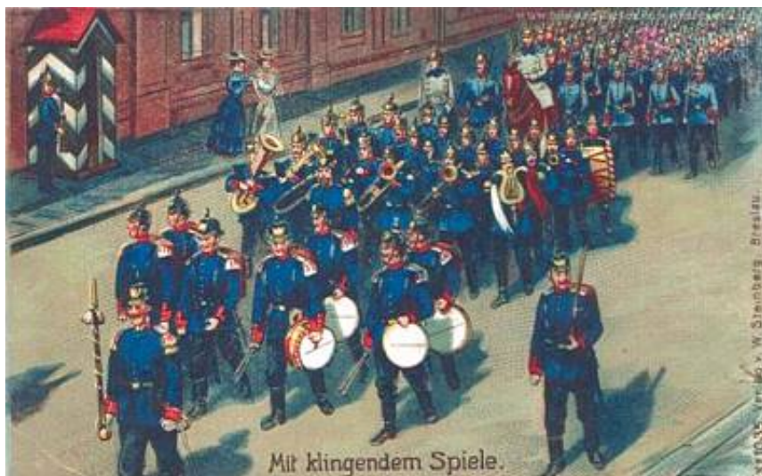
Vagten trækker op. Typisk fra kasernen til byens vagt.