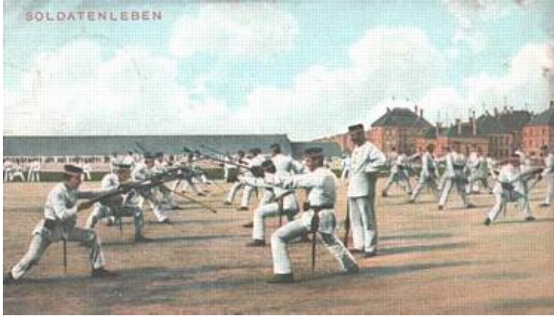
BajonETFægtning uden maske og kyrass.