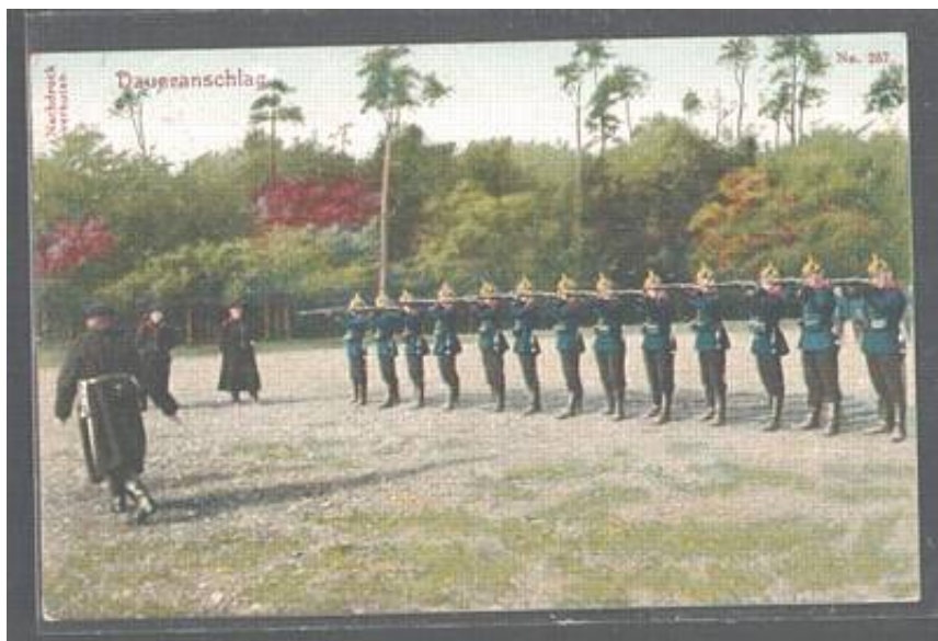
Her indøves stående skydestilling.

Dette forløb skal gennemgås før soldaten er klar til at skyde med skarp ammunition på skydebanen.