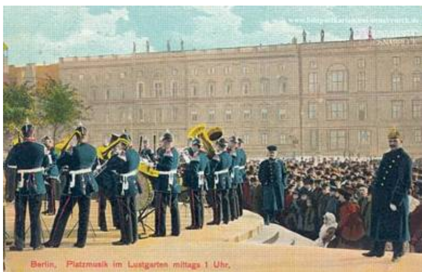
Der spilles på byen torv. Dette kendes fra vagtparaden på Amalienborg, hvor livgardens musikkorps underholder efter selve vagtafløsningen.

Da vi er i tiden før de af os kendte mekanisk og elektroniske musikgengivere, skal nævnes at det var et tilløbsstykke, ligeledes hvis musikkorpset spillede i parken eller på torvet om søndagen.