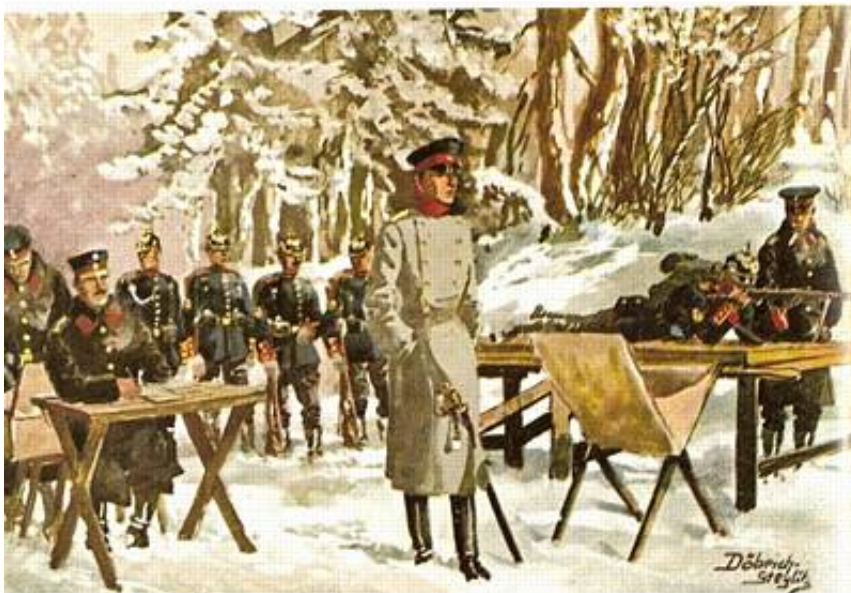
Unten : Auf dem Schießstand – Nach einer mehrfarbigen Zeichnung von Erich R. Döbrich-Steglitz

På kortet til venstre er også vist, hvorledes skiverne betjenes i markørgraven.