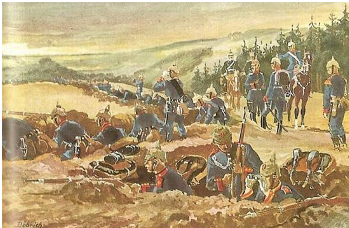
En øvelse mange fik glæde af i den følgende krig.