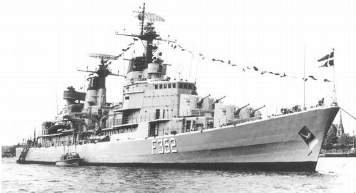
Fregatten PEDER SKRAM, maj 1975.

Med Mastekranen og Rigets Flag som nogle af sine nærmeste naboer, har fregatten PEDER SKRAM fået en markant placering på Holmen, til stor fordel for såvel Marinestation Holmen (på hvis område fregatten ligger), fregatten selv som Københavns Havn.