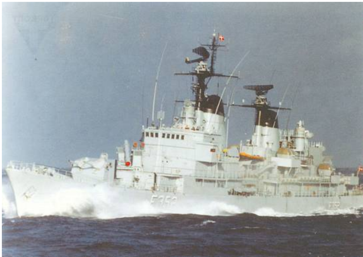
Fregatten PEDER SKRAM, fotograferet i 1980'erne - klar til engagement med artilleriet. Postkort fra museet.

I 1979 fik PEDER SKRAM og HERLUF TROLLE monteret de 2 x 4 stk. Harpoon-missiler på fordækket, i stedet for kanontårnet nærmest broen (se billedet fra 1975).