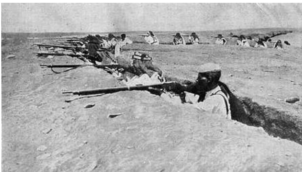
Beduiner i tyrkisk tjeneste, fotograferet i skyttegrave nær Det røde Hav 8 ).

Fra engelsk side vurderede man, at en fjendtlig beherskelse af stedet gav mulighed for at minere Suezbugten, en alvorlig trussel mod skibstrafikken.