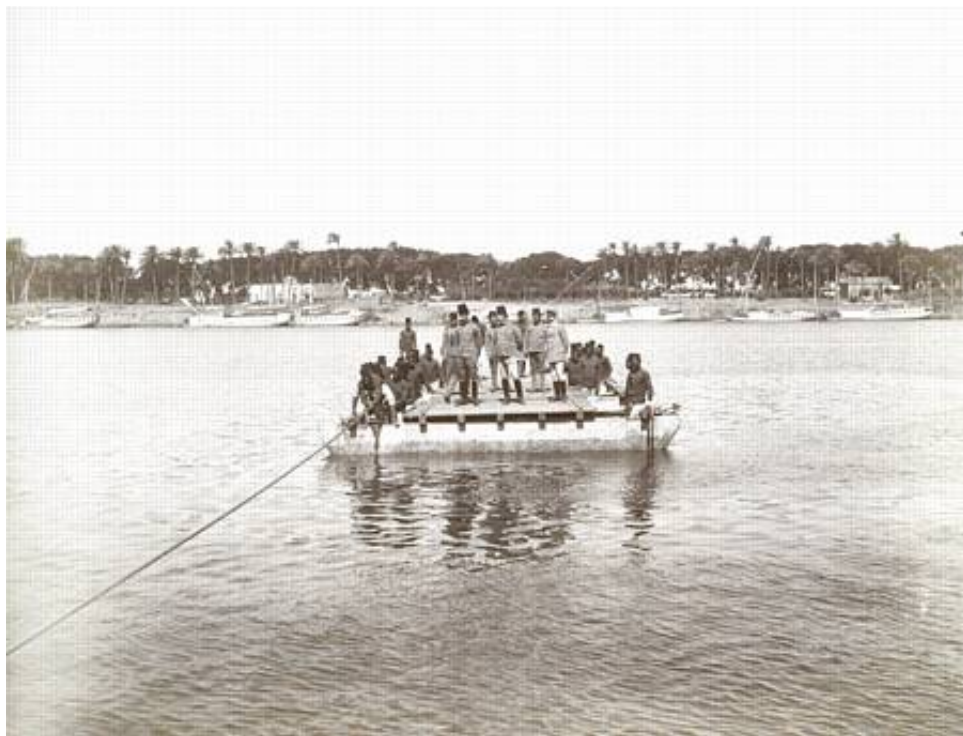
Færge af pontoner, bemanded med ægyptiske soldater.

En ubevæbnet styrke på 110 mand, samt det nævnte kamelberedne detachement, deltog i arbejdet med at indrette forsvarsstillinger langs Suezkanalen. Styrken var muligvis under kommando af kaptajn R.E.M. Russel, Royal Engineers.