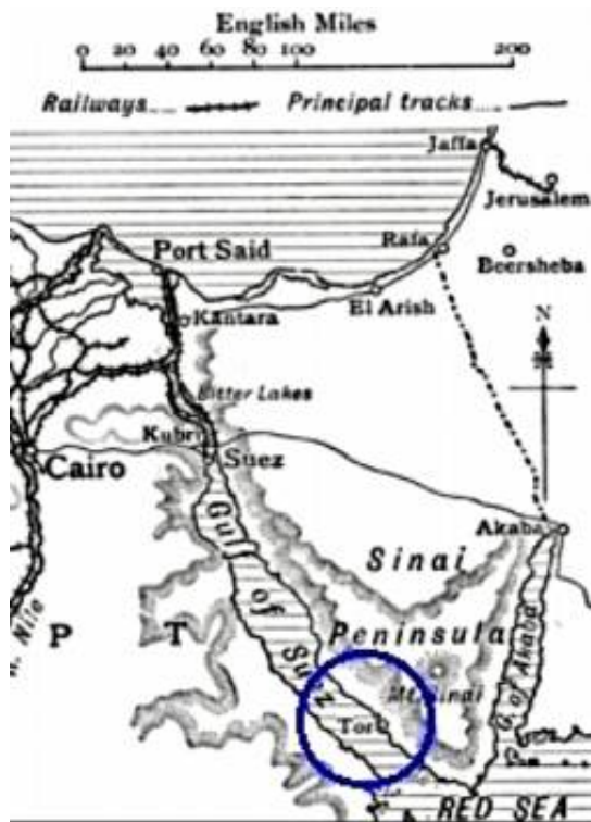
Kort 2: Uddrag af kort over Ægypten.