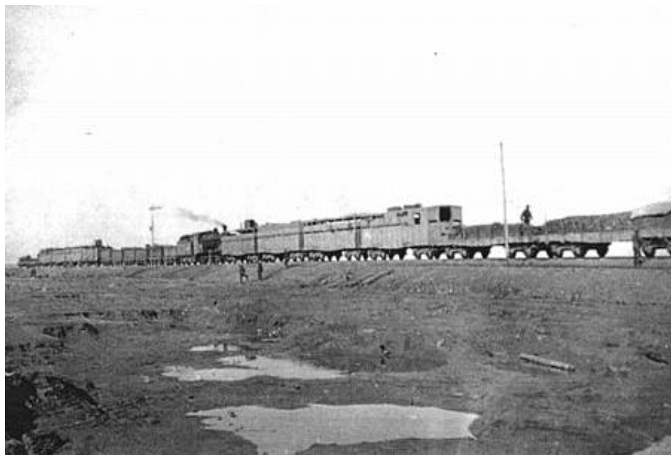
Et ægyptisk pansertog, ca. 1915.

Det ene af disse pansertog var stationeret i Kantara (i Sektor 3) og bemanded et halvt kompagni indisk infanteri.