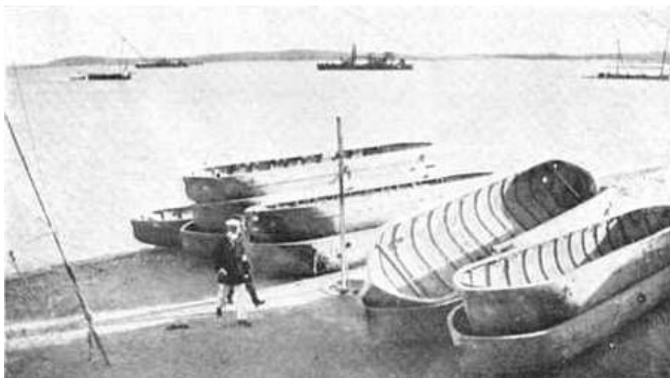
Erobrede tyrkiske pontoner, fotograferet ved Ismalia. Fra Kilde 4.

Batteriet ødelagde mindst to tyrkiske pontoner.