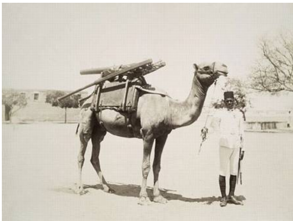
Ægyptisk kamelbåret artilleri, ca. 1900.

Det ægyptiske artilleris 5. Batteri bestod af 4 stk. bjergkanoner og 2 stk. Maxim maskingeværer, og blev 2. februar 1915 indsat i forsvaret af Toussoum (Tussum) i Sektor 2, omtrent ved Punkt 1 på Kort 1.