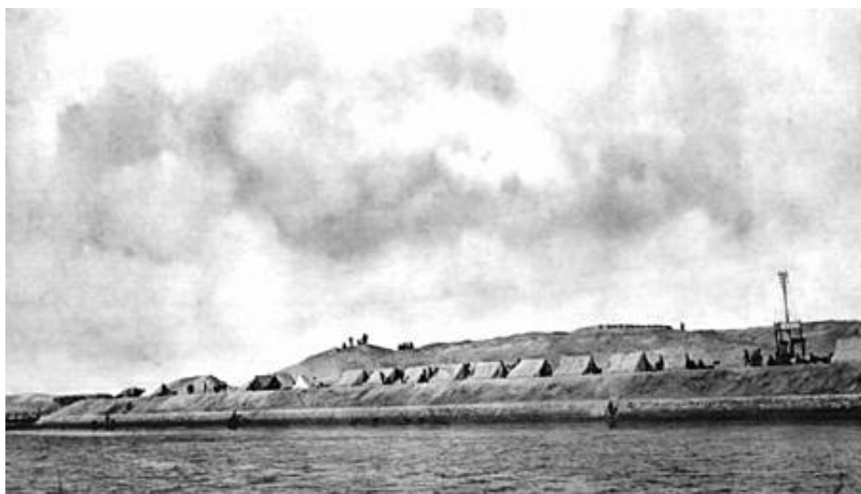
En engelsk befæstet lejr på østsiden af Suezkanalen, 1914 3 .

Ingeniørarbejderne omfattede bl.a. indretning af stillinger på vestbredden af kanalen, samt en række poster på østbredden, broslagning ved El Qantara og El Kubri samt en pontonbro ved færgehavnen i Ismalia samt broslagning over ferskvandskanalen (Sweet Water Canal) - i alt 8 broer. En stor del af dette arbejde blev udført af to engelske, et australsk og to indiske ingeniørkompagnier.