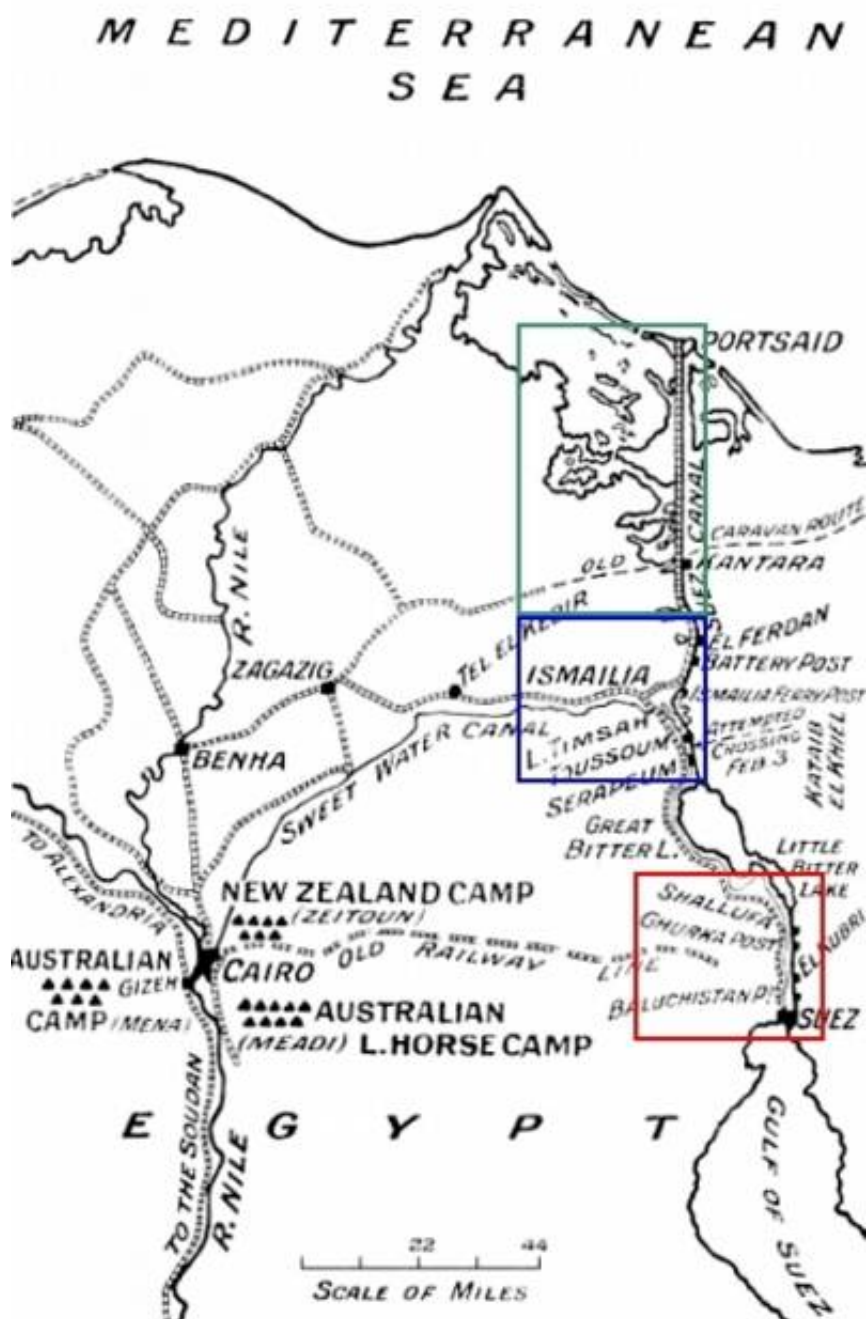
Kort 1. Forsvaret af Suezkanalen i 1914-15.

Ved krigens begyndelse påtog England sig det fulde ansvar for Ægyptens forsvar. I september 1914 blev den engelske garnison (se Efterskrift) sendt til Frankrig og erstattet af East Lancashire Division 1 ) (en Territorial Force enhed; senere 42 nd (East Lancashire) Division) samt en del indiske enheder. Siden kom også australske og newzealandske enheder til.