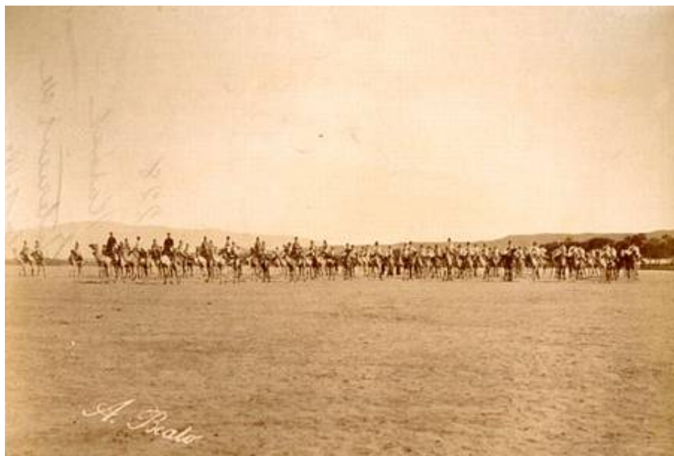
Det ægyptiske kamelkorps, ca. 1905.

blev hurtigt nedkæmpet, bl.a. af 62 nd Punjabis og 128 th Pioneers. Under disse kampe blev føreren af 5. Batteris artilleribedækning, løjtnant R.A. Fitzgibbon, dødeligt såret.