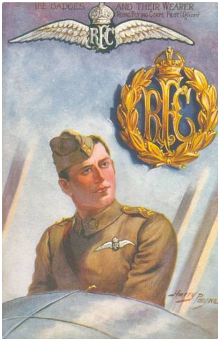
Royal Flying Corps, ca. 1914. Tegnet af Harry Payne.

De franske fly var ikke meget bedre stillet, men takket være rekognosceringen fra luften var man fra engelsk side i stand til at følge den tyrkiske fremmarch.