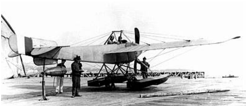
Nieuport X. Fra Kilde 6.

Eskadrillen, der var under kommando af søløjtnant, senere kaptajn de l'Escaille , var stationeret i Port Said.