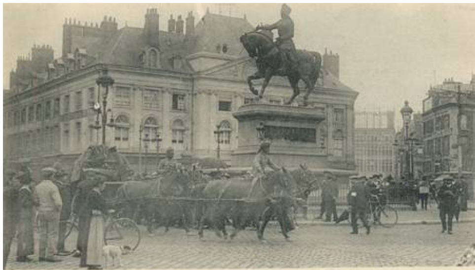
1914.. L'Armée indio Anglaise passant devant la statue de Jeanne d'Arc | British Indian Army passing in front of the statue of Joan of Arc

Indisk trænvogn 6 passerer Jeanne d'Arc statuen på Place du Martroi i Orléans 7 . Fra et samtidigt fransk postkort.