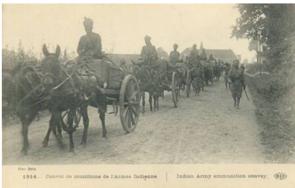
Indisk muldyrkærre, 1914. Fra et samtidigt fransk postkort.

Muldyrkærren er sandsynligvis lægens transportmiddel.