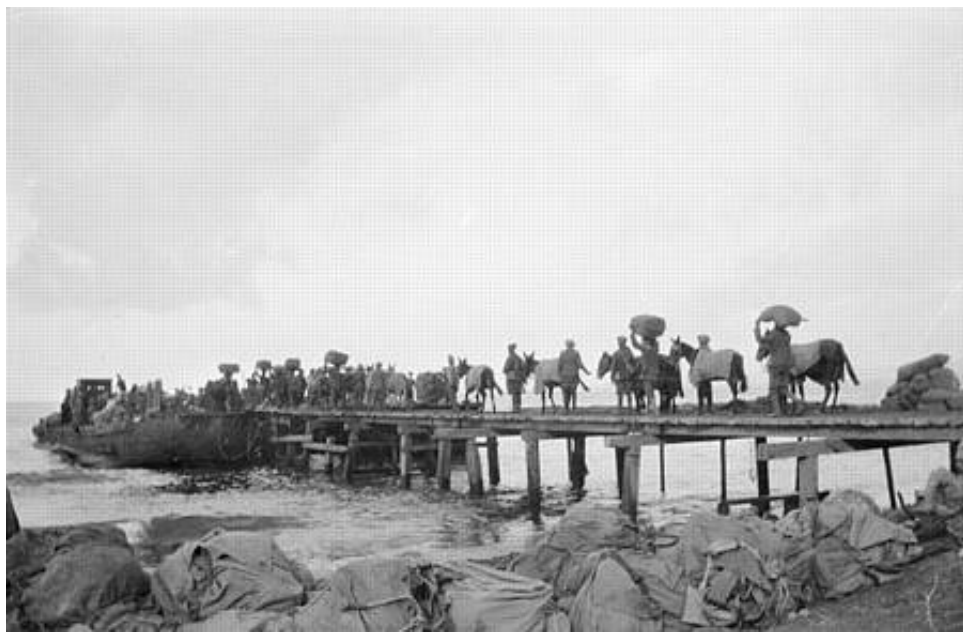
Indian Mule Cart Transport evakueres fra Gallipoli, den 15. og 16. december 1915.

Gengivet fra Kilde 17, hvor forfatteren, der også selv har taget billedet, har givet det underteksten: Ammunition from every Arsenal in India.