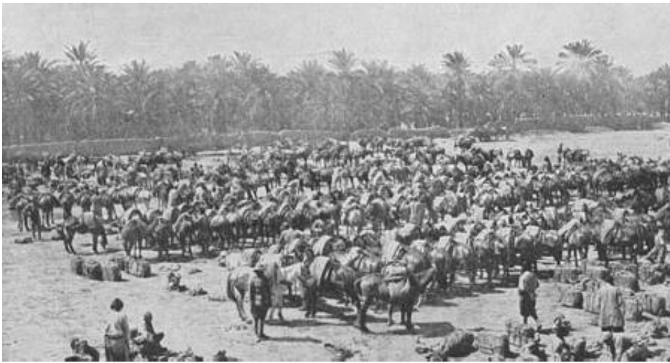
10 th Mule Corps, Basra, 1914.

Imperial Service enhederne indgik på linje med de regulære enheder, f.eks. i 6 th (Poona) Infantry Division 14 , der bl.a. kæmpede ved Basra i september 1914.