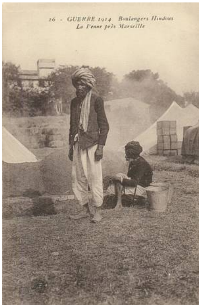
Indisk baker, i en teltlejr ved Marseilles, 1914. Fra et samtidigt fransk postkort.

I Marseilles var et større levnedsmiddeldepot, med levende dyr. Dette depot udleveredes i løbet af krigen 95.246 geder og 175.158 får - dyr, der sammen med kyllinger, så vidt vides, er acceptabel spise for medlemmer af de fleste religioner, bortset fra vegetarer (bl.a. Bhramin kompagniet i 9 th Bhopal Infantry), naturligvis.