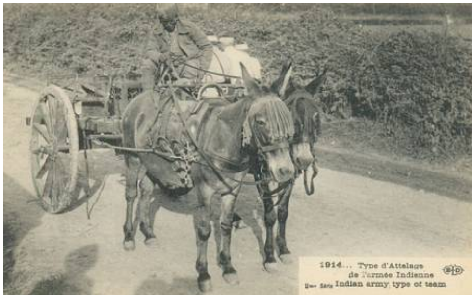
Indisk muldyrkærre, 1914.