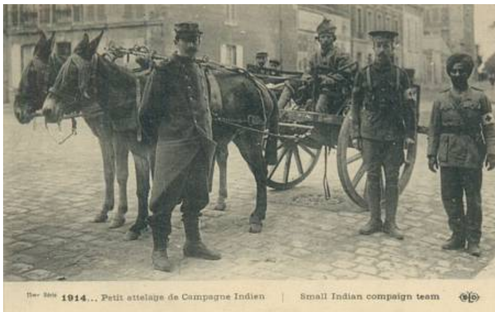
Muldyrkærre, Frankrig, 1914. Fra et samtidigt fransk postkort.

Igen har den vågne fotograf været på plads, og fanget denne ekvipage sammen med en indisk læge ( Indian Medical Department ) og en engelsk sanitetsunderofficer.