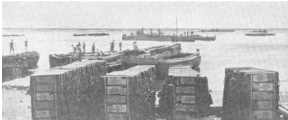
Ammunition oplagt på stranden i Anzac Cove.

Muldyrkompaniet landsættes ved Brighton Beach (i Anzac Cove) til støtte for The Australian and New Zealand Division. Kompagniets opgave består bl.a. i at transportere forsyninger fra kysten og til forsyningspunkter inde i landet. På de flade kyststrækninger kan kompagniet benytte sine muldyrkærrer, men må i mere uvejsomt terræn benytte muldyrene som pakdyr.