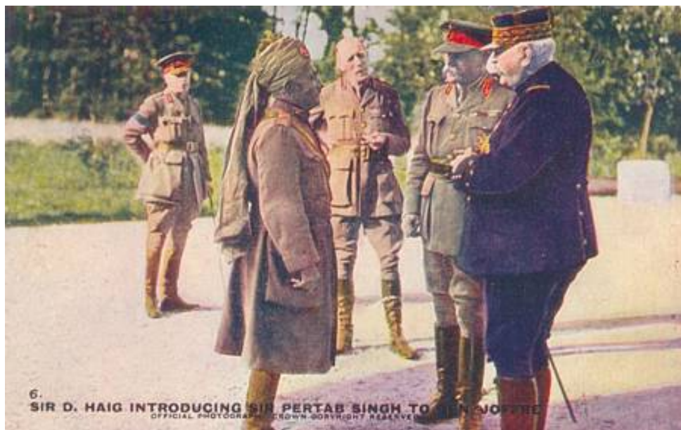
Sir Douglas Haig præsenterer Sir Pertab Singh for General Joffre.

Det nævnes her, at nestoren blandt de indiske soldater i Frankrig - den 70-årige Maharaja af Jodhpur, hvis engelske titel var generalløjtnant Sir Pertab Singh - blev involveret i sagen. Han måtte smage på dåsekødet, og sige god for det, inden den sidste rest af mistanke - i hvert fald officielt - blev fjernet.