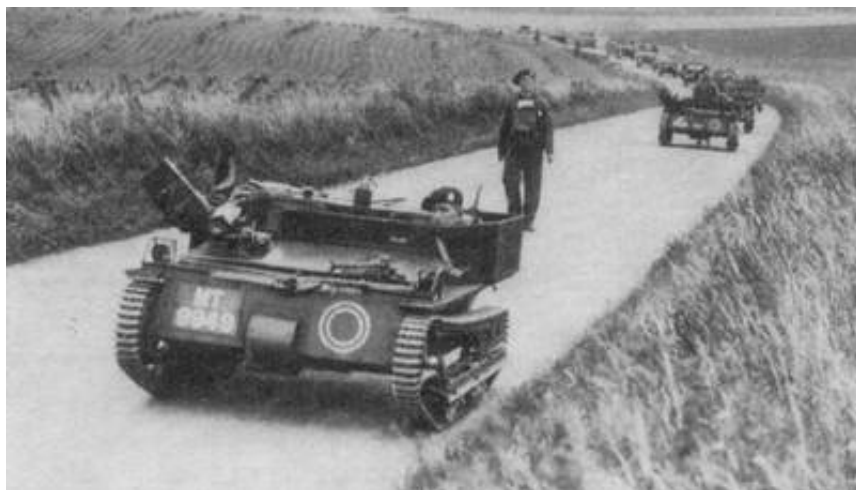
En kolonne Carden-Loyd kampvogne fotograferet under øvelse i 1929. Kampvognene kommer fra 3 rd Bn. Royal Tank Corps. Fra kilde 7.

Diskussionerne stod stort på i hele Mellemløstiden og man forsøgte sig med mange forskellige kampvognstyper - fra de mindst tænkelige tanketter (med en enkelt mand) til mere traditionelt udseende kampvogne. Blandt de typer, som kom i serieproduktion, var den lette kampvogn af Carden-Loyd typen. At kalde den en let kampvogn er måske nok noget af en tilsnigelse, men den blev - i mangel af bedre - brugt som sådan.