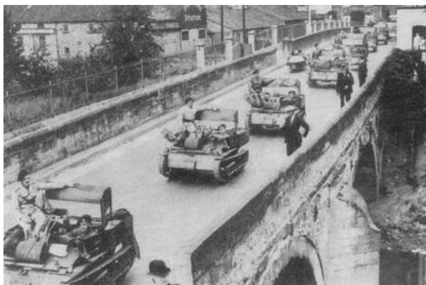
Dele af 4 th Bn. Royal Tank Corps under march, i 1937. Fra Kilde 7.

Royal Tank Corps blev den væsentligste bruger af Carden-Loyd kampvognen. Som nævnt blev den anvendt som let kampvogn - i lette bataljoner og som opklaringskampvogn i middeltunge kampvognsbataljoner. Den var ikke specielt velegnet i denne rolle, da det ikke var muligt at montere en radio i vognen.