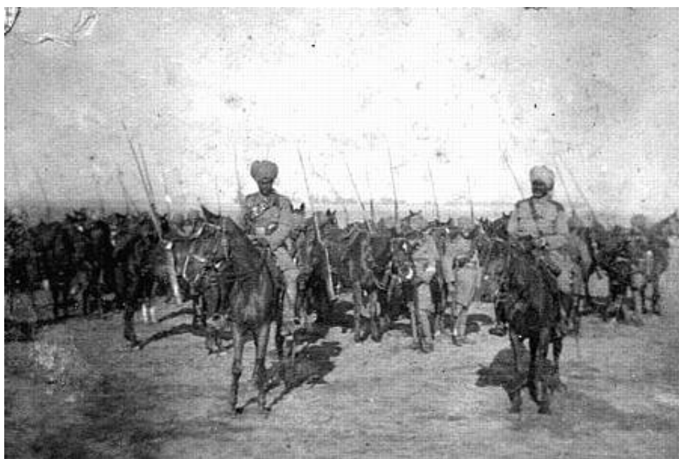
Patiala Lancers, ca. 1915.

Fra fotoalbummet Great Grandad Wood's Gallipoli (Maz Hewitt).