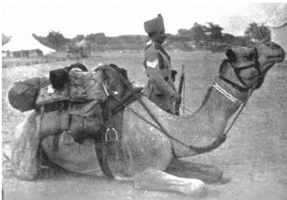
Bikaner Camel Corps, 1898. Fra Kilde 5.

Jeg har ikke været i stand til nogen nærmere beskrivelse af estandarten. Eventuelle oplysninger desangående modtages med interesse.