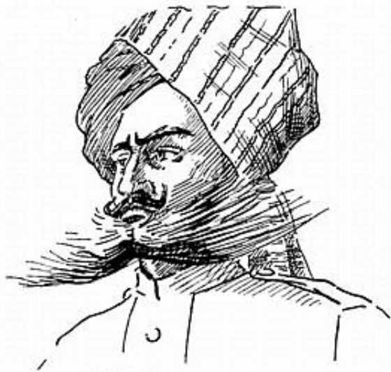
Sadul Light Infantry. Havildar.