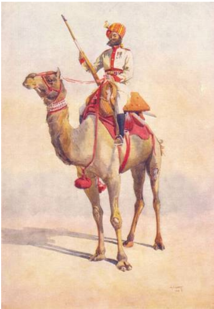
Bikaner Ganga Risala, Sowar (menig). Tegnet af A.C. Lowett, 1910. Postkort fra National Army Museum, London. Soldaten er en Rathore Rajput .