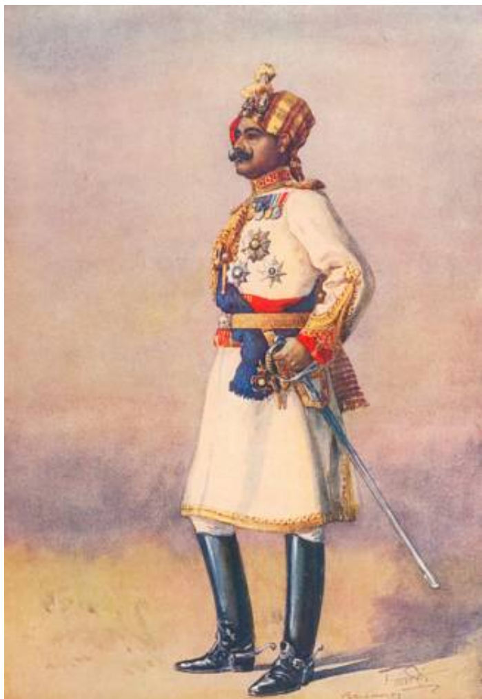
Maharaja Sir Ganga Singh af Bikaner, ca. 1910 8 . Fra Kilde 2.