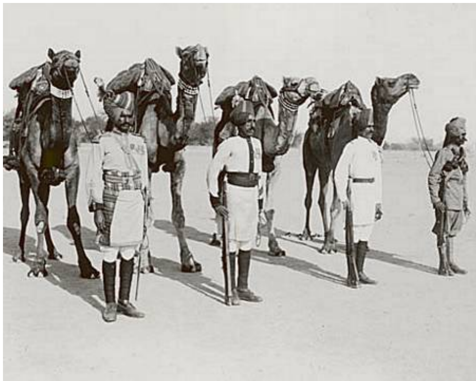
Bikaner Camel Corps, ca. 1914.