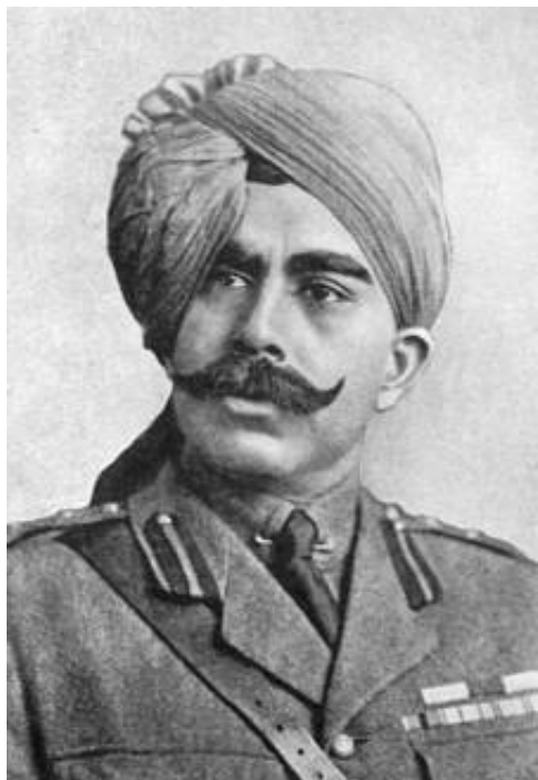
Maharaja Sir Ganga Singh af Bikaner, ca. 1915.