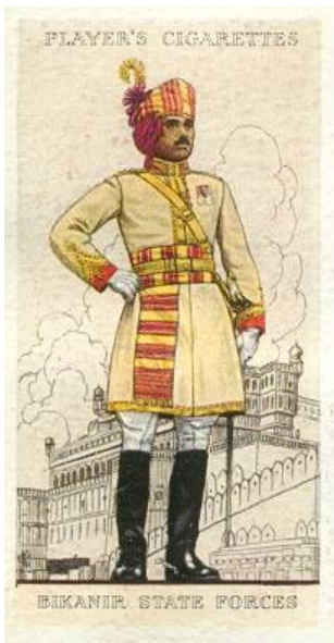
Bikanir State Forces. Cigaretkort nr. 29 fra Player's serie Military Uniforms of the British Empire Overseas, 1938.