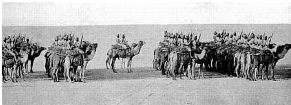
Bikaner Camel Corps, 1905 5 .

Kampene mod The Mad Mullah 4 i Somaliland krævede indsættelse af kamelberedne enheder og her kom de ørkenvante soldater fra Bikaner til deres ret. 215 mand og 250 kameler forlod Indien 10. januar 1903 med kurs mod Somaliland.