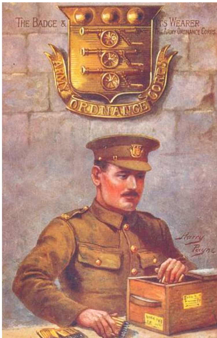
The Army Ordnance Corps, ca. 1914. Tegnet af Harry Payne.

Postkort fra serie II af " Regimental badges and their Wearer ", nr. 8491, udgivet af Raphael Tuck & Sons "Oilette", der blev udgivet under Første Verdenskrig.