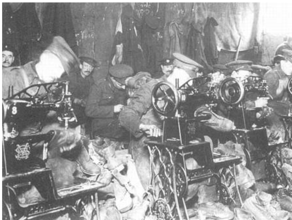
Army Ordnance Corps - Fremstilling af støvler, 1915.