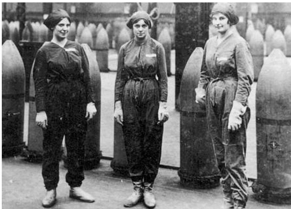
Kvindelige ammunitionsarbejdere, 1918.