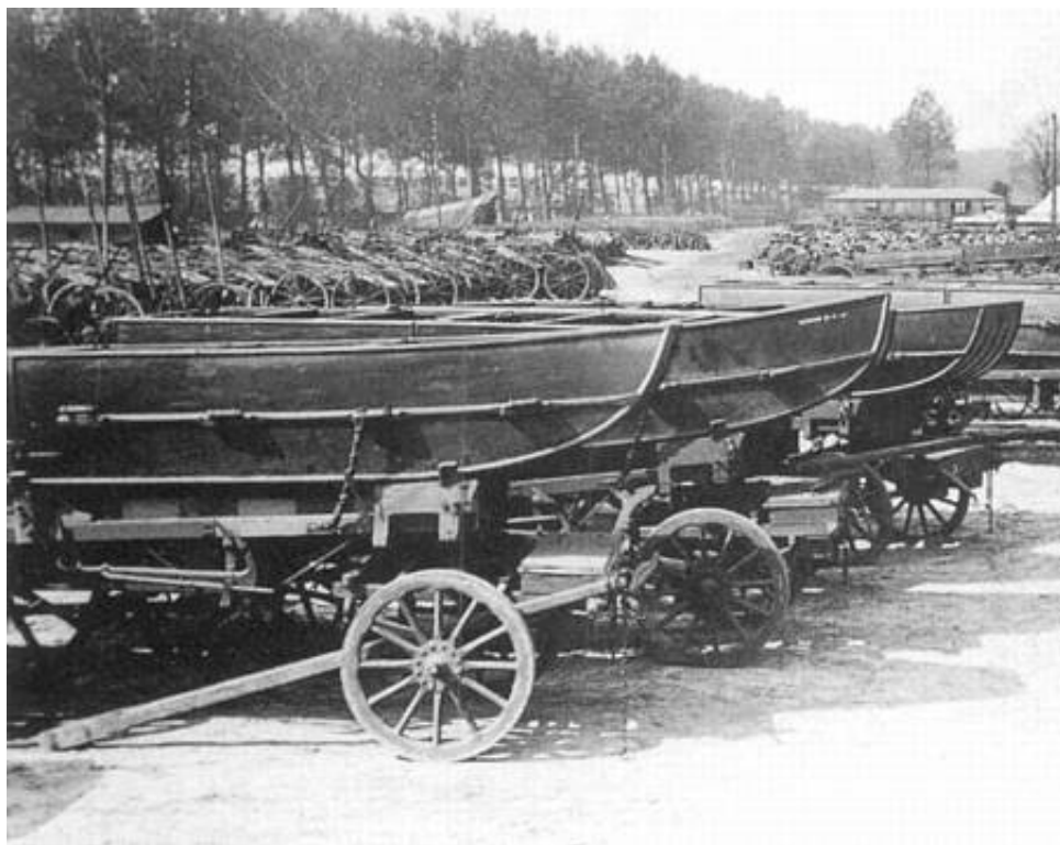
Army Ordnance Corps - Depot med pontonvogne og trævogne, 1915. Fra Kilde 3.

Et meget stort antal civile blev derfor inddraget i fremstillingsarbejdet, herunder en lang række kvinder, som deltog i fremstillingen af ammunition.