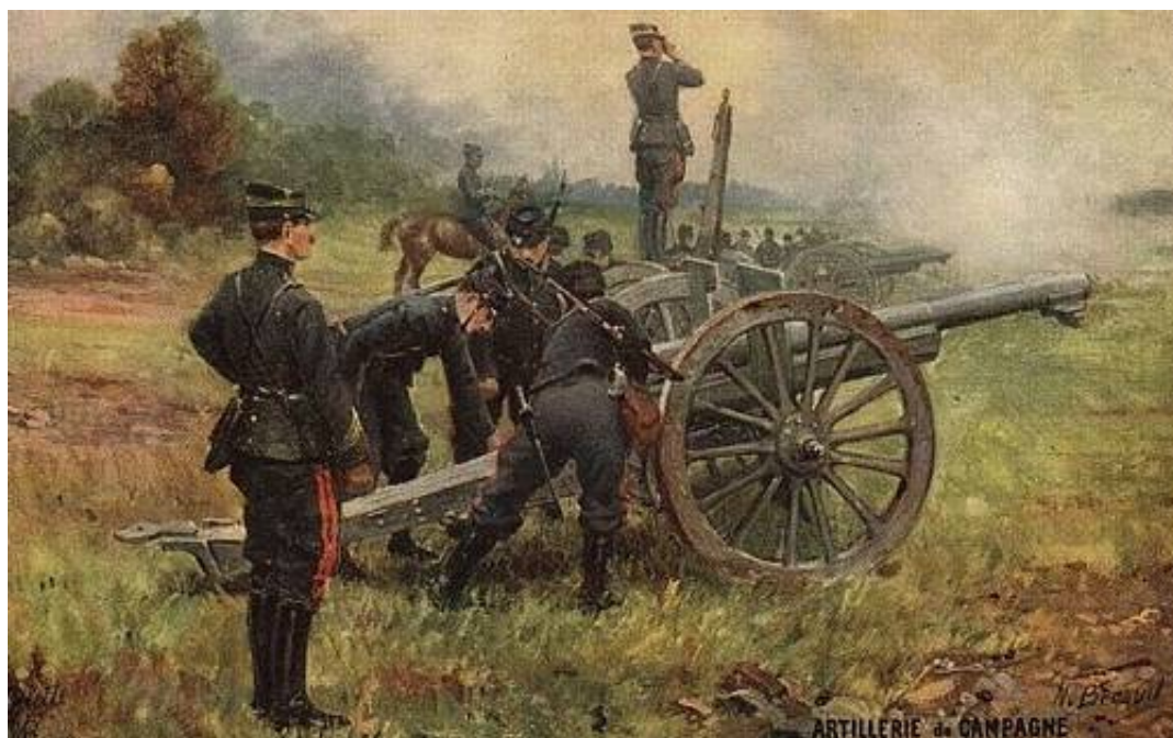
Fransk 75 mm feltkanon, ca. 1914.

De her viste uniformer giver et indtryk af enhedernes uniformer i 1914.