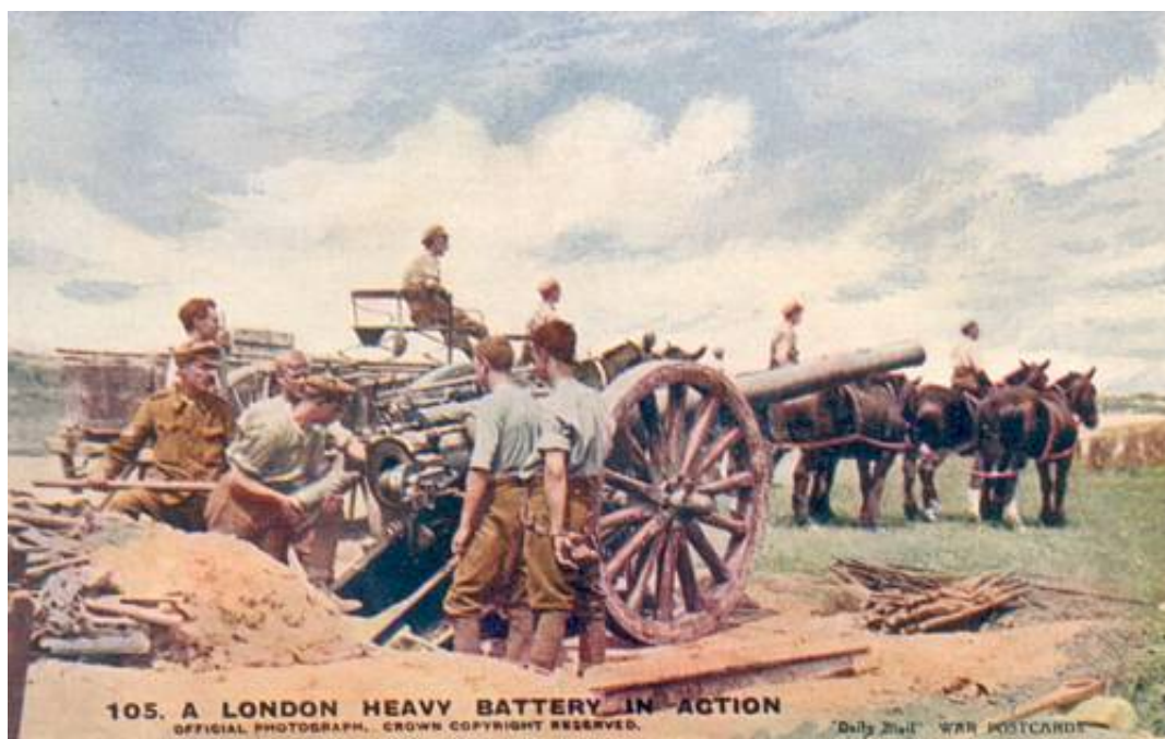
A London Heavy Battery in Action.

Der blev efterladt et godt 4 km bredt hul i frontlinjen, hvorigennem der nu strømmede tyske enheder af det XXVI Reservekorps (General von Hügel); reservekorpsset bestod af 51. Reservedivision og 52. Reservedivision.