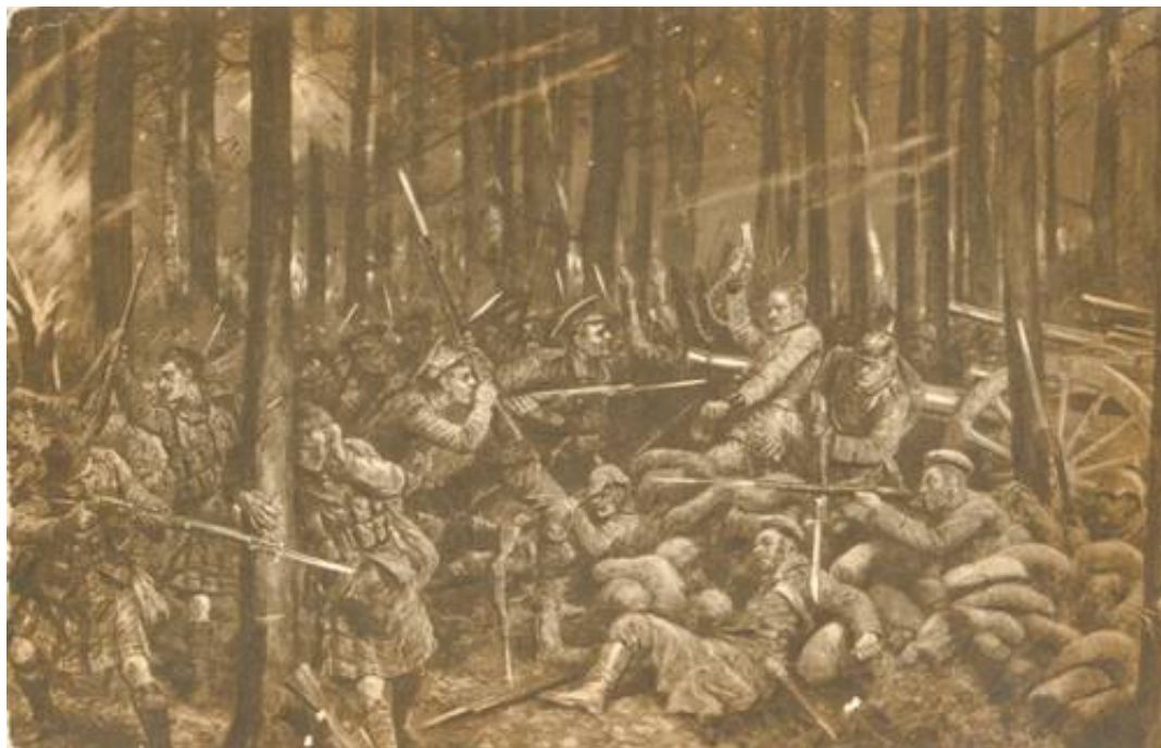
The Canadian's night attack "that saved the situation" at Ypres.

Situationen er afbilledet på dette samtidige postkort, der har kilde hos Illustrated London News.