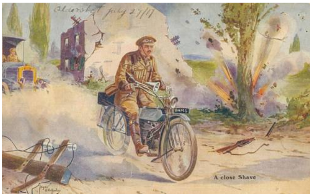
A close Shave.

Modangrebet var planlagt til at foregå samtidig med et angreb, som den algierske division ville sætte ind. Dette angreb fandt dog aldrig sted; sandsynligvis var divisionen for svækket til at kunne gennemføre en koordineret indsats.