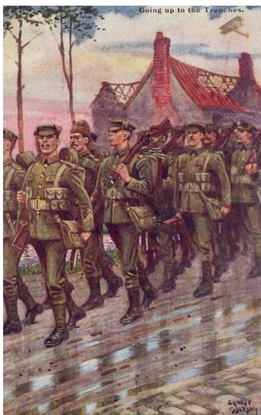
På vej mod skyttegravene, ca. 1915. Samtidigt postkort tegnet af Ernest Ibbetson.

Bøger af Mike Chappel er næsten altid særdeles gode og han har gennem mere end 20 år udgivet en lang række værker om den engelske hær, illustreret med sine egne glimrende tegninger.