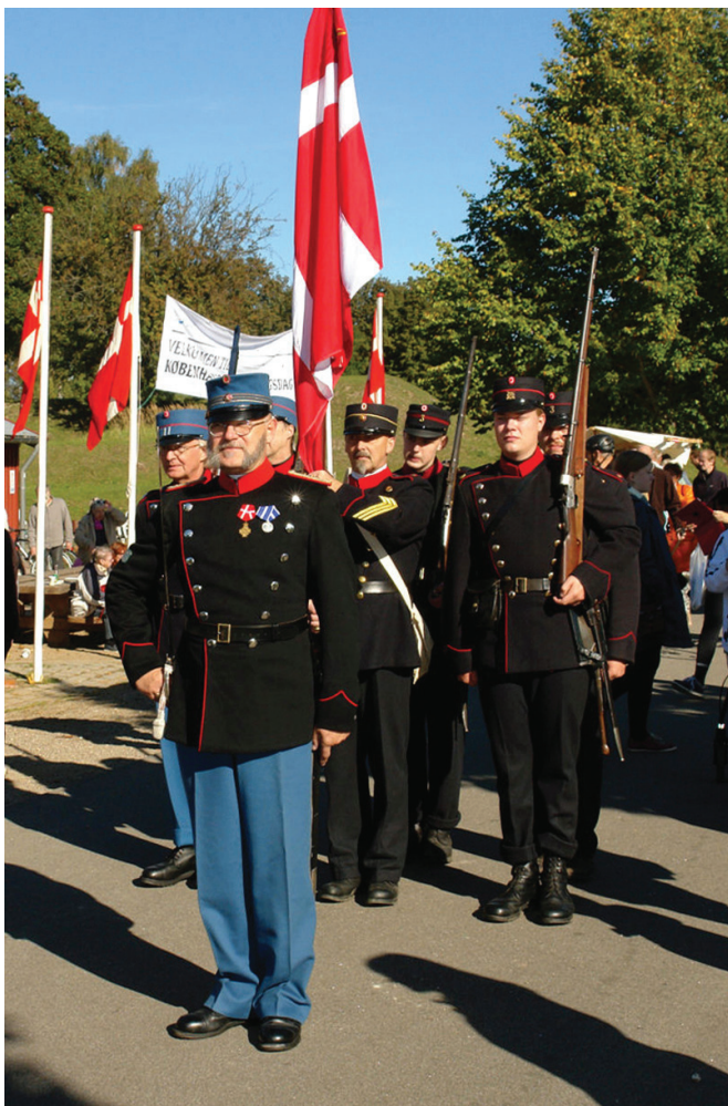
Fæstningsartillerister og fodfolk 1914-18