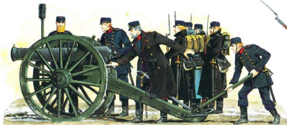
12 pd. Kuglekanon (system 1864)