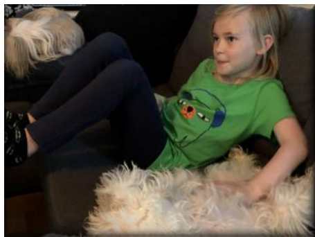
Att få mysa, kela och vara nära sin familj, en klar favorit enligt enkätundersökningen.

för andra djur svarade 100 % av uppfödarna att rasen var måttligt till mycket intresserad. Inom ägarenkäten ansåg ca 20 % att hundarna var rätt ointresserade av andra djur vilket majoriteten härledde till ointresse.