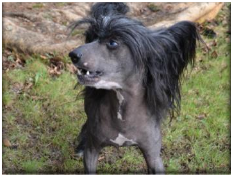
Att skälla kan vara ett sätt att hantera en situation som hunden inte känner sig bekväm med

Enligt enkätsvaren så upplevdes majoriteten som orädda, över 70 % svarade mellan 0-3 på den tiogradiga skalan. Uppfödarnas samlade generella bild av rasen visade på en något mer orädd hund än de individuella svaren. Uppfattningen av när hundarna visade rädsla var framför allt kring okända människor, vid höga plötsliga ljud och i specifika situationer.