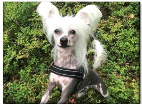
Kinesen beskrivs ofta som att den ser vår själ.

I enkäten ställdes 30 frågor om rasens personlighetsdrag. På den tiogradiga skalan var "0" samma som "inte alls" och "10" samma som "mycket". Enligt enkätsvaren var den samlade uppfattningen av rasen en