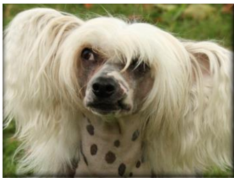
Talande blickar, roliga miner och en känsla för drama är en del av kinesens väsen

mycket intelligent, självständig, rätt modig, problemlösande hund som kan vända sig till sin ägare för viss hjälp. Rasen upplevs av majoriteten som samarbetsvillig, lättlärd, rätt lugn men än dock energisk. Uppfattningen är också att den är lyhörd, men envis, och mycket uthållig med självbevaringsdrift.