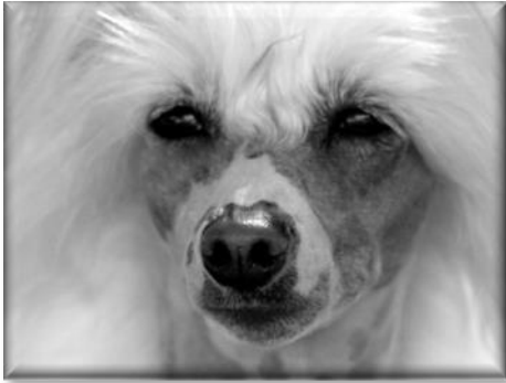
Svåra att inte älska...

hund med en speciell personlighet som går rakt in i hjärtat. De flesta har en så stark anknytning till rasen att de inte kan tänka sig ett liv utan den eller att de upplevt rasens unika särdrag så tilltalande, i jämförelse med andra raser de haft, att de blivit helt "sålda" på rasen.