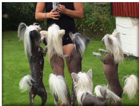
Intresse för människan eller det hon bär?

Deltagarna fick gradera från 0-10 hur bra de upplevde att CCD fungerade som sällskapshund, där 10 var "Utmärkt". Inom båda enkäterna svarade 87 % mellan 8-10, vilket tyder på att rasen uppfattas som en utomordentligt bra sällskapshund. I uppfödarenkäten svarade ingen lägre än grad 7 och i ägarenkäten var det enbart tre individer på grad 2, två individer på grad 3, fem individer på grad 4, nio individer på grad 5 och åtta individer på grad 6, av totalt 363 individer .