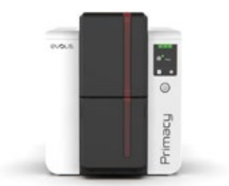
Evolis Neuheit Primacy 2