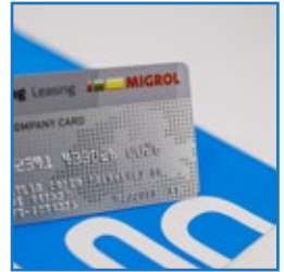
Prägung & Personalisierung