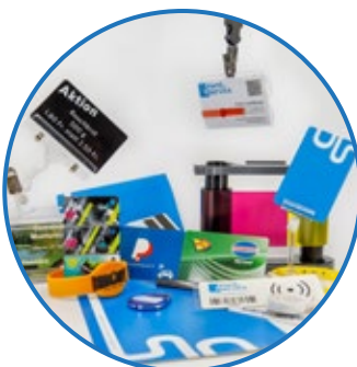
Badges, Zubehör & vieles mehr!