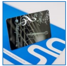
Effekte & Hologramme