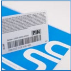
Rubbel & Unterschriftsfeld