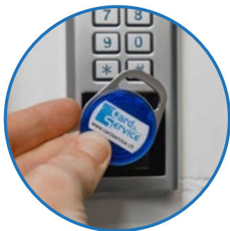
Tags & ID-Medien