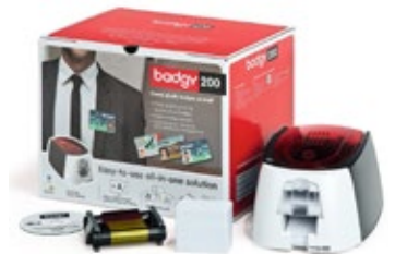
Kartendrucker Komplett Set