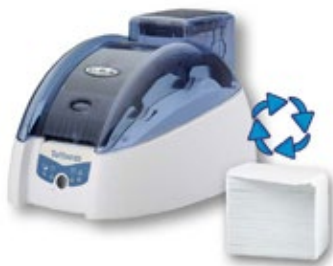
wiederbeschreibbare Karten drucken