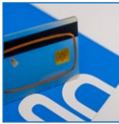
Chip / RFID / NFC / Codierung