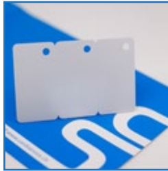
Spezial Formen & Grössen