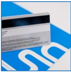
Magnetstreifen / QR / Barcode